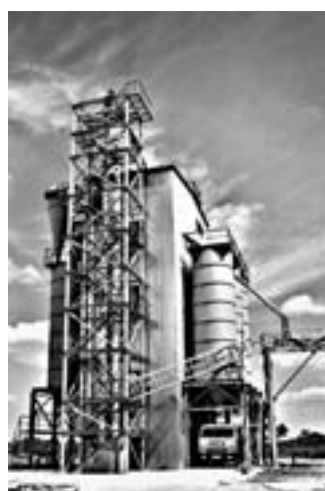
Новый зерноочистительный комплекс.

Руководитель предприятия также отметил, что ценовая политика на зерно складывается каждый год разная: — В прошлом году выручка была неплохая, мы смогли на эти деньги строить новую линию очистки зерна. Каждый год посевные площади увеличиваются, поэтому было принято решение сле-