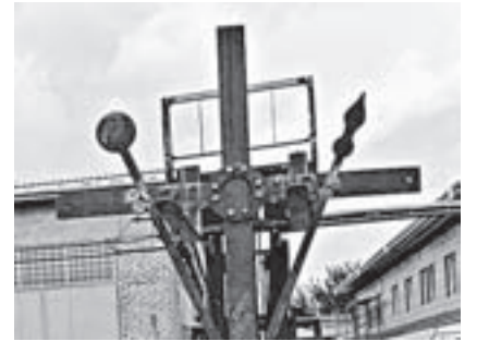
Копия афонского креста.

Рабочие, инженеры и священники занесли части креста на вершину Синюхи на руках. Монтаж занял почти десять часов. Как пояснили «АП» в Алтайской митрополии, установка креста приурочена к отмечаемому в нынешнем году 1000-летию присутствия русских монахов на Святой горе Афон.