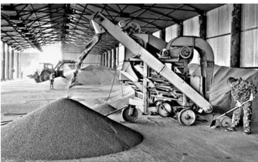
Теперь на складе просторно.

— Как вам удается достичь высокой урожайности озимых?