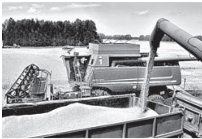
Более 60 центнеров с гектара собираются получить в этом хозяйстве.

таких парней сразу примечают, точно к нам вернется, у него закалка деревенская и тяга к профессии есть. Будет работать на комбайне.