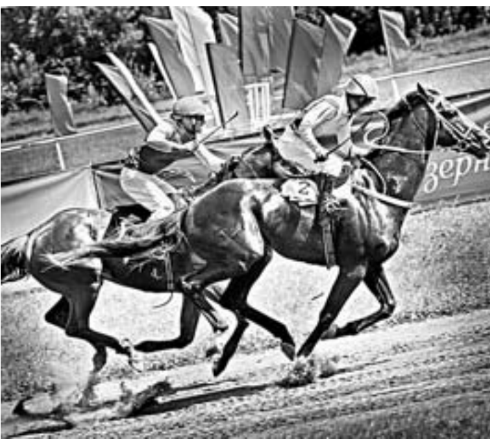
Дорожка звенела от копыт.

В Алтайском крае интенсивно развивается коневодство, по поголовью лошадей он входит в пятёрку лидеров среди регионов Российской Федерации. Особая роль отводится у нас спортивному коневодству. Его центром остаётся Барнаульский ипподром, история которого насчитывает более ста лет. Сегодня краевой ипподром – крупнейший в Сибири и один из лучших в стране. Ежегодно здесь испытывают более 250 лошадей рысистых и верховых пород. Благодаря усилиям специалистов алтайские лошади прославились своими рекордами далеко за пределами региона.