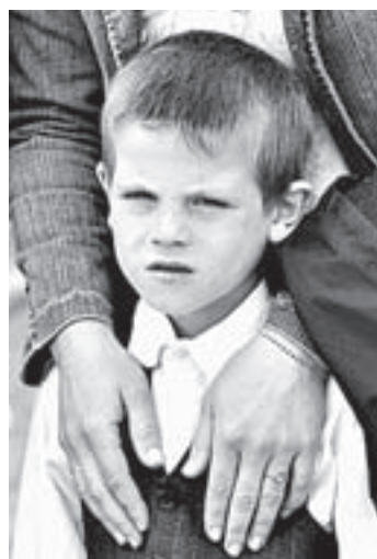
Задача родителей первоклассника – поддерживать.

– Центр здоровья часто работает в детских коллективах. Наши специалисты спрашивают, едят ли дети дома утром. 65–70% опрошенных учеников дома не завтракают. Родители