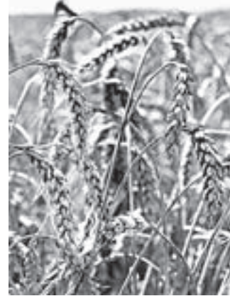
Зимушка востребована у фермеров.

– Можно я работать пойду? – просит он. – Пока стоит