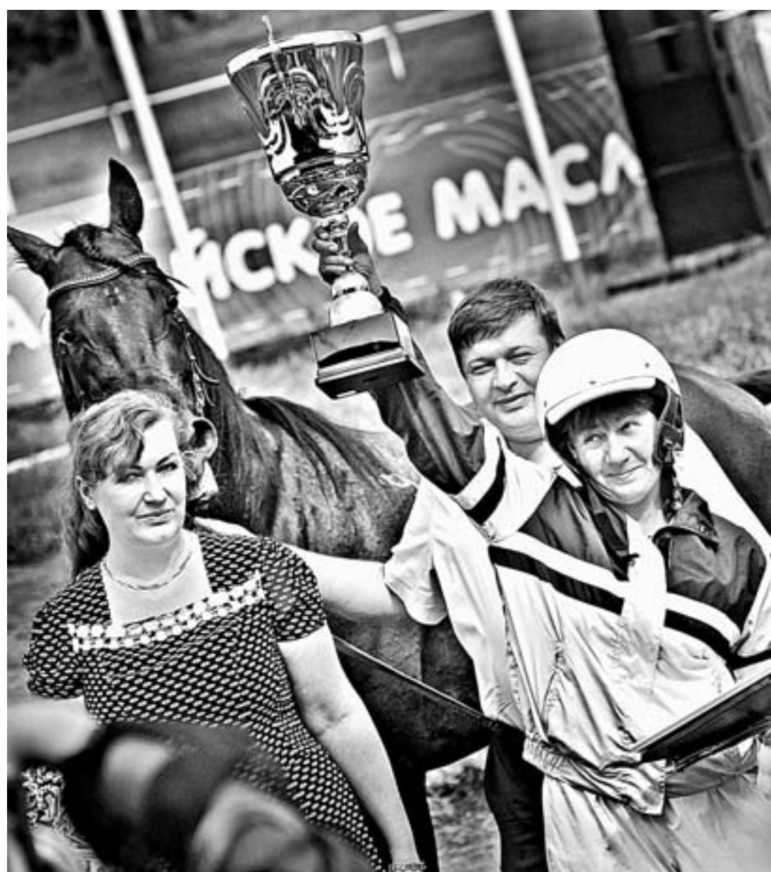
Кубок губернатора – в награду.