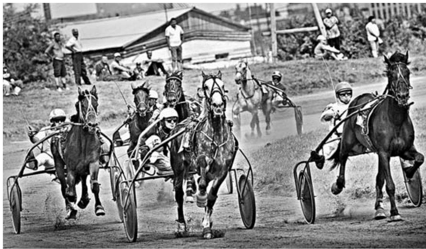
На вираже – орловцы.