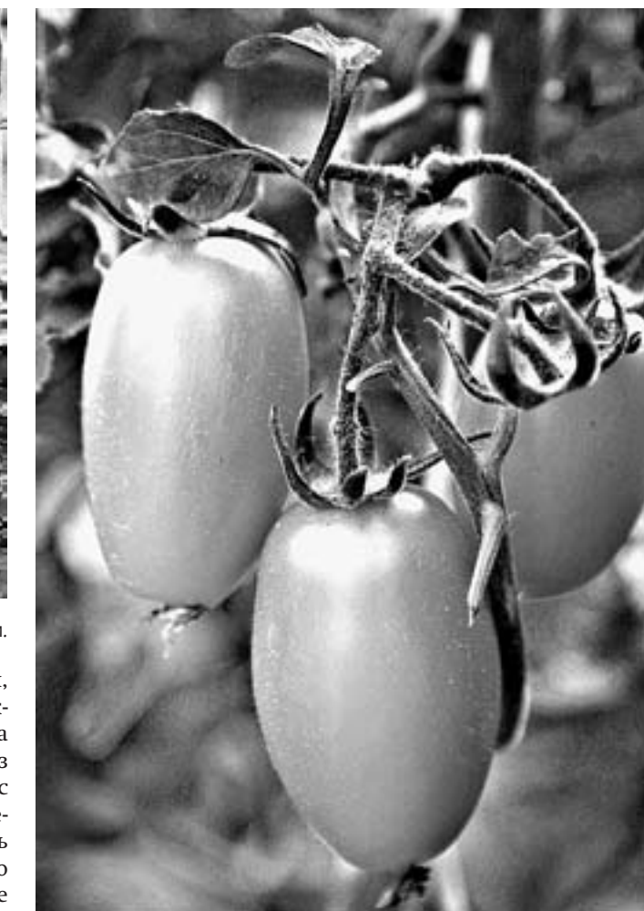
Трудоемкая культура вознаградила людей хорошим урожаем.

– В период созревания томатов, культуры весьма трудоемкой, когда мы не справляемся своими силами, охотно принимаем на подработку пенсионеров, бюджетников, молодежь, – рассказывает профессор, доктор сельхознаук Светлана Угарова. – Подростки – особая тема. Каждое лето по программам службы занятости трудоустроиваются к нам приходят школьники и студенты от 14 до 18 лет. Я порой слышу упреки в свой адрес, мол, нерентабельно это. Да, дети менее выносли-