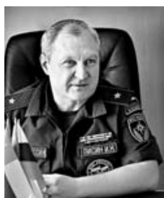
Игорь Лисин: «Старосты – наши лучшие помощники».

Институт сельских старост становится главным помощником оперативных служб в обеспечении безопасности населенных пунктов края. Комплексная защита отдаленных сел от различных угроз – общая забота всех уровней власти, но общественники играют в этой системе особую роль. «Старосты всегда находятся в эпицентре событий», – рассказывает начальник Главного управления МЧС России по Алтайскому краю генерал-майор внутренней службы Игорь Лисин. – Благодаря этому инициативным и неравнодушным людям в экстренные службы своевременно поступает самая достоверная информация о положении дел в поселениях».