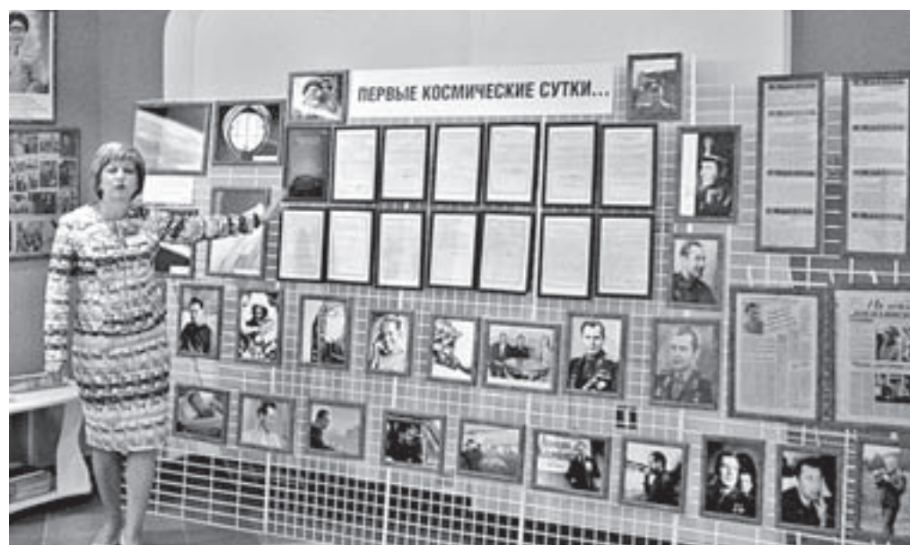
Экспозиция в лицах.

Не менее интересным является также другой документ – бортовой журнал космического корабля «Восток», страницы которого также могут увидеть посетители выставки. Космический полет в записях самого Германа Степановича, выполненных на земной орбите, поминутно нам рассказывают о том, как он проходил: кому был передан первый привет из космоса, какая радиостанция работала лучше, как поэтапно выполнялась сложная программа полета – физическая зарядка, первый прием пищи в космосе, отдых и наблюдения за космическим пространством. Впечатления второго космонавта планеты также нашли отражение на страницах бортового журнала. Помимо записей в нем есть и рисунки, вы-