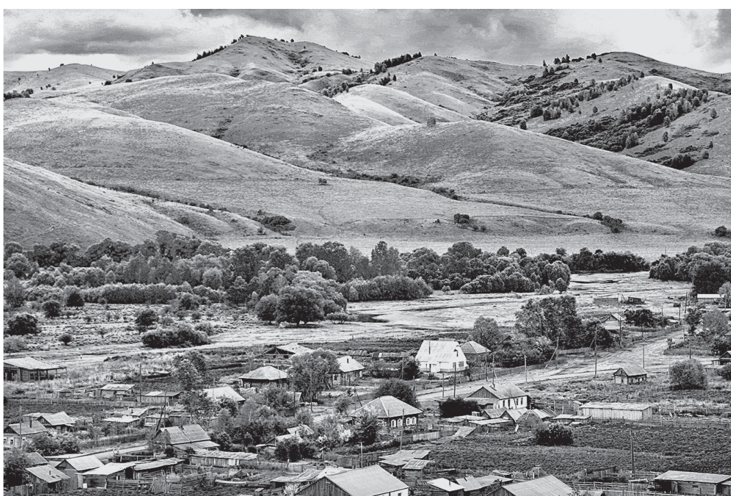
В отдаленных селах общественники играют особую роль в обеспечении защиты населения от чрезвычайных ситуаций.

– Это не тот человек, который самостоятельно должен ликвидировать возгорание, хотя и такое бывает. Самое главное, чего мы ожидаем от старосты, – это полная, достоверная информация о беде. Будь то пожар, подтопление и т. д. Староста – это объективный первоисточник, на сведения которого можно положиться оперативным службам и муниципальным властям. На основании полу-