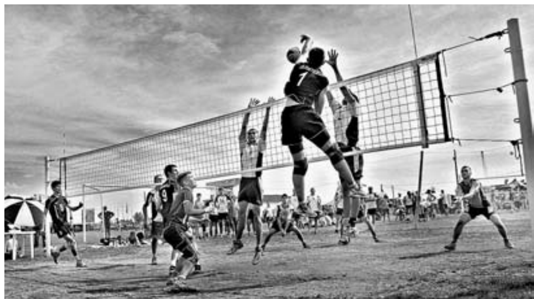
Волейбол в самом разгаре.

С 4 по 7 августа в селе Верх-Обское Смоленского района прошел Всероссийский фестиваль народного творчества и спорта имени Михаила Евдокимова «Земляки».