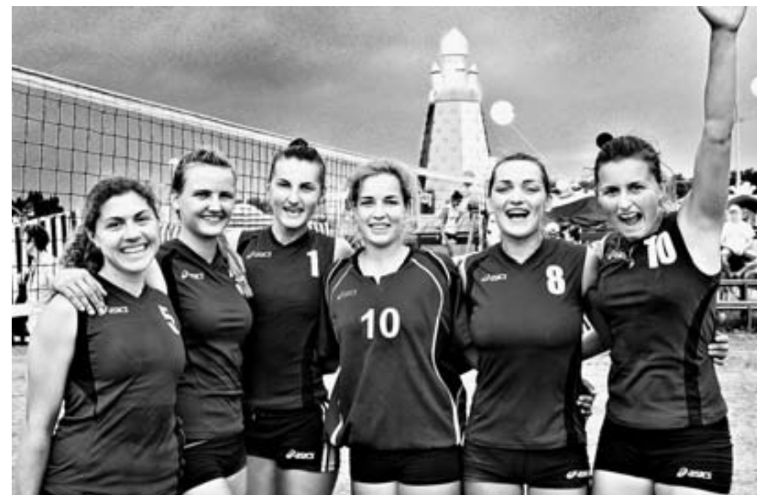
Чемпионки, волейболистки и просто красавицы – команда Б.Ю.И.