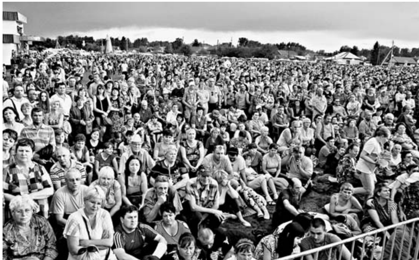
Тысячи людей пришли на вечерний концерт.