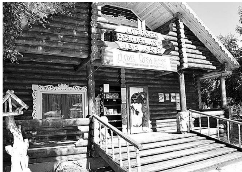
Резиденция Деда Мороза работает и летом.