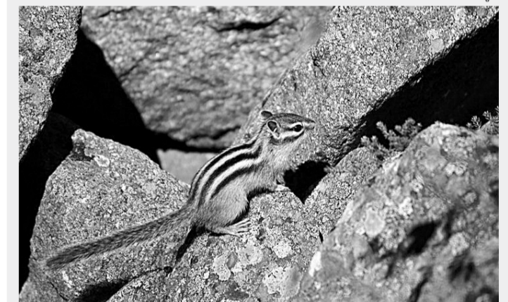
Подготовила Людмила ИЗВЕКОВА

РЕКЛАМА «АП», ул. Короленко, 105, 5 этаж, 501 каб. Тел. 63-34-78, факс 63-44-30.