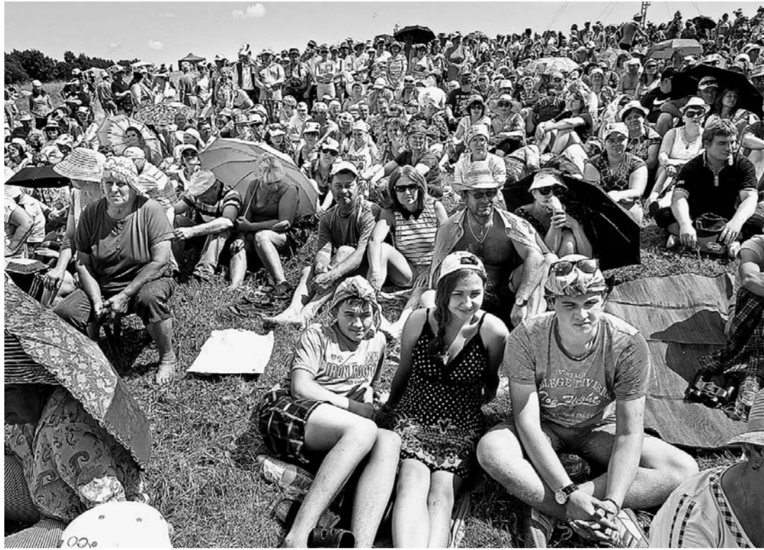
Жара не помешала насладиться праздничным концертом.

— На любом фестивале всегда ждешь, что вдруг твою работу заметят. А тут сразу Гран-при! В этом году фильм участвовал в VI Пеккинском фестивале (очень престижно), он понравился рядовым членам жюри, к нам подходил немецкий оскароносный режиссер, интересовался деталями сцен, у нас даже зародилась какая-то надежда, но