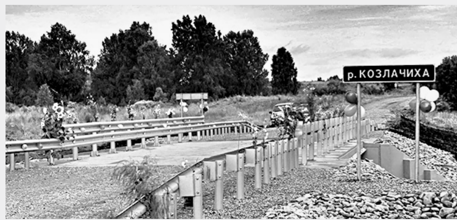
Мост через реку Козлачиху прослужит не менее 70 лет.

Екатерина ЗЕЛЕНОВА (фото предоставлены Главным управлением строительства, транспорта, жилищно-коммунального и дорожного хозяйства Алтайского края)