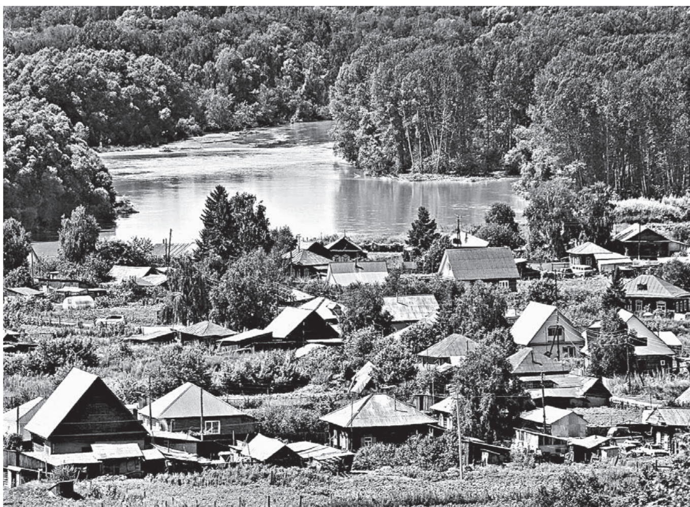
Сростки нан всегда поразили гостей своей открытостью и душевностью.