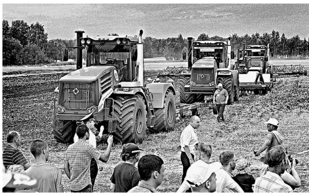
Демонстрационный показ техники.