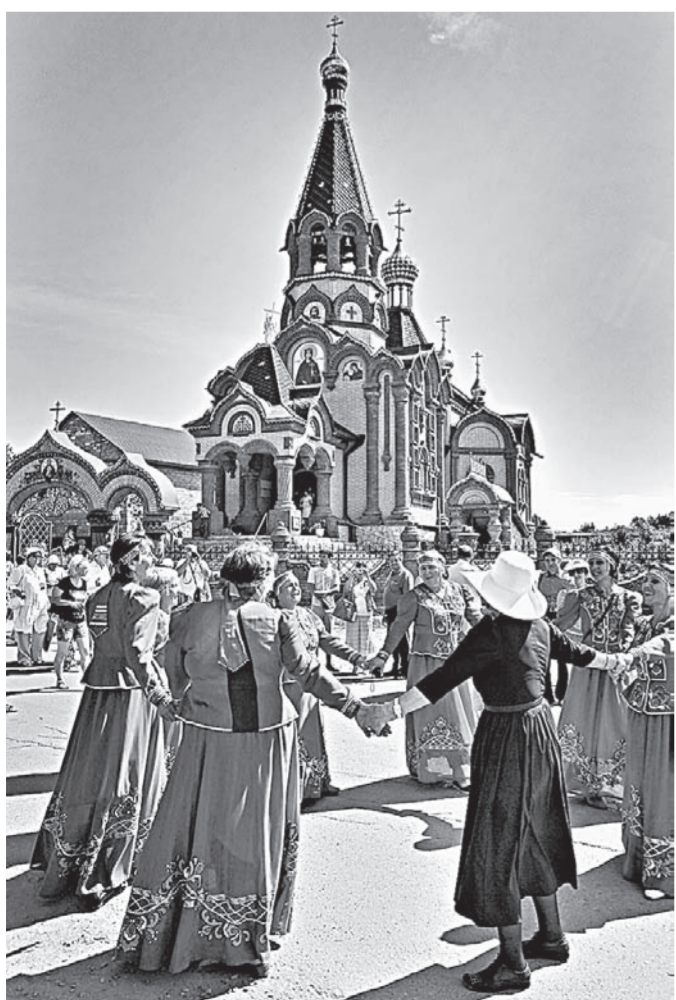
Народные гулянья в центре села.