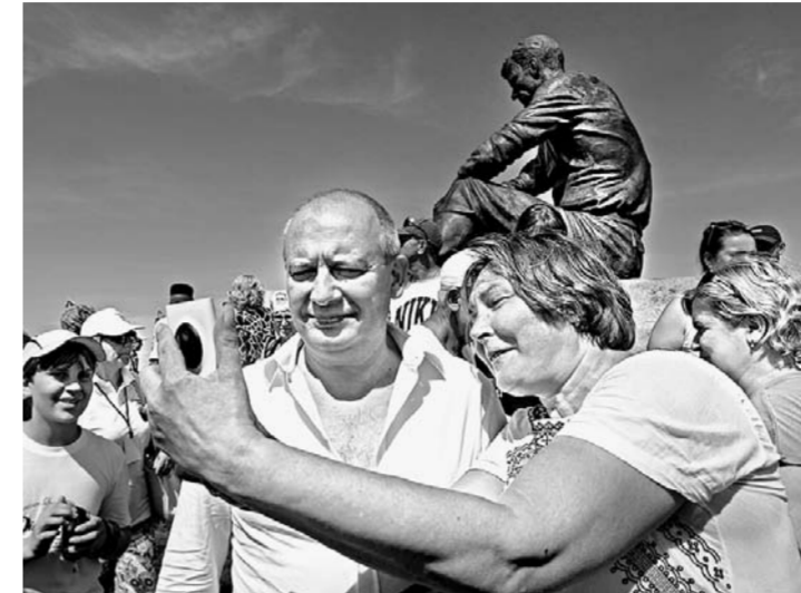
Дмитрий Марьянов — фото на фоне Шукшина.

Сейчас на телевидении засилье пошлости, и я далек от мысли, что смогу своими фильмами глобально изменить ситуацию, но по крайней мере моя совесть чиста, я делаю все что могу. Считаю любое нравственное кино православным, с