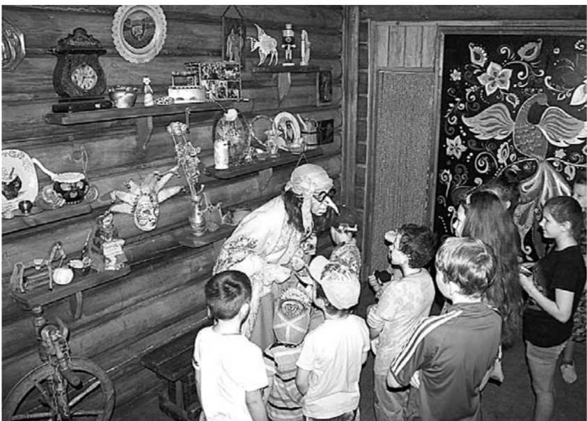
Ягуся знакомит детей с русскими знаками.

Во время каникул предприниматели Барнаула, занятые в сфере детского образования и досуга, стараются предложить дополнительные услуги своим подопечным, которые проводят лето в городе.