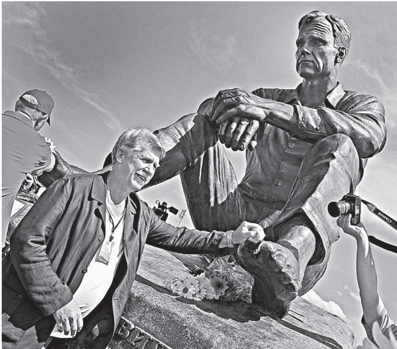
Заслуженный артист РФ Сергей Баталов прикоснулся к памятнику Шукшина на удачу.