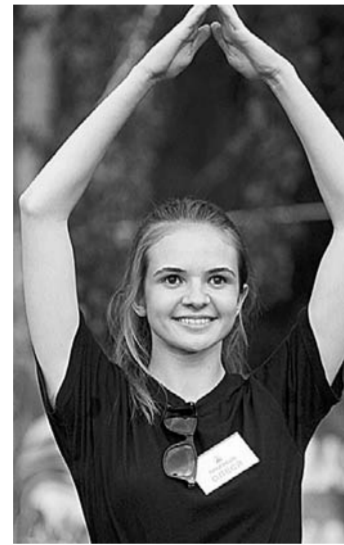
Незменные эмоции земной цивилизации.

Ощущением дежуж на живописной полянке в березовом перелеске близ села Каюшка накрыло уже на подъезде к лагерю, разбитому участниками туристического слета. Подернутые пеллом угли костра и крыльа палаток — классика молодости жителей нашей страны, возрожденная в Родинском районе, где прошел традиционный туристический слет.