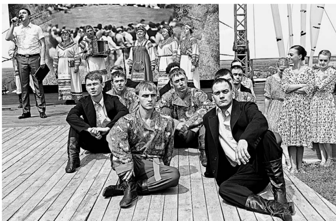
В открытии фестиваля приняли участие лучшие творческие коллективы края.

церквей Новосибирска, «Рядом с нами» получил специальный приз губернатора Алтайского края «За самое совестьное и душевное кино». Вот что думает о своем кино сам режиссер: — Для меня кино — это миссия, возможность получить широкую площадку для проповеди. Это вторая игровая картина, которая участвует в Шукшинском кинофестивале.