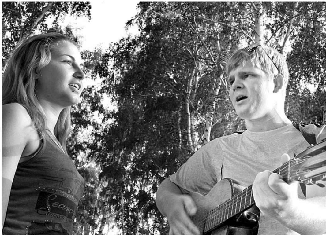
«Изгил гитары желтой». Этим летом — на родинской земле.