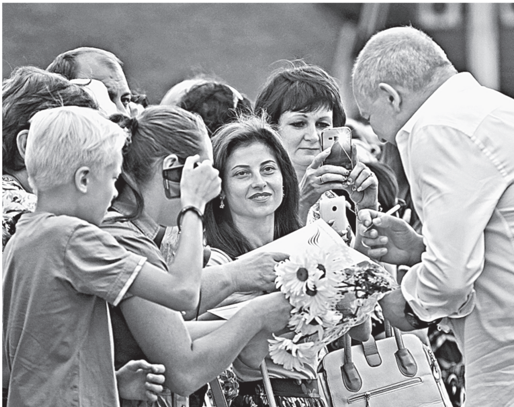
Дмитрий Марьянов раздает автографы.

На Алтае в самом разгаре Шукшинские дни. В регионе проходят творческие встречи с писателями и артистами, презентации, выставки, спектакли. Всего в основную афишу фестиваля вошло около 30 мероприятий.