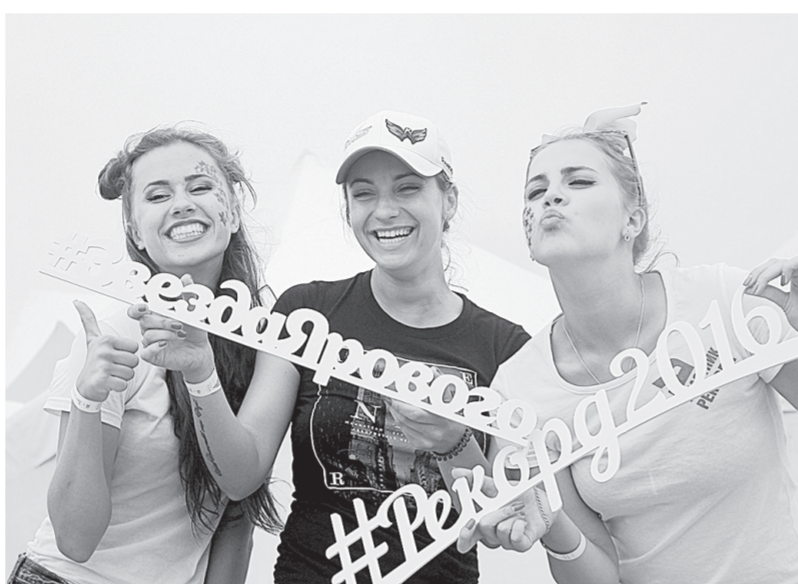
На пляже каждый мог сфотографироваться с аниматорами.

кету и получить белый браслет на руку с надписью «Я – звезда Ярового». К полудню на двух пляжах уже зарегистрировали более 1000 человек. Тамара Бортникова добавляет: