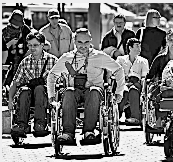
В населенных пунктах не должно быть непреодолимых препятствий.