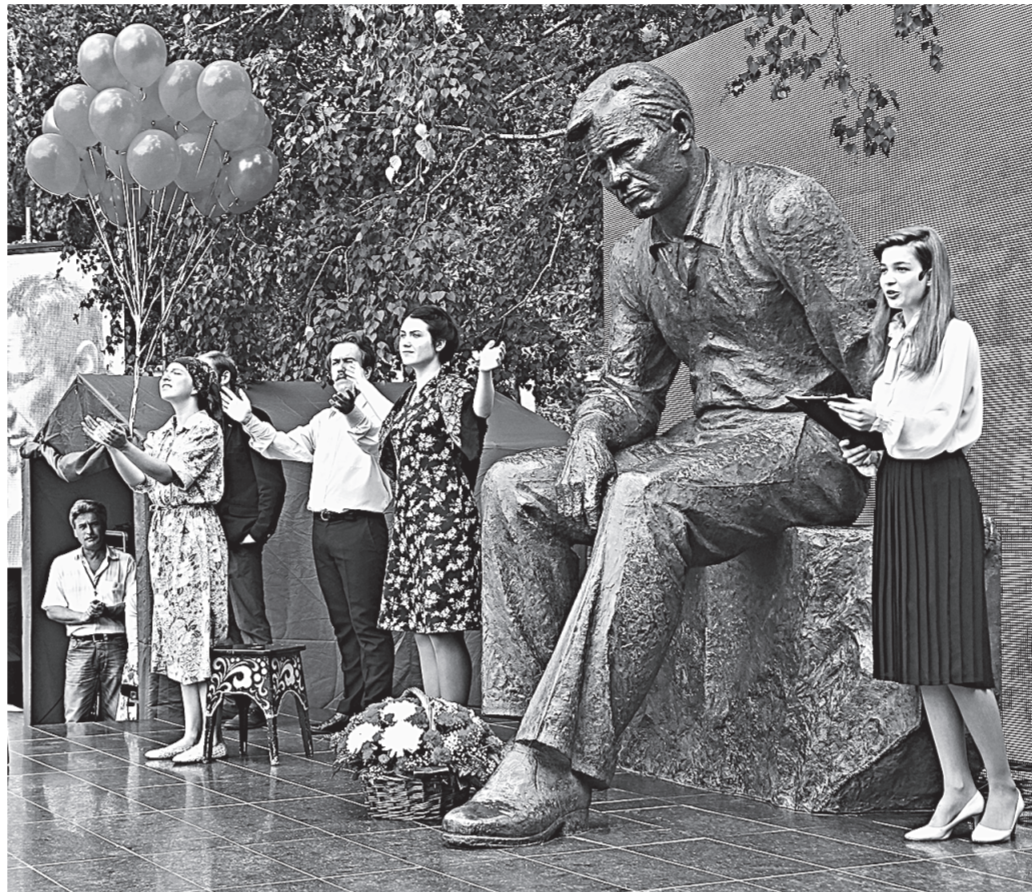
Воспитанники мастерской Тумашова открыли Шукшинские чтения.

– Он близок и дорог каждому из нас. Как никому другому ему удалось раскрыть душу человека русской деревни. Я сам сельский и, когда читаю его рассказы, невольно нахожу в них от-