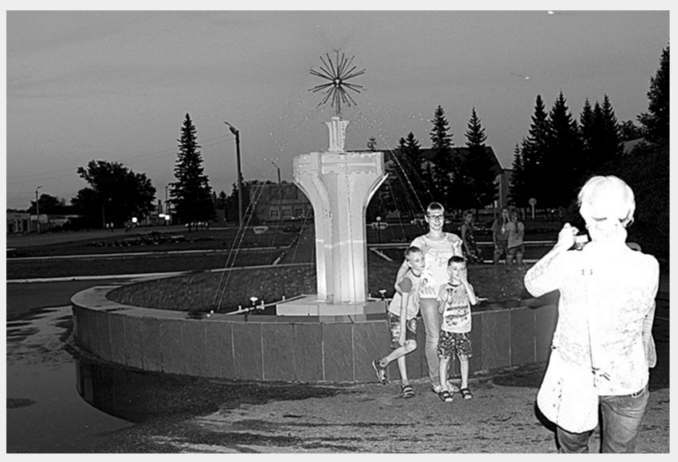
Место встречи изменить нельзя.

Фонтан и сейчас - большая редкость для сельских территорий. А в 1979 году, когда над проектом работала плеяда художников Родино, он был уникальным явлением. В советское время гидротехническое сооружение значилось на балансе жилищно-коммунального хозяйства.