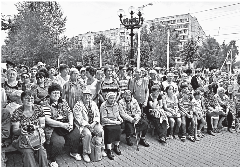
Море людское на улице Шукшина в Барнауле.