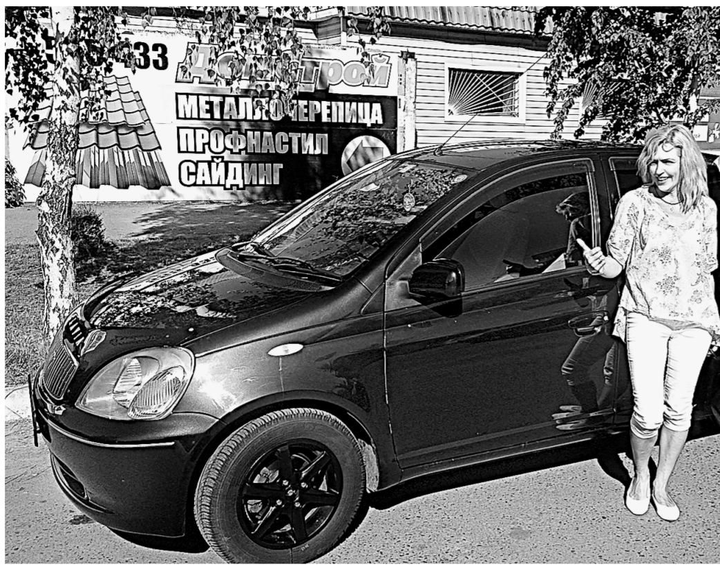
При разном освещении машина меняет цвет.

Но жизнь в мегаполисе стремительная, быстро меня-