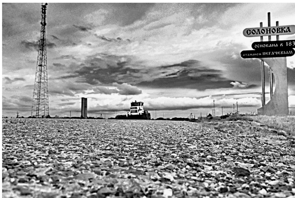
Относительно дешево, достаточно надежно.

Дорожники намерены освоить большую часть выделенных на ремонт этого участка средств уже в нынешнем году. Чтобы спокойно, учитывая социальную значимость объекта, выполнить работы в полном объеме к 1 сентября 2017 года. Общая стоимость ремонта дороги составит 46 миллионов рублей, из них 24 миллиона будут израсходованы в текущем году. По словам начальника Южного ДСУ Вик-