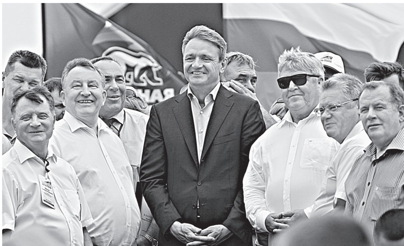
Открытие Всероссийского агрофорума прошло на достойном уровне.

тий, зарплата сотрудников. Экономическая ситуация улучшается, может быть, не так, как хотелось бы, но мы в начале пути. Быть аграрным краем, сельхозтоваропроизводителем сегодня в почете. Алтайскому краю есть что предложить российскому рынку. И именно импортозамещение в сельхозтехнике стало центральной темой экспозиции. На выставке сосредоточены все последние достижения российских производителей сельхозмашиностроения. Александр Ткачев отмечает, что в регионе его сохранения и успешно развивают. – Я увидел здесь десятки предприятий, которые про-