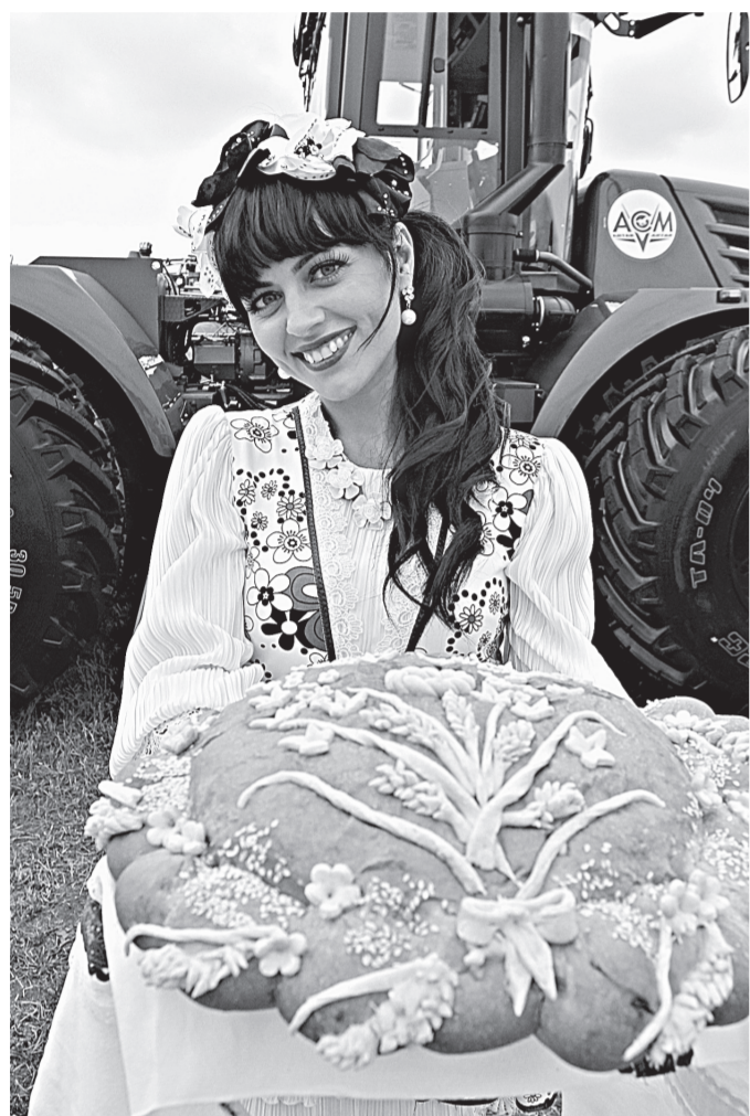
Хлеб-соль гостям праздника.

«Всероссийский день поля»: потенциал развития агропромышленного комплекса региона высоко оценен на федеральном уровне.