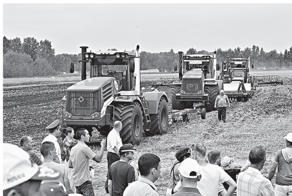
Демонстрационные показы техники в работе вызвали большой интерес.

– Мы решаем ряд важных задач: наращиваем объемы производства продовольствия для страны, выполняем программы по импортозамещению, в первую очередь в отрасли сельхозмашиностроения, – сказал он. – Я с особой благодарностью говорю о том, что мы получаем поддержку аграрного сектора не только по программе развития сельского хозяйства, но и по программам поддержки промышленности России. Каждый пятнадцатый рубль, который государство направляет в аграрное машиностроение, получает Алтайский край. Это служит дополнительным импульсом для нашей исторически значимой отрасли.