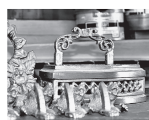
Сувенирная продукция «Литкома» пользуется спросом.