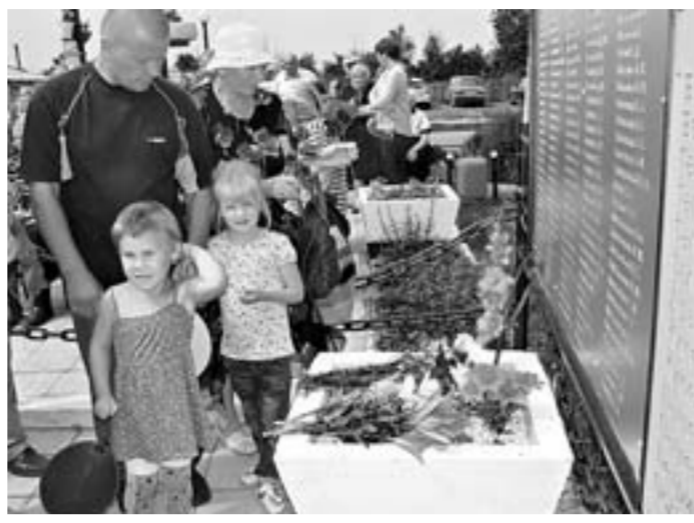
Открытие мемориальных досок в Константиновке.

6 июля 2016 года в селе Константиновка Кулундинского района на мемориальном комплексе, посвященном павшим на полях сражений в годы Великой Отечественной войны, были торжественно открыты еще две мемориальные доски.