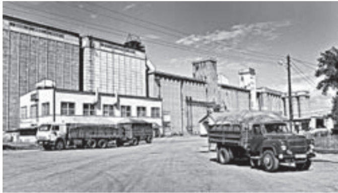
Предприятие способно принимать на переработку до 5000 тонн зерна в сутки.

– В первую очередь мы следим за качеством поступающего зерна, – рассказывает начальник производственно-технологической лаборатории Тамара Сычева. – И строго следуем ГОСТу. То, что требует от нас сегодня рынок для определения качества, у нас есть. Лаборатория должна быстро реагировать на запросы участников рынка. К примеру, хлебопекам нужны