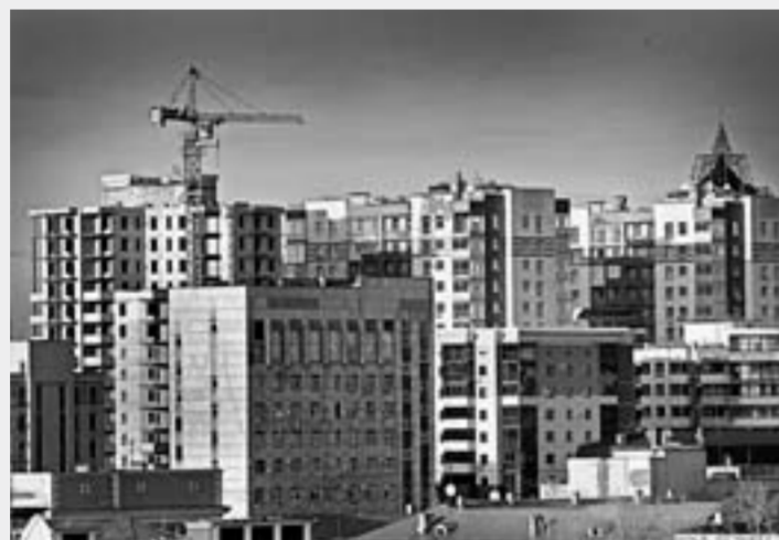
Нормы контроля за строительной отраслью ужесточаются.

«До сих пор техрегламенты, или ГОСТы на качество продукции, горючего и т. д., различались, а сейчас их привели к единообразию. Именно для этого согласно изменениям, внесенным в закон 44-ФЗ от 5 апреля 2016 года, в госзакупки будут внедряться национальные стандарты.