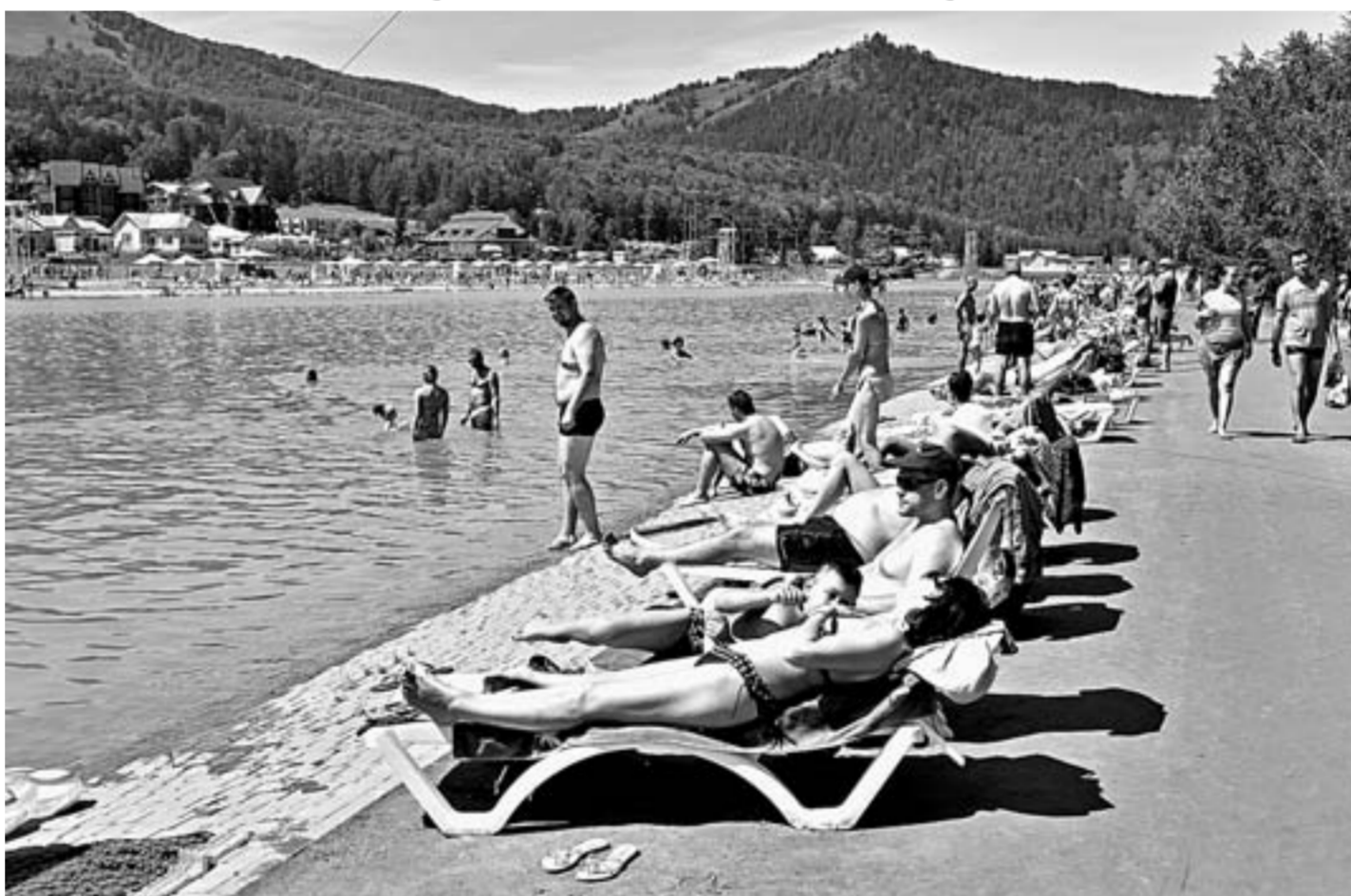
56 пляжей в Алтайском крае безопасны для отдыха.

ГУ МЧС по Алтайскому краю опубликовало список пляжей, где разрешено купаться, всего их 56. В Барнауле отдыхающие могут спокойно наслаждаться жарким сезоном на пляже санатория «Барнаульский», «Водном мире» и на острове Помакин. Одобрены зоны отдыха в городе-курорте Яровое, это