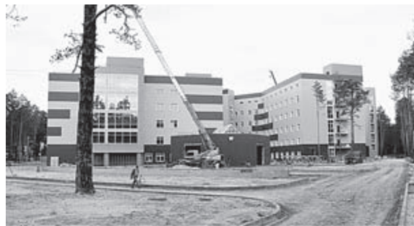
Первые роды в перинатальном центре пройдут уже в этом году.

край – в числе шести регионов страны, ведущих строительство перинатального центра на высочайших темпах и в короткие сроки. Возведение нового учреждения здравоохранения находится на контроле у федерального ведомства, и Вероника Скворцова в прошлом году посетила его строительную площадку.