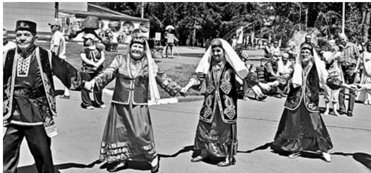
Сабантуй в разгаре.

– Большую поддержку нам оказывают представители краевой и городской администраций. В этом году выиграли губернаторский грант, на полученные средства сшили костюмы для молодых артистов. Погода способствует тому, чтобы Сабантуй прошёл задорно и интересно. Сегодня присутствовали гости из Кузбасса, Республики Татарстан. Они также выйдут на сцену, расскажут о традициях нашего народа с помощью песен и танцев.