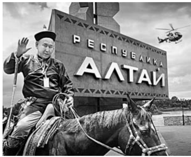
Здесь прошлое переходит в будущее.