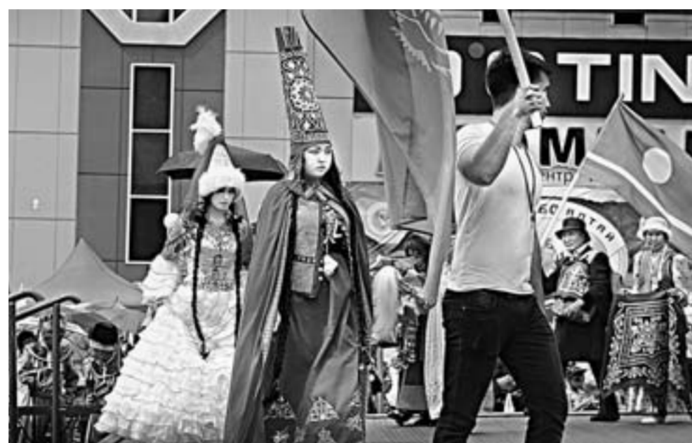
Горный Алтай – земля с богатой и разнообразной культурой.

Праздничная программа продолжилась торжественным собранием в Национальном театре Республики Алтай им. П.В. Кучника. В зале собра-