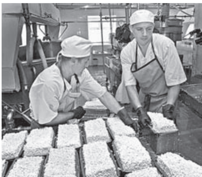
Усть-Калманский маслозавод. Только натуральная продукция.

ный рынок в Китай, Таджикистан, Монголию, Узбекистан, Казахстан, Киргизию.