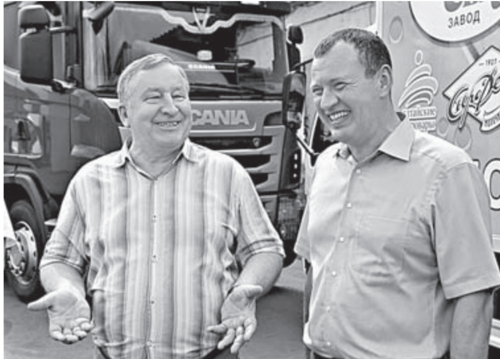
Губернатор Александр Карлин и директор маслозавода Алексей Крысанов.

За последние годы в развитие предприятия вложено 2,6 млн рублей, планируется направить еще 6,6 млн. Это напрямую отражается на качестве продукции. И ее уже оценили жители Сибири, европейской части России, Урала и Дальнего Востока. Свыше 5000 тонн муки было поставлено на международ-