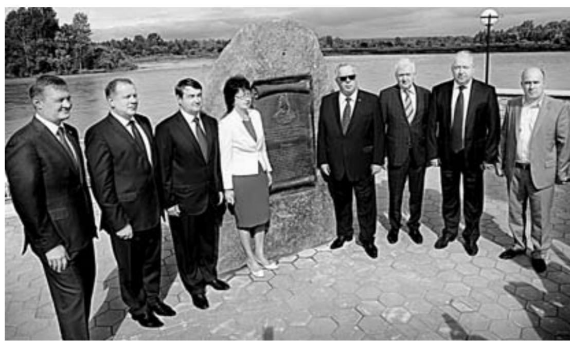
На въезде в республику построена смотровая площадка, установлена памятная доска с текстом Указа императрицы Елизаветы.