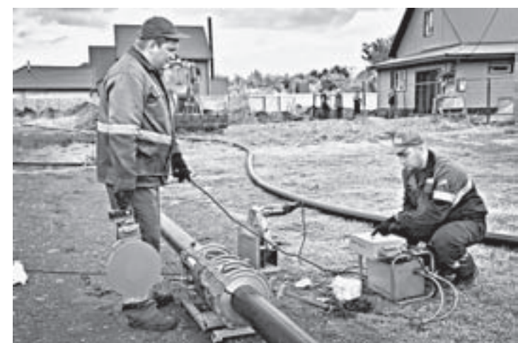
Идет сваривание полиэтиленовых труб.

К концу этого года строители должны завершить работы по газификации Зудилово, что в Первомайском районе.