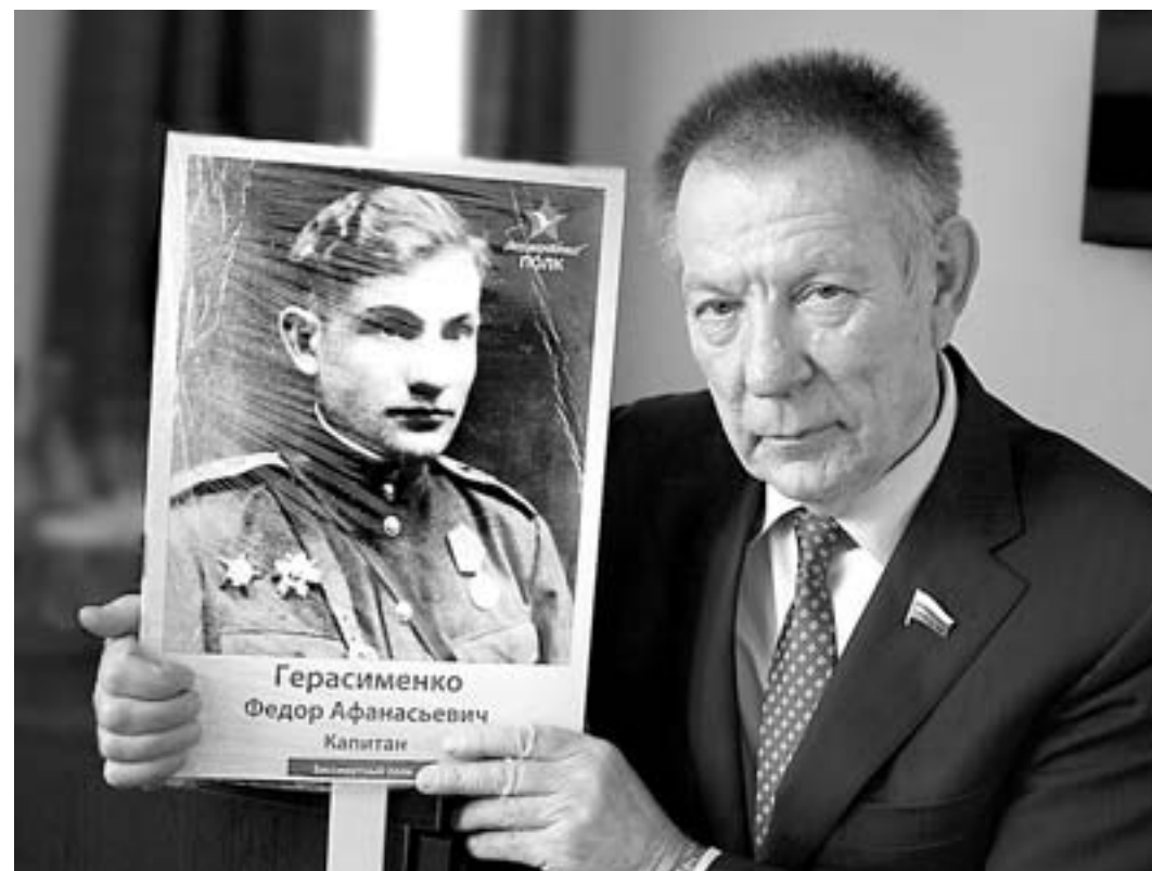
«Я горжусь своим отцом».