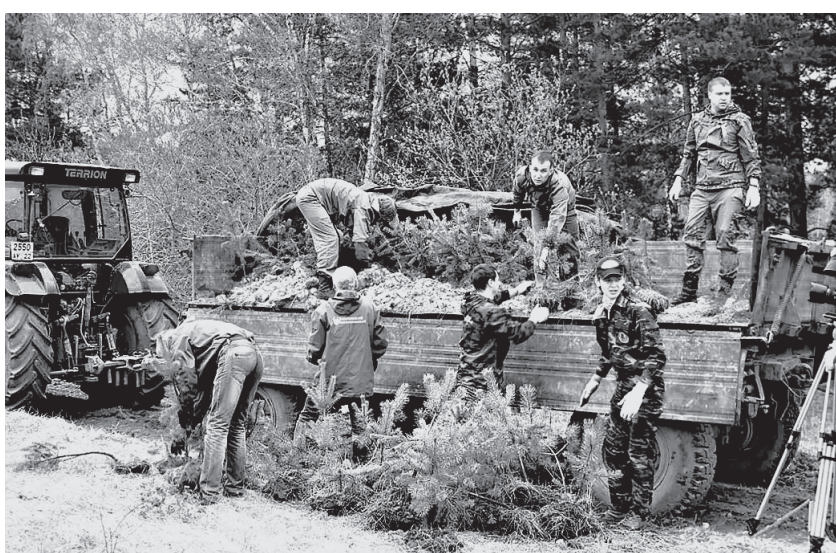
И эти молодые деревца встанут стеной на пути опустынивания.

— Сейчас кризис, нужны большие деньги, а их нет. А потом, это ведь не только забота края, бюджета, но и фермеров, про-