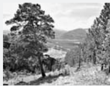
Вид на долину Инчи и Тугурецкий хребет.

На телеканале «Страна» в программе, посвященной Алтайскому краю, вышел сюжет о Тигирекском заповеднике. Зрители узнали о туристическом маршруте «Большой Тигирек». В сюжете были показаны природные достопримечательности заповедника: гора Разработная, разрез силурийских отложений, а также характерные представители животного мира особо охраняемой территории.