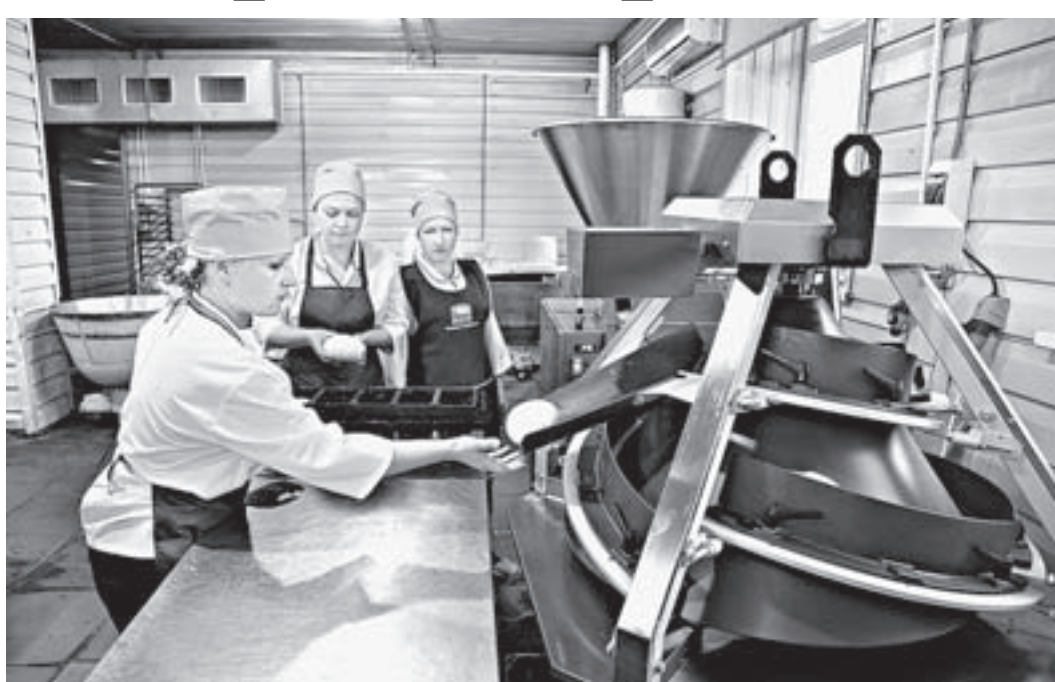
Кулундинский хлебокомбинат — одно из ведущих предприятий крайпотребсоюза.

Большая работа уже началась, механизм запущен. Формируется программа «Развитие потребительской кооперации как существенное условие обеспечения продовольственной безопасности регионов России». Алтайский