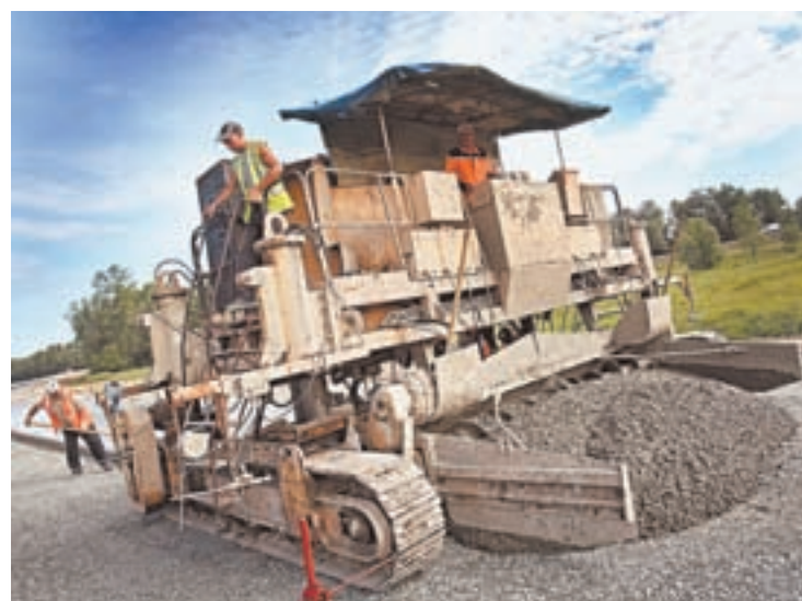
Машина со звучным названием «БУМ» укладывает цементно-бетонное основание.

Уникальные технологии используются при строительстве участка Чуйского тракта. В данный момент там ведутся работы по бетонированию основания дороги.