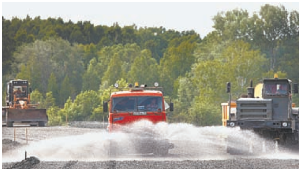
Около 50 единиц техники работает на участке.