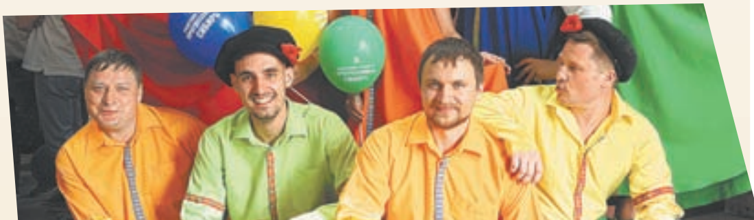
Представители Красноярского края, ставшие лучшими в номинации «Межрегиональное сотрудничество» с проектом «Прогрессивная Сибирь», отличились творческим подходом к делу.