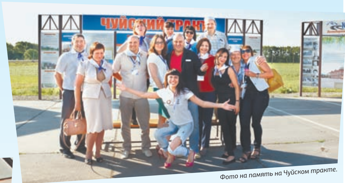
Фото на память на Чуйском тракте.