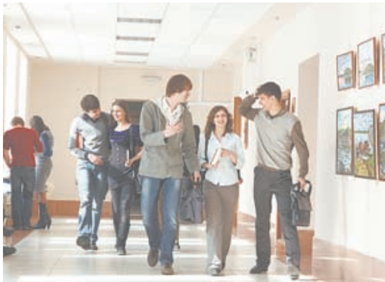
В этом году на бюджетной основе в СФУ будут учиться около 30 тыс. студентов.

Отличникам, медалистам (в том числе получившим в прежние годы серебряные медали) дополнительно начисляются