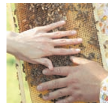
Пчелы здесь – добрые!