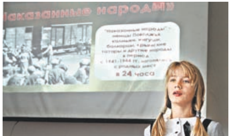
Школьники села Заводского рассказали о репрессиях.