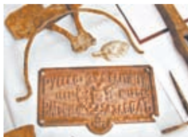
Предметы быта спецпоселенцев найдены на месте бывших землянок.

Отец не вернулся. Его отправили тогда в Магадан. Два года без права переписки. «Если б можно было хотя бы письмецо, – жалеет