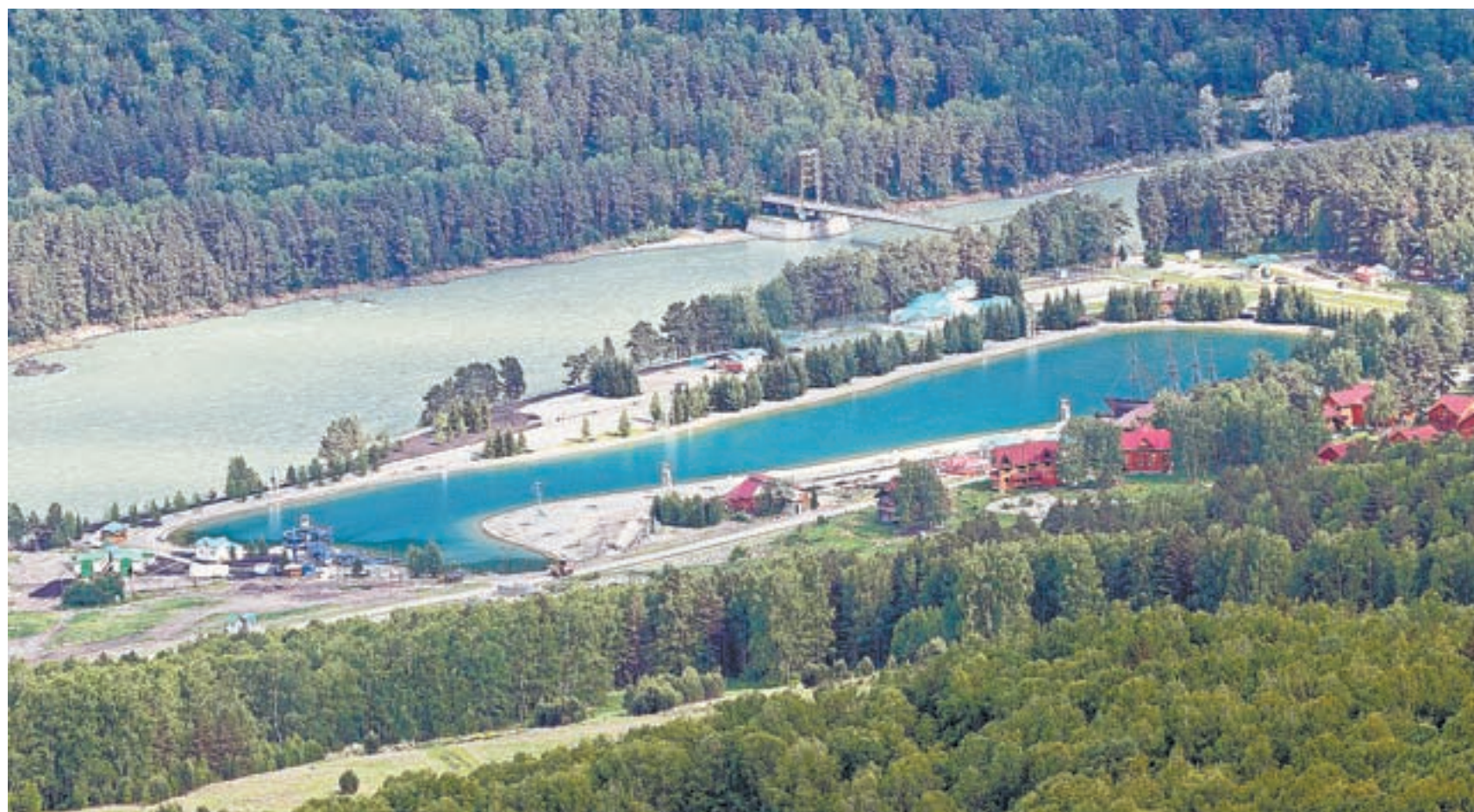
Такой вид открывается на Катунь и искусственное озеро со смотровой площадки.