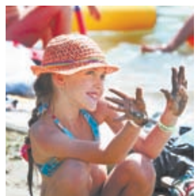
Хорошо на отдыхе!