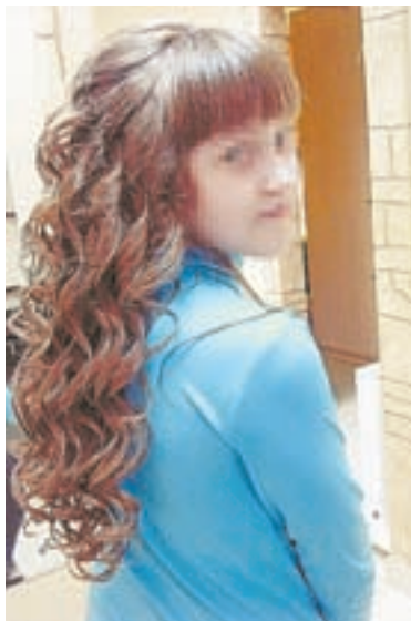
«Коса – девичья краса». Ее девочка остригла, чтобы мама не могла её таскать по полу за волосы.