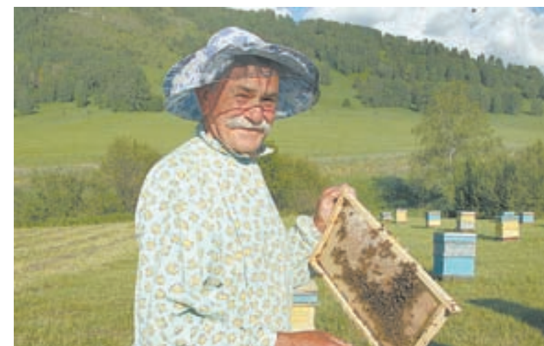
Для гостей на пасеке проводят экскурсии и предлагают попробовать различные сорта меда.

– Мы вынуждены сочетать работу для туристов и инвесторов. Поэтому активное строительство, как правило, идет осенью. К следующей весне новые туристиче-