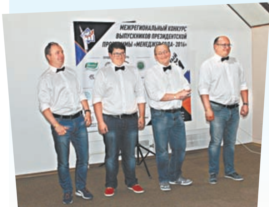
Победитель конкурса «Менеджер-2016» – алтайская компания CiSort. Ее серийная разработка фотосепараторов нового поколения для российского и зарубежного рынков стала лучшим проектом года.