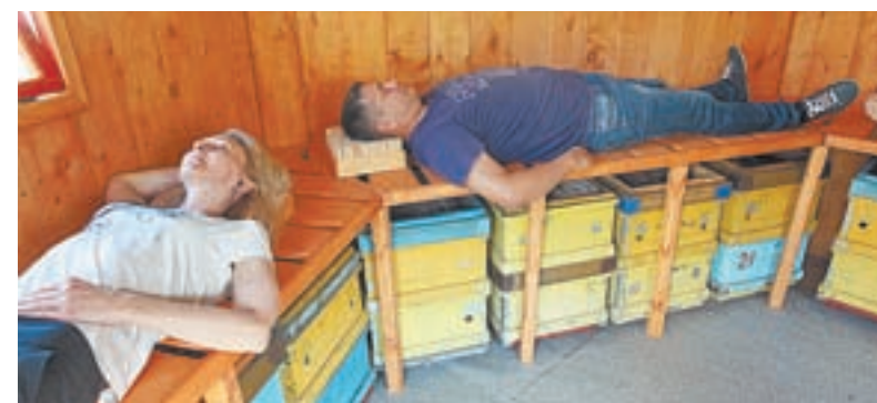
Сон на пчелах популярен у туристов.