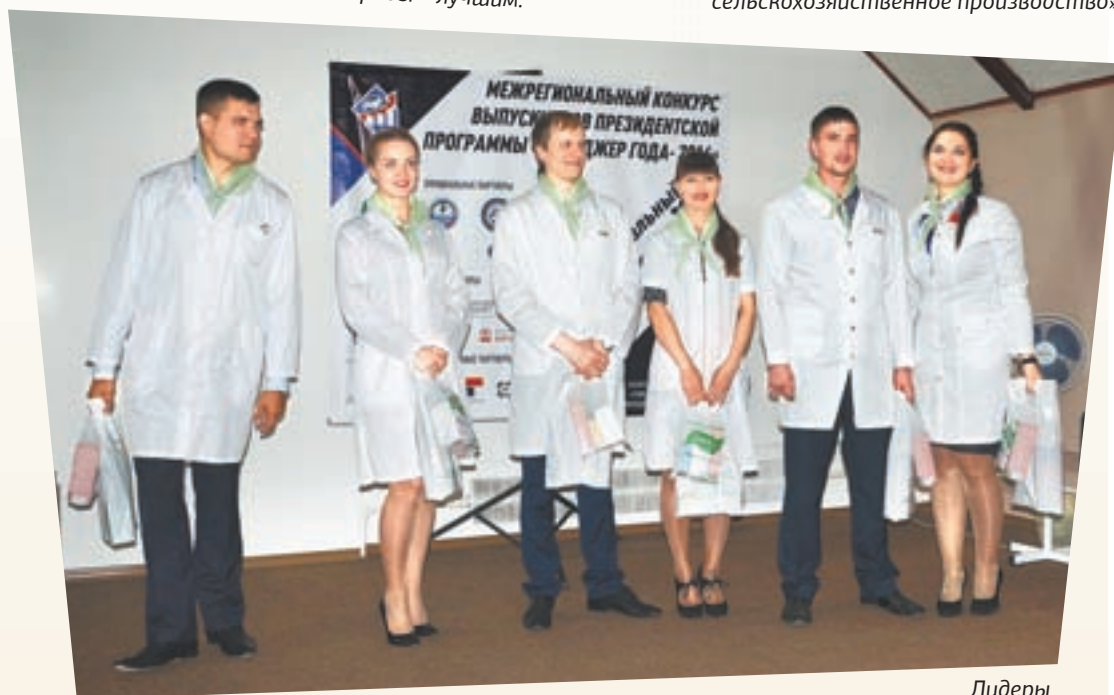
Лидеры номинации «Лучший социальный проект» – кемеровчане. «Эффективную поликлинику» они продемонстрировали на примере клинического консультативно-диагностического центра.