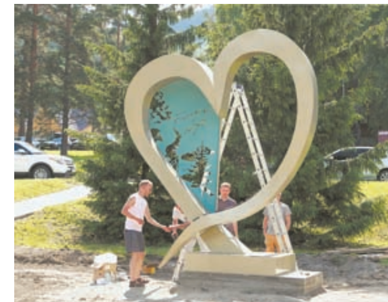
Стела для фото расположена в самом сердце «Бирюзовую Катунь».