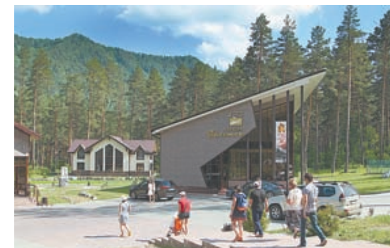
Галерея «Простор» для тех, кто хочет узнать об Алтае с помощью искусства.