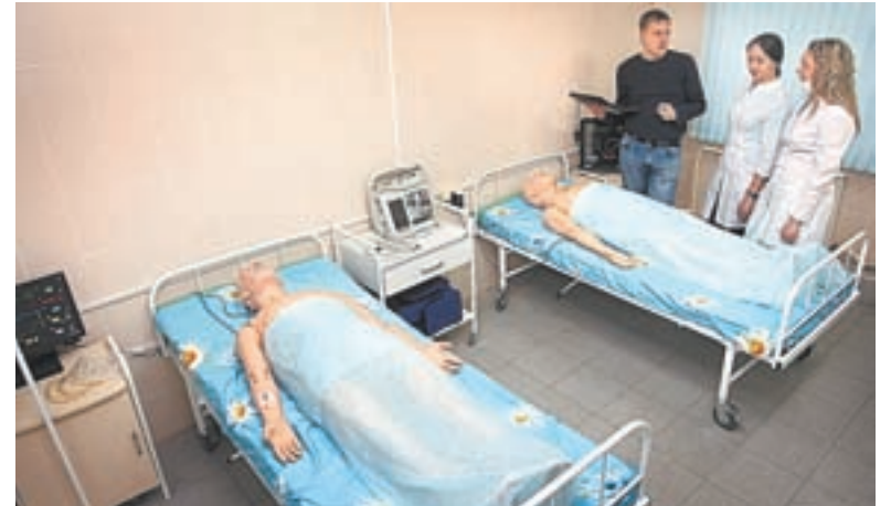
Будущие врачи пришли узнать о состоянии пациентов-манекенов.

В родовом зале готовится к появлению на свет малыша молодая женщина по имени Ноэль.