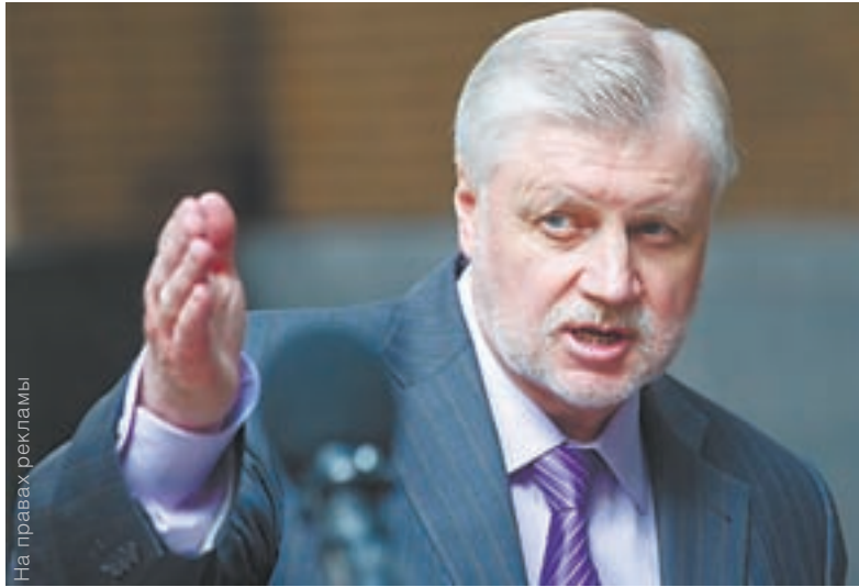
Сергей Миронов: «Нужно проявить политическую волю».

Увы, но как показывает практика, количество подходов к граблям не ограничено. По данным Центрального банка, в прошлом году производственный сектор экономики получил 97 миллиардов рублей кредитов по льгот-