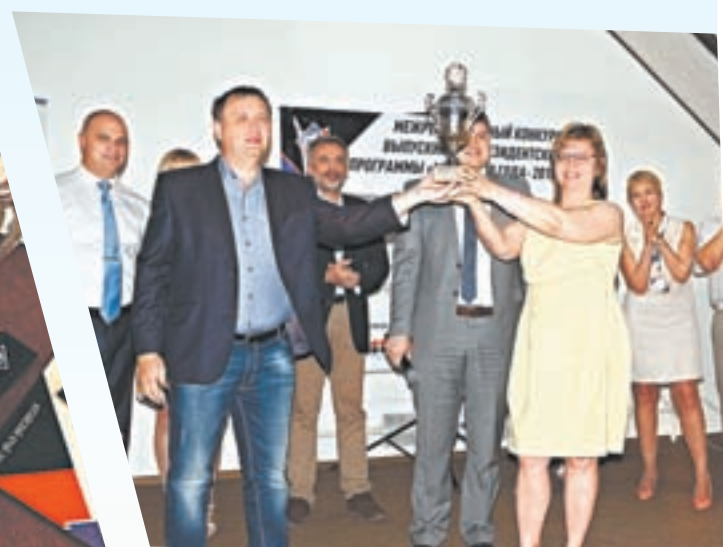
Переходящий кубок форума вручен новосибирской команде, победившей в номинации «Лучшая бизнес-идея» с проектом «Безотходное сельскохозяйственное производство».