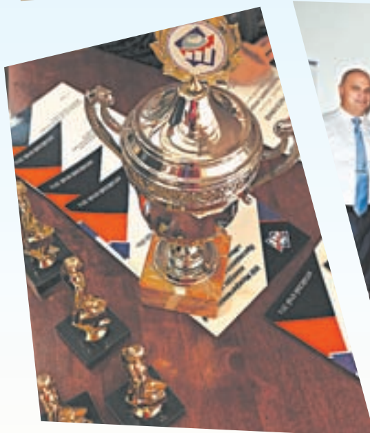
Награды – лучшим.