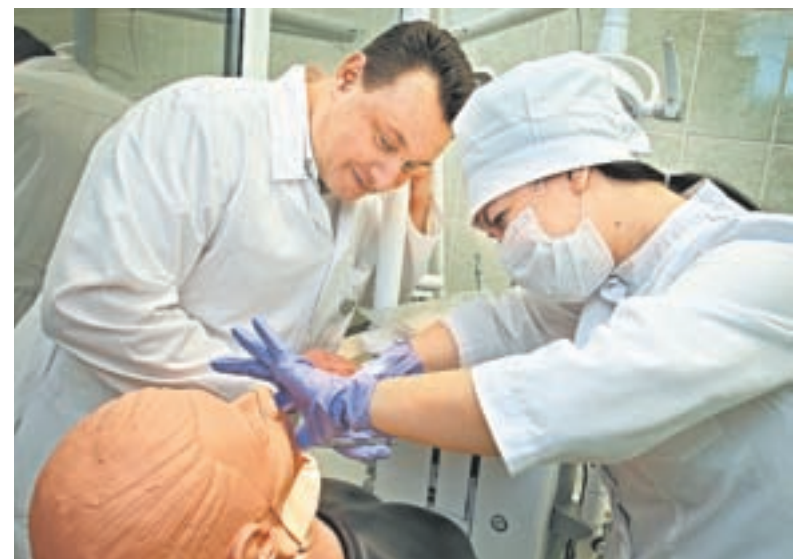
В центре действуют четыре стоматологические станции, а всего их 12.

Здесь всё как в жизни. Студенты при принятии родов даже разрежут пуповину. В соседнем кабинете смитирована ситуация, при которой человек падает без сознания прямо на улице.