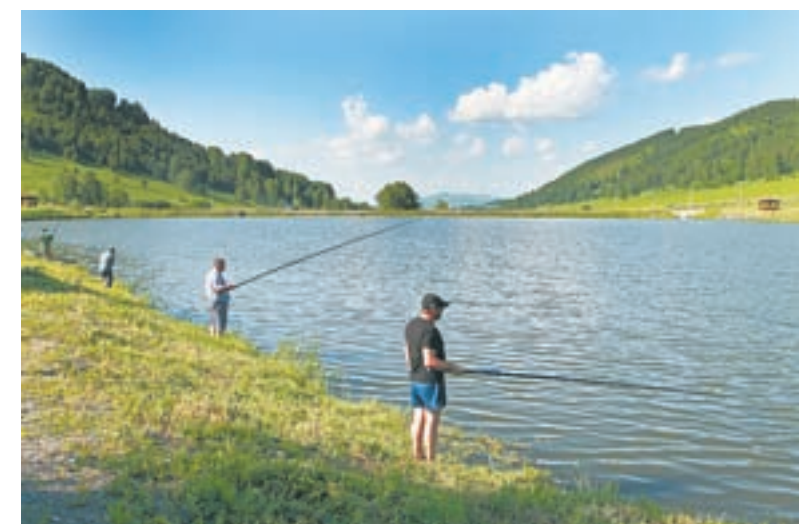
Рыбалка – новая услуга для туристов.

Сегодня «Бирюзовая Катунь» – единственная в России действующая особая экономическая зона