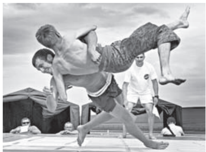
Так проходил турнир «Богатырь Алтайфест».

Татьяна КОЧЕТЫГОВА, Андрей НАСПРИШИН (фото)