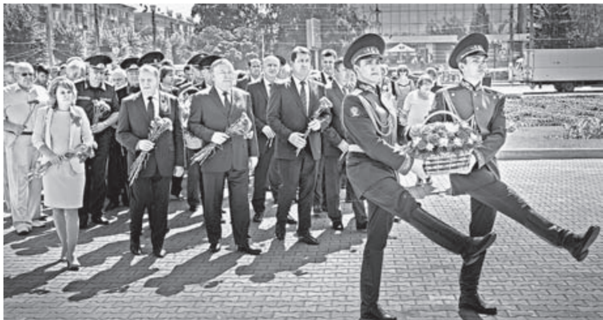
В церемонии возложения цветов принял участие губернатор Александр Карлин.