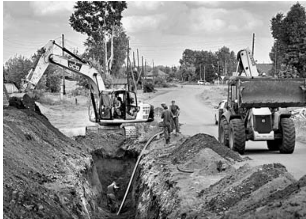
Протяженность нового водопровода составит без малого 10 километров.

В селе Платово Советского района завершается строительство водопровода, которая облегчит жизнь жителям и обеспечит их чистой питьевой водой.