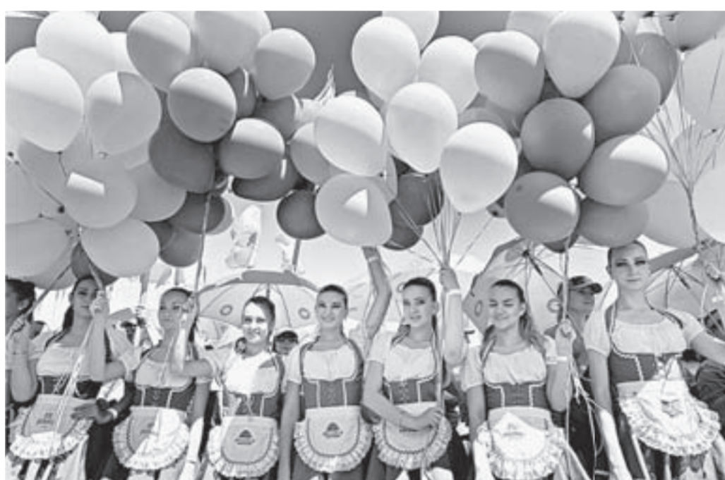
Да здравствуют добрые традиции!

В 2014 году в Алтайском крае было произведено 19 198 тыс. декалитров пива,