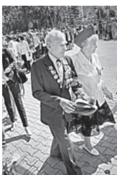
Ветераны пришли к мемориалу Славы, вспомнили погибших товарищей.

тических объединений, курсанты военно-патриотических клубов. Пришел возложить цветы и почтить память фронтовиков губернатор Александр Карлин. Он сказал: – 22 июня 1941 года – это дата одновременно трагическая и героическая для нашего народа. Буквально с первых часов нападения агрессора наши воины стали совершать исторические подвиги, проявляя чудеса индивидуального и массового героизма. Алтайский край поставил на фронты Великой Отечественной войны около 600 тысяч бойцов, они принимали участие во всех важнейших битвах. Без малого 250 тысяч земляков погибли, в тылу самоотверженно трудились пожилые люди, женщины, подростки. Они ковали Победу. Сегодняшняя дата отмечается в каждой семье и каждом коллективе.