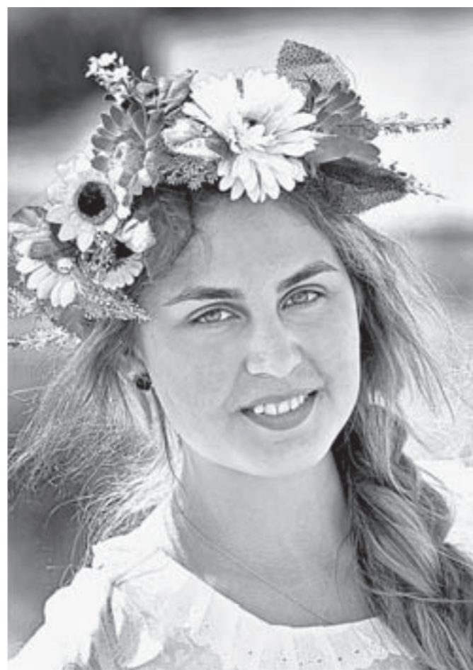
Лето, юность, красота...

18 июня к 11 часам утра туристско-развлекательный комплекс «Сибирское подворье», несмотря на тридцатиградусную жару, представлял собой голубеский Миргород. Все дорожки были заполнены туристами, которые дегустировали напитки и закуски, покупали всякую всячину, загорали, болели на скачках,