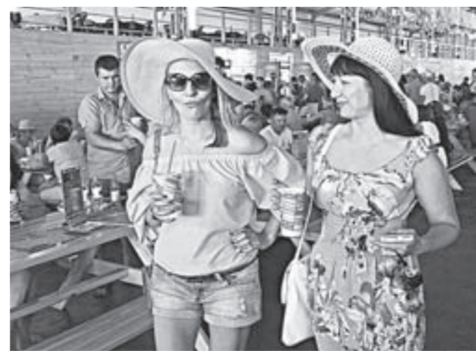
И жарко, и вкусно!