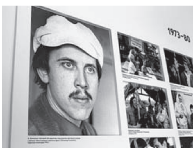
Валерий Золотухин: роли, окружение, ситуации.

– Внешний облик музея обусловлен его содержанием