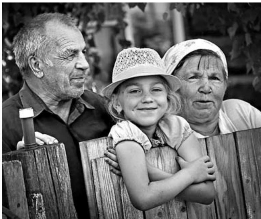
Жители с. Платово с интересом наблюдают за ходом строительства.

На сегодня в крае в рамках различных государственных программ ведется строительство 21 объекта водоснабжения. Общая сумма средств, предусмотренных на эти цели, составит 256,6 млн рублей. Основной объем финансирования приходится на краевой бюджет – почти 217 млн рублей.