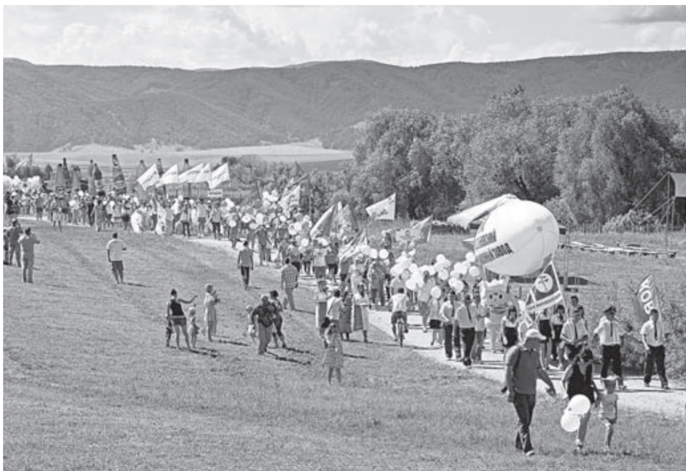
Одним из ярких событий фестиваля стал парад участников.

Тридцать пять тысяч туристов посетили межрегиональный фестиваль «Алтай-Фест», который проходил с 17 по 19 июня в Новотырышкино на «Сибирском подворье».