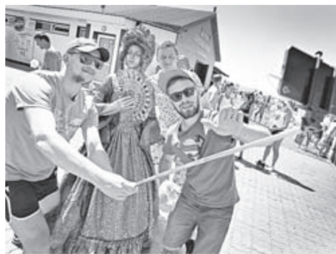
В этом году «Алтайфест» порадовал количеством нивья скульптур.