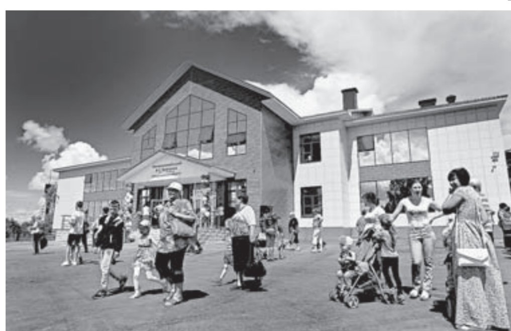
Культурно-досуговый центр находится в самом центре села.

Актер оставил после себя огромное культурное наследие. Он вел личные дневники, бережно хранил фотографии, письма, документы, автографы, рукописи, книги. Это позволило начать формировать в Государственном музее истории литературы, искусства и культуры Алтай личный фонд Валерия Золотухина еще при его жизни. На сегодня благодаря