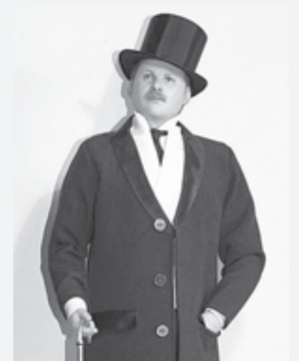
Выставка «Нукольные истории в советском кино» (Художественный музей).

Арт-галерея Шетинных, пр. Социалистический, 78, тел. 36-81-47.