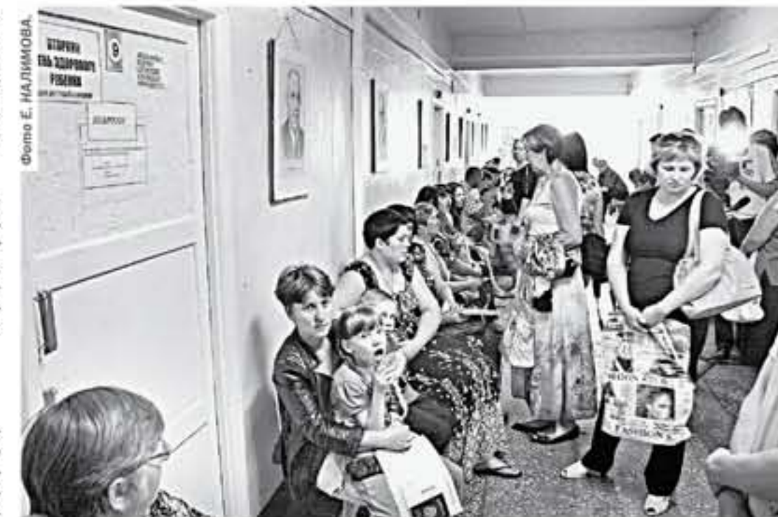
Очереди и специалисту – одна из причин обращения пациентов за помощью по защите прав.