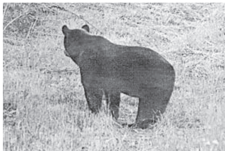
Косолапый: «Эти фотоловушки уже достали».

— На разрешённой охоте на копытных у нас также свой порядок. Ни одну лицензию не выдаём бесконтрольно, весь про-