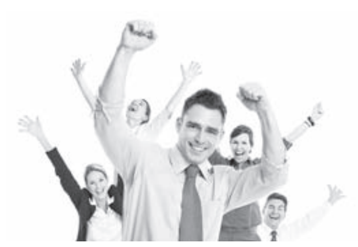
Налоговые каникулы призваны активизировать предпринимательскую активность.

– В первую очередь, и в этом были единодушны все участвующие в разработке