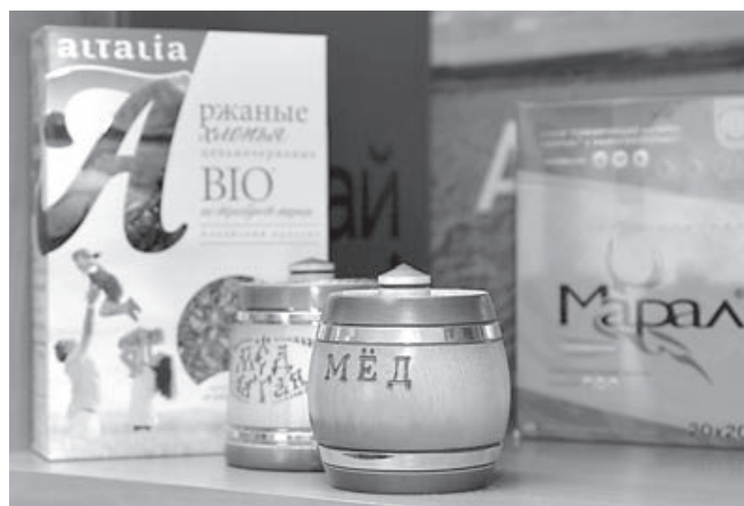
Бренды Алтай, известные всему миру.

«Бизнес-инкубатор, на базе которого мы работаем, стал одной из площадок форума. Центр поддержки экспорта – часть созданной здесь инфраструктуры, удобной и для действующих резидентов, и для новичков. Выпускники Президентской программы уже сложившиеся управленцы, принимающие весомые для Алтая решения. Но и после обучения они сотрудничают с бизнес-инкубатором, региональным ресурсным центром. «Уникальный Алтай» включает интересы экспортно ориентированного бизнеса, темы, особенно актуальной сейчас для России. Наша задача – показать предпринимателям, как выходить на внешние рынки, создавать высокую добавленную стоимость, рабочие места, новые производства, привлекать инвесторов. Чтобы продавать не пшеницу, гречку и другие дары полей, а готовый продукт. Предприниматель с Алтая войдет в другую страну, если учтет все аспекты – от государственной сертификации и наличия квот до политики. Пусть ни у кого не возникают ложные представления, мол, раз санкции, мы с Европой не торгуем. Напротив, хватает примеров предприятий, успешно развивающих экспорт как раз в это непростое время. «СисСорт», «Алтайская сказка», «Алтайская чайная компания», «Алтайский букет», «Малавит»,