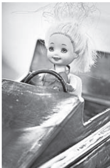
С блондинкой на борту.

Бюджет у городских и районных центров небольшой, и у родителей нет лишних средств, чтобы в полной мере обеспечить такой досуг ребенку. Но занятия, безусловно, не проходят для мальчишек даром и даже играют в жизни