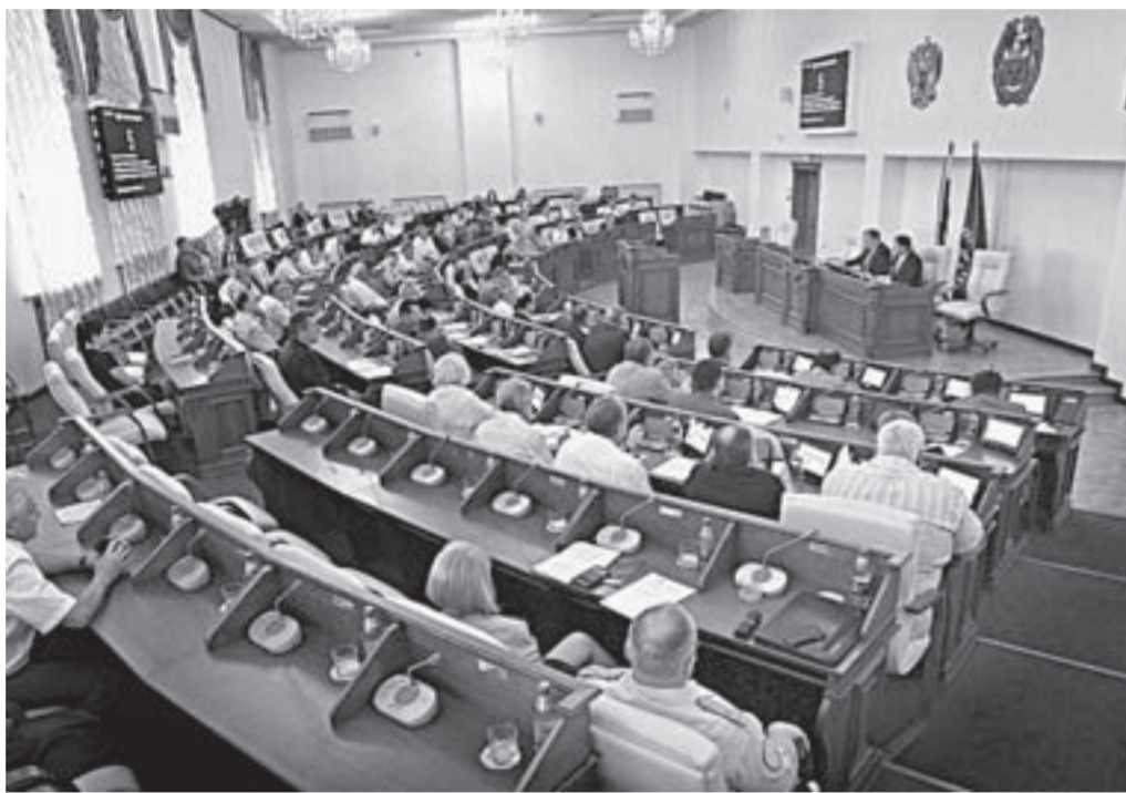
На внеочередной сессии депутаты в общей сложности рассмотрели девять вопросов.

ние о создании общественного совета в сфере закупок при Алтайском краевом Законодательном Собрании. Как известно, в парламенте ведется работа по осуществлению закупок товаров, услуг для обеспечения государственных нужд. Поэтому необходимо принять документы по нормированию указанной деятельности, которые должны пройти процедуры общественного обсуждения и рассмотрены общественным советом.