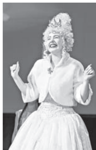
Белая королева понравилась зрителям.

– Наши ребята занимаются не только актерским мастерством, но и хореографией. Особенно пластичные старшие ребята и малыши. Мы немного переживали за среднюю группу, которая открывала первую сцену спектакля, но она справилась