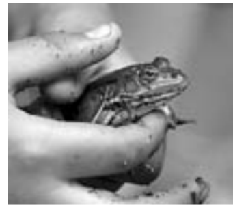
Представитель «замкнутой экосистемы».