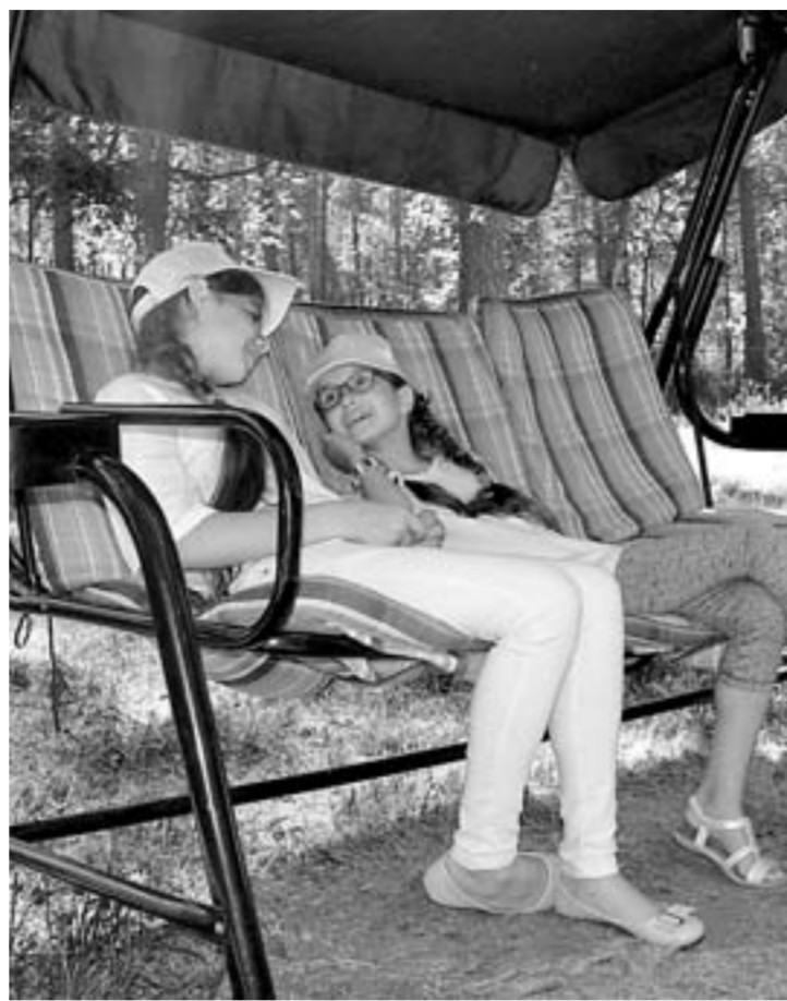
Про отдых на свежем воздухе в «Гренаде» не забывают!

На этой неделе в санатории «Гренада» завершилась профильная смена юных исследователей и робототехников. Десять дней под руководством преподавателей вузов и педагогов дообразования школьники 8 – 17 лет проводили физические опыты, печатали на 3D-принтере, изучали комаров и лягушек в естественной среде и боролись с энтропией.