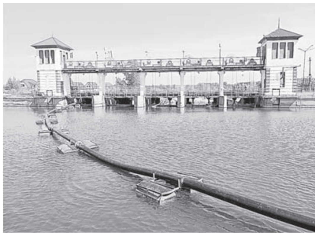
По этому пульпопроводу грязная жижа, собранная со дна озера, перекачивается в отстойник на осветление.

– Главное, чтобы не оставался земснаряд. Бюджетные средства выделены