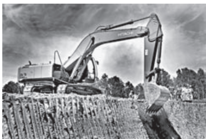
Относ под углом 45° способен сделать любой опытный экскаваторщик без приборов.

недавно грейдер и КамАЗ в ДСУ пригнали. На новой технике всегда работать приятнее.