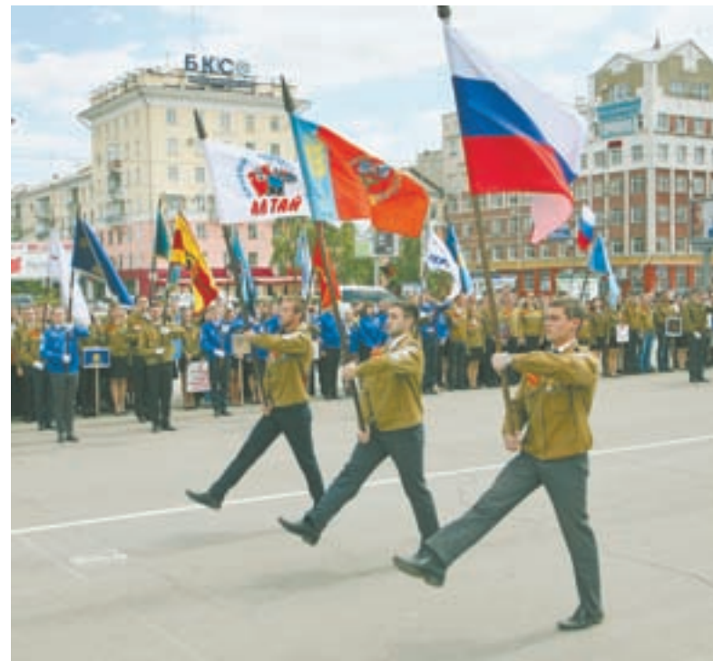
Во время торжественного открытия третьего трудового семестра.