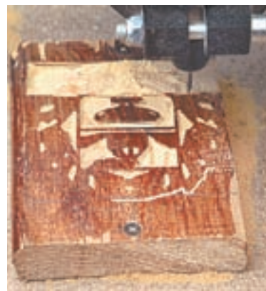
С помощью оборудования центра «Интеркот» прямо на празднике была изготовлена трехмерная модель герба Алтайского края.

эффективность и безопасность новых лекарственных средств.