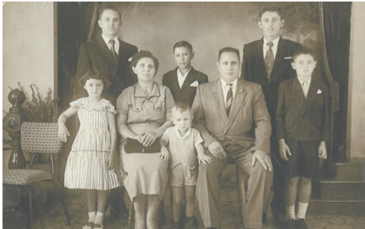
Бразильские Поповы. 50-е годы XX века.

Сюжеты программы «Жди меня» порой столь фантастичны, что волей-неволей усомнишься: а не придуманы ли герои и их истории? Когда в одном из недавних выпусков прозвучали название алтайского села Малышев Лог и известные там фамилии, мы решили отследить судьбу этих людей. В 1932 году они покинули Алтай и где пешком, где на телегах и кораблях добрались до Бразилии, преодолев 20 тысяч километров по пустыням, горам и океанам.