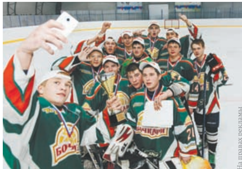
На ледовой арене «Бочкари» юношеская команда хоккеистов.