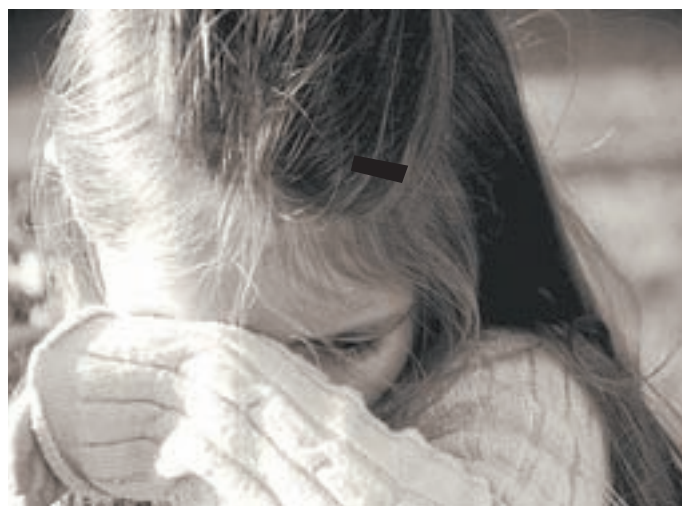
Ребёнок беззащитен перед жестокостью взрослых.