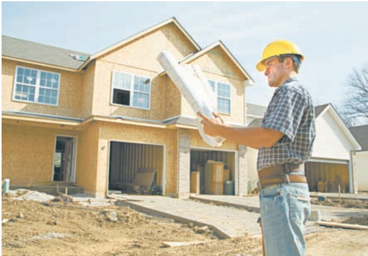
В прошлом году в Алтайском крае индивидуальными застройщиками введено в действие почти 300 тыс. кв. метров жилых домов.