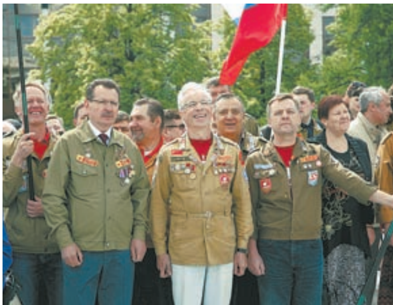
Ветераны «Старой гвардии» к сезону готовы.