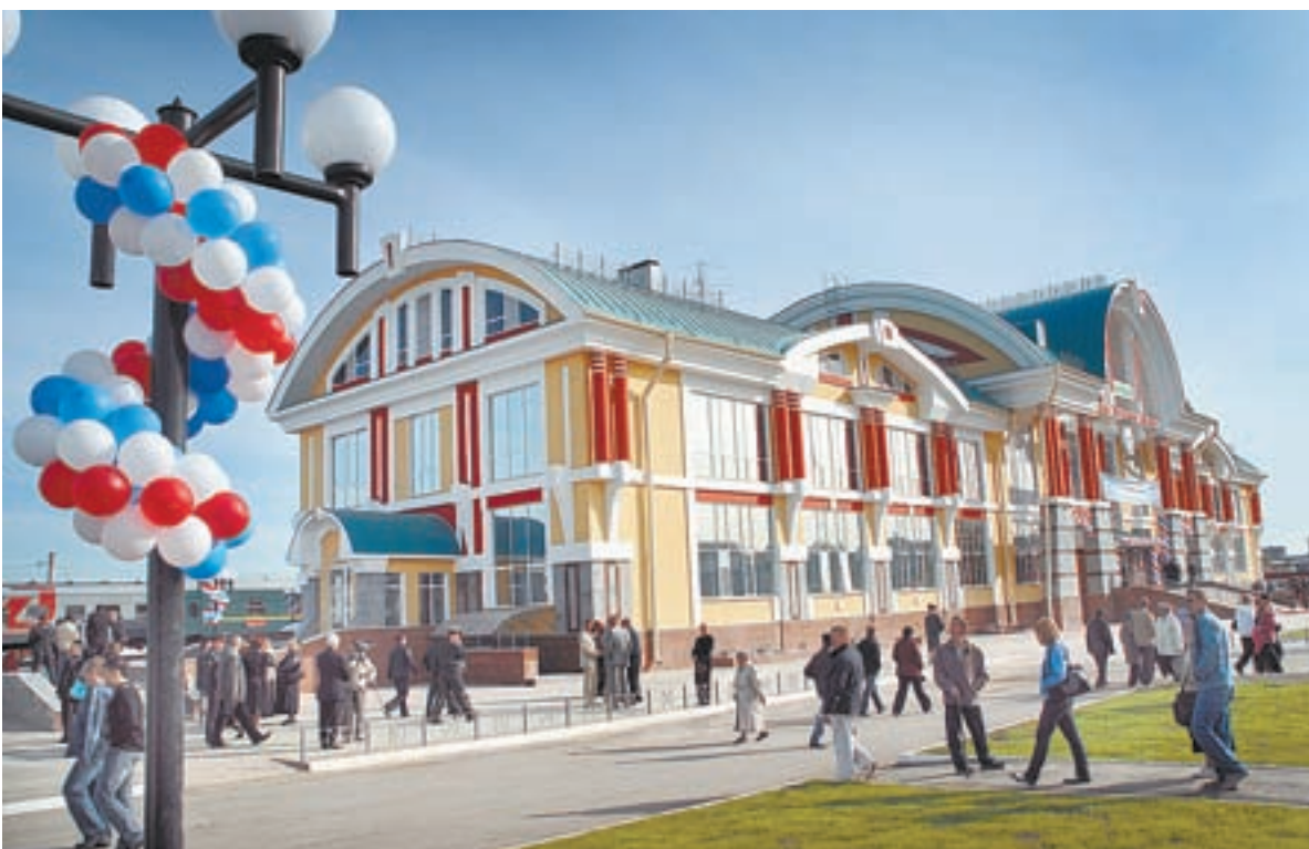
Благодаря поддержке краевой администрации Бийск активно развивается. Новое здание вокзала.