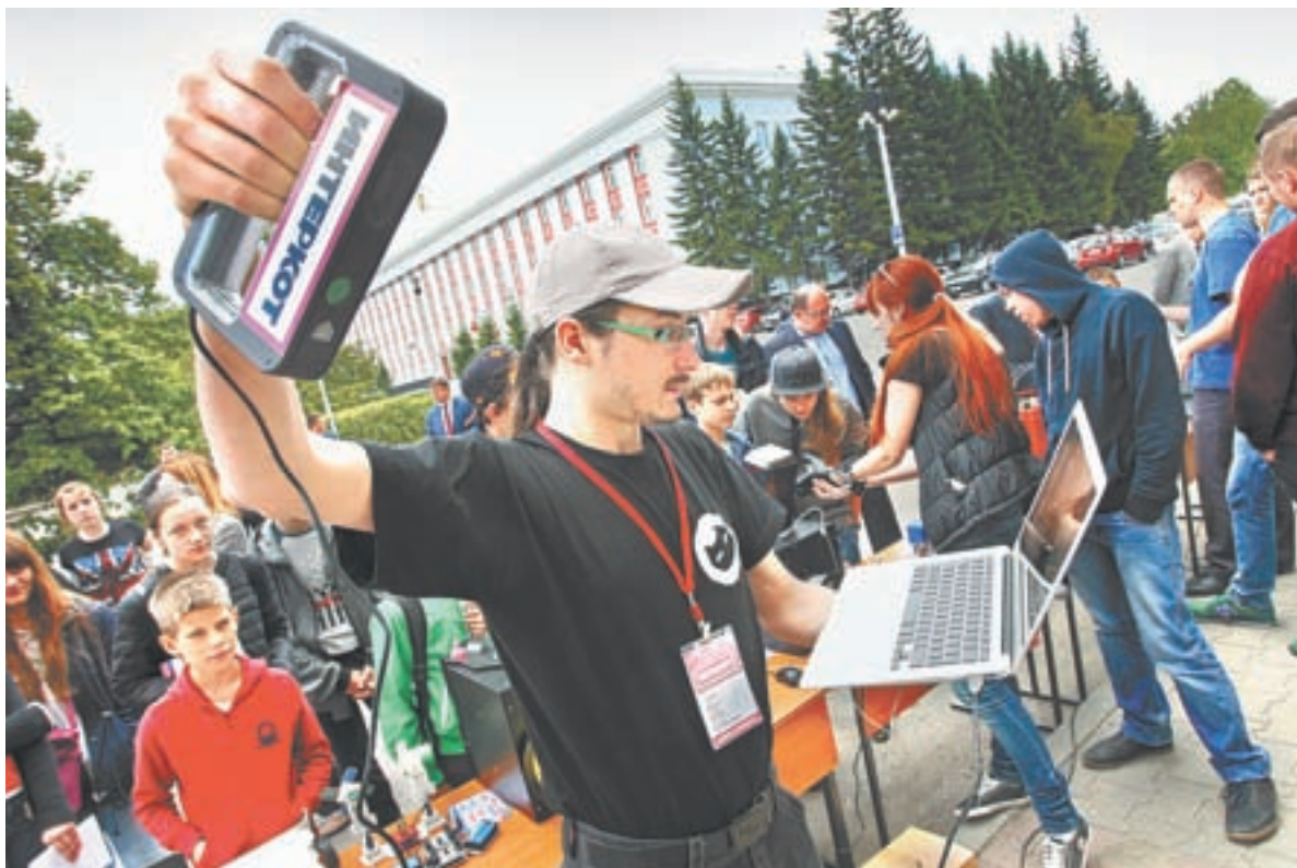
Было интересно и детям, и взрослым.

В среду, 1 июня, в центре Барнаула на площади перед корпусом «Л» АлтГУ боролись роботы-сумоисты. Один наехал на другого (в прямом смысле слова) и едва не растоптал. Со стороны за схваткой пританцовывая наблюдал миролюбивый робот-андроид. И еще сотни любознательных барнаульцев, которые решили поучаствовать в торжественном открытии сети центров молодежного инновационного творчества (ЦМИТ) Алтайского края.