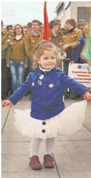
Подрастают новые бойцы.

ством его инфраструктуры, плюс штукатурные, малярные, бетонные, земляные работы. Кстати, для «Монолита» это уже не первая Всероссийская стройка. В 2013 году отряд выезжал на ВСС «По-