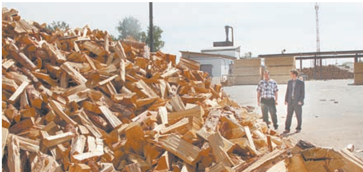
Гора дров в «Новичиха лес» за лето исчезнет.

– За что задержали? Через год сухая береза трухой станет. Получается, пусть лучше сгниет, чем мужик возьмет. Какой грех, если он поехал и забрал никому не нужные сучки? Лес от этого только чище станет, меньше будет вторичных вредителей. Оштрафовали одного – остальные, хоть и с опаской, но продолжают запасать сухостой. Потому что попадает, я думаю, один из тысячи. Получается, сами себя обманываем? С одной стороны, лесхоз, который занимается своим делом, дрова продает. С другой – тысячи кубов пропадающего сухостоя и безработные, которые могли бы им заняться. Почему не отдать его нуждающимся? Мое мнение – надо тему доработать, ведь она