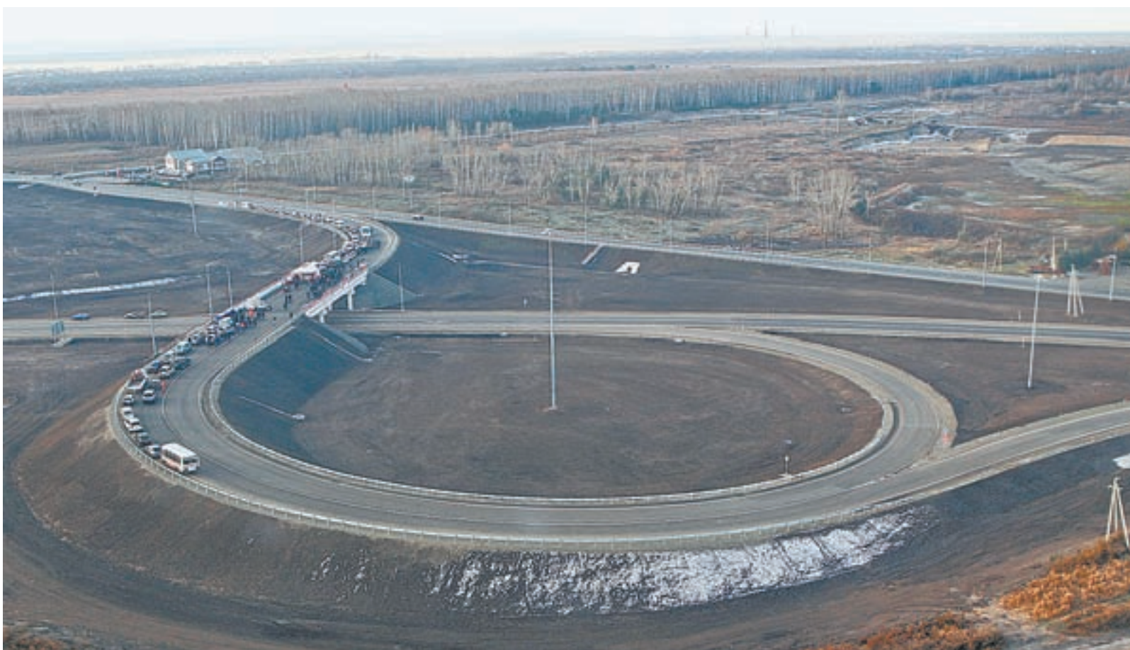
Объездная дорога в Бийске разгрузила транспортные артерии города.