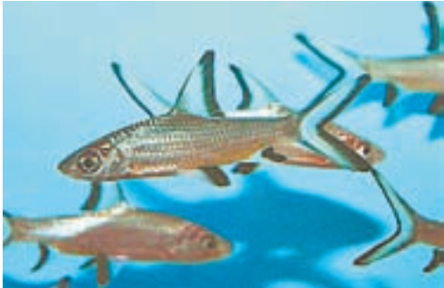
Акулы, но маленькие.

Барнаульцы покупают домой акул. И это не шутка. Дело в том, что в барнаульских зоомагазинах начали продавать аквариумных акул. Они – миролюбивые маленькие копии настоящих океанских хищников.