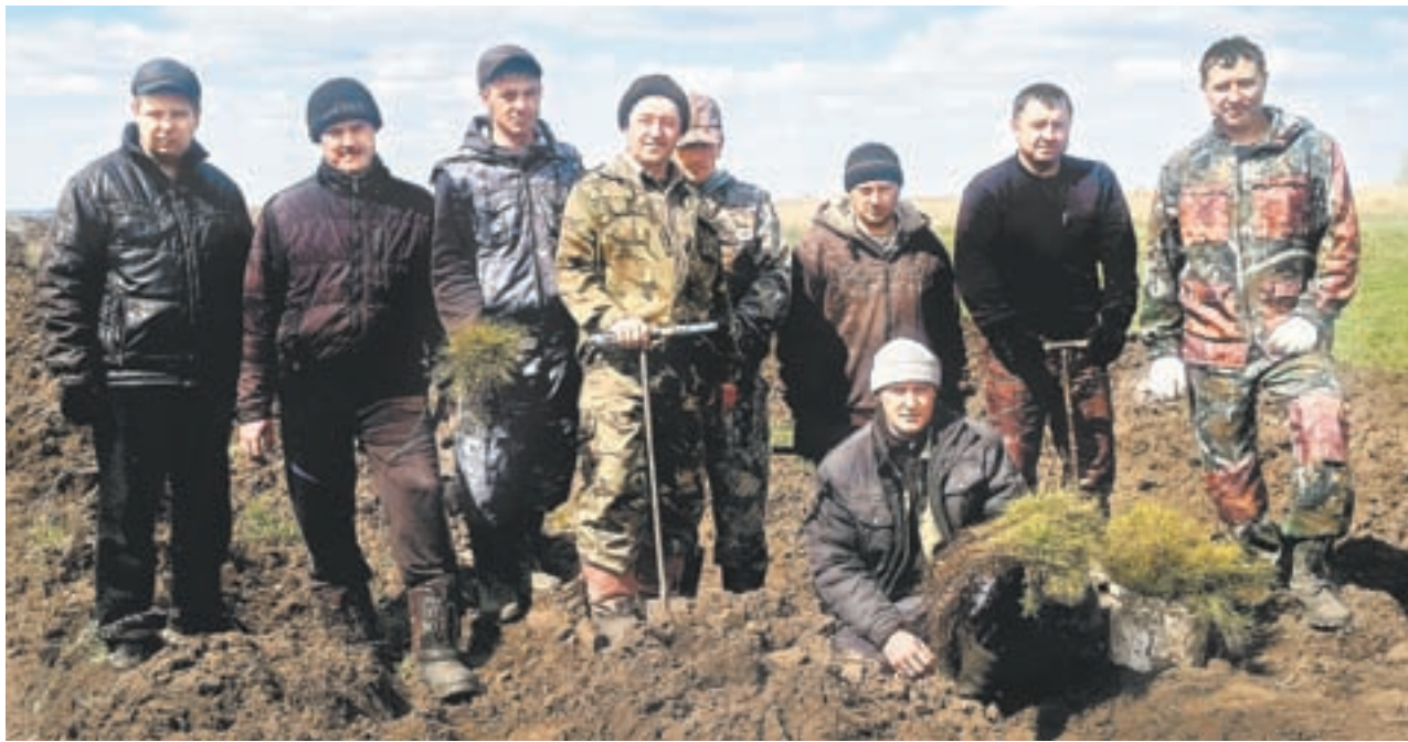
Их лесополоса защитит посевы, украсит землю и даст приют зверью и птицам.