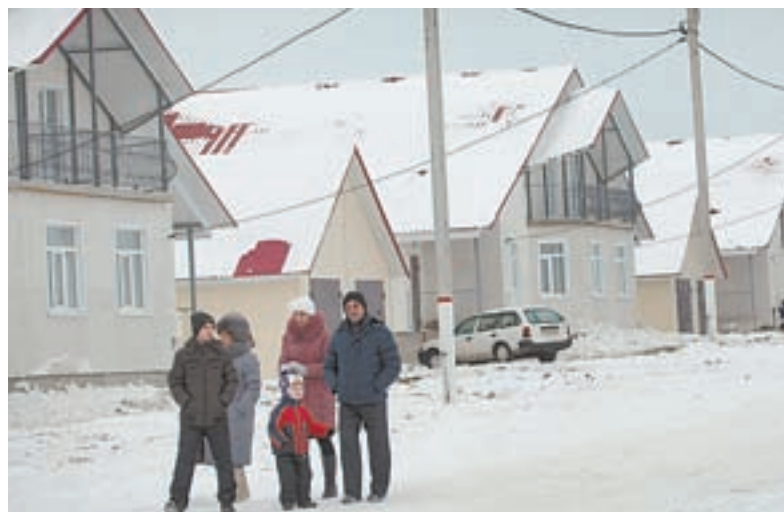
Новая улица благоустроенных домов для заводчан и бюджетников в селе Бочкари.

По словам организаторов и экспертного совета, вручению премии «КоммерсантЪ года» предшествовал продолжительный и достаточно сложный период: издательский дом вначале определил 12 номинаций, в которых будут вручать премию в этом году, затем наступила очередь формирования списка номинантов. Их оказалось около 70 человек. «Важно отметить, что достаточно много представителей бизнеса претендовали на премию в нескольких номинациях, поскольку журналисты отмечали их заслуги в разных областях. Затем сибирская редакция совместно с экспертным советом, в который вошли руководители предпринимательских объединений региона и администрации Алтайского края, определяла лучших из лучших. Так сформировали список из 12 лауреатов. Форми-