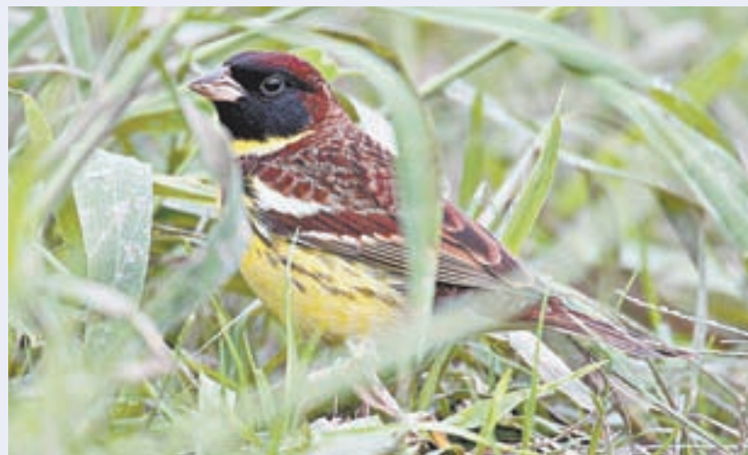
Не улетай от нас, птичка.

Вид с резко сократившейся численностью. Внесен в Красный список МСОП (под угрозой исчезновения), в Приложение II Бернской конвенции по охране дикой природы и естественных сред обитания, в двусторонние соглашения России с рядом стран об охране перелетных птиц и среды их обитания, имеет природоохранный статус в Европе.