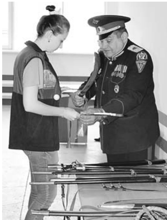
Мастер-класс от казачков Алтайского войскового казачьего округа.