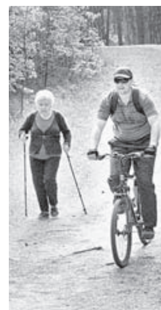
«Сынок, я тебя догоню!»

P.S. Такой массовый День ходьбы можно по праву считать зарождением на Алтае новой здоровой традиции летних спортивных прогулок. Хочется верить, что они станут такими же популярными, как лыжные. А значит, жители нашего края станут здоровее, сильнее и красивее! Давайте не будем сидеть на диване, а отправимся в лес за здоровьем!