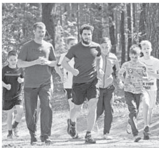
В этот день в лесу было много народу.

На трассу вышли и представители многих спортивных школ Барнаула: хоккеисты, футболисты, волейболисты. Лес – прекрасное место для релаксации, здесь можно набраться сил. А тренировки на открытом воздухе более эффективные. В этот день на спортивную прогулку со скандинавскими