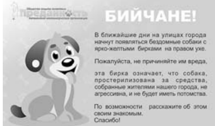
Такие памятки горонане видят на улицах.

Пес с рыжими подпалинами на боках и желтым ухом чинно подошел к людям, дождавшимся зеленый свет на пешеходном переходе, и вместе с двуногом двинул через дорогу, едва загорелся нужный сигнал. Желтая метка в ухе – знак опеки волонтерами общества защиты животных «Преданность», маркер того, что лохматый привит, стерилизован, дружелюбен к людям. Необычный опыт наукограда в решении проблемы бродячих животных пока единственный в регионе.