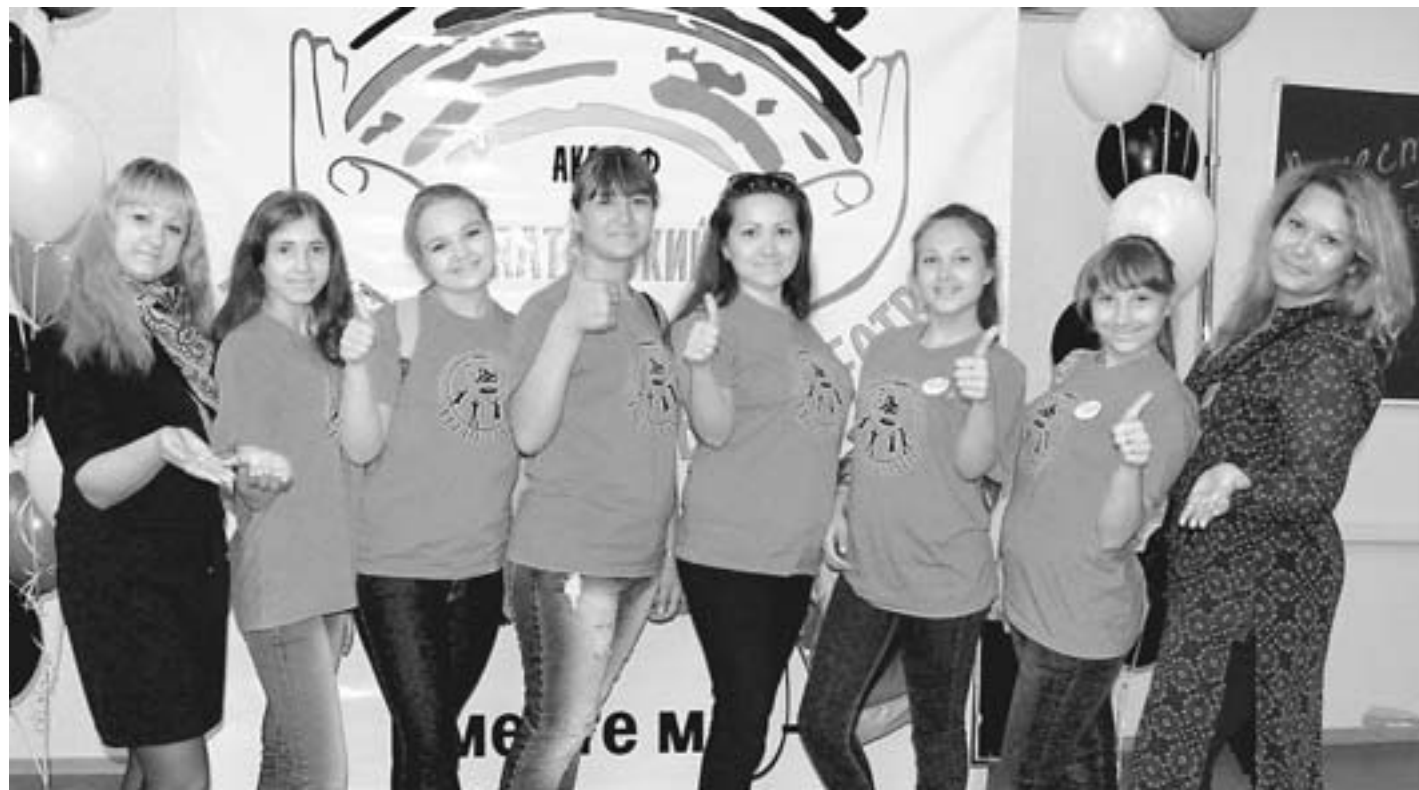
На фестиваль приехали представители волонтерского отряда из Павловска «Ты не один».

В рамках фестиваля активно плодотворно работали на нескольких площадках, говорили о значимости волонтерской деятельности в сфере патриотического воспитания, охраны окружающей среды, здорового образа жизни и спорта. Кроме того, в одной из аудиторий прошла презентация социально значимых проектов, которые