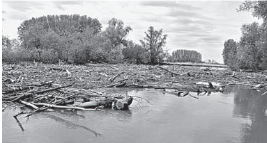
Затор, который перекрыл протоку, теперь ликвидирован.