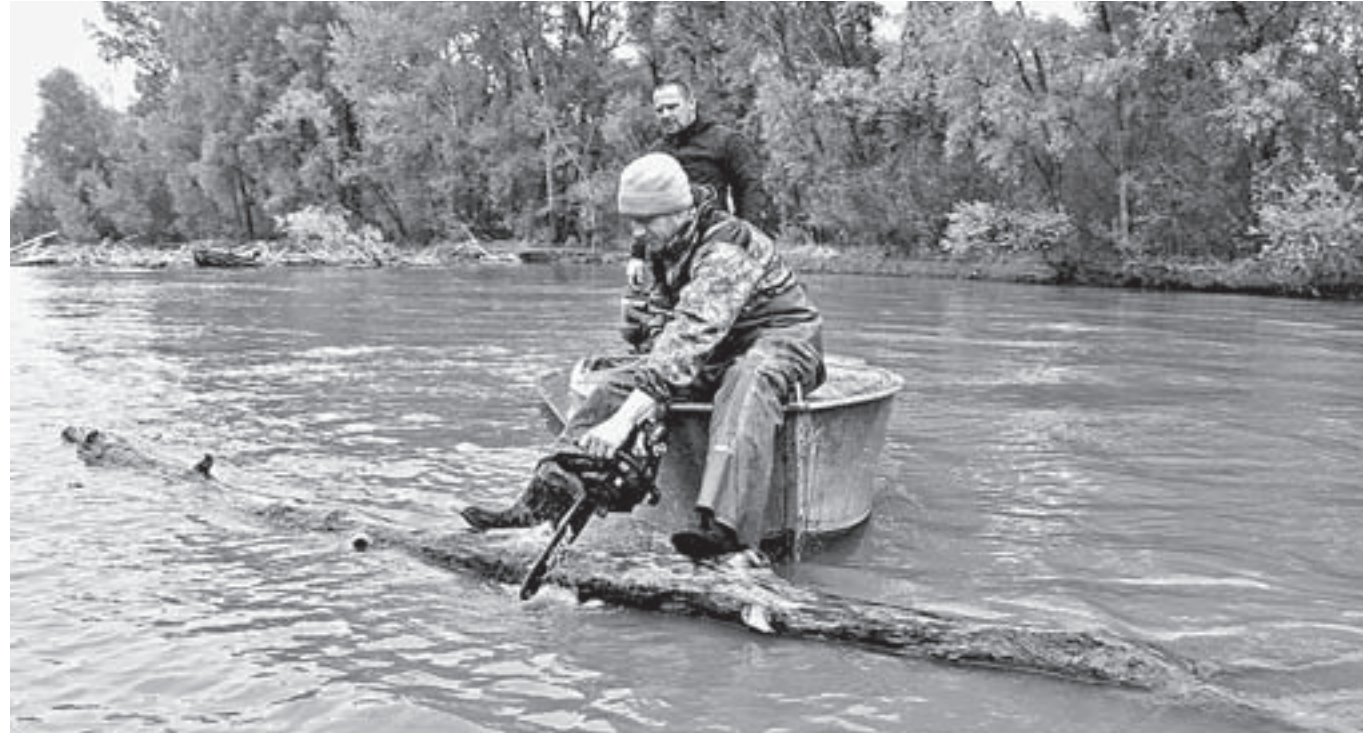
Сотрудники рыбнадзора вручную распиливали бревна.

некоторая его деятельность, отрицательно сказывается на состоянии водной среды.