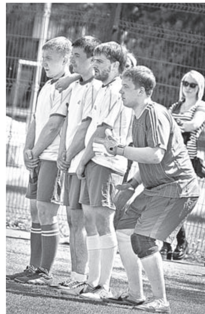
Найти брешь в такой «стене» – задача не из легких.