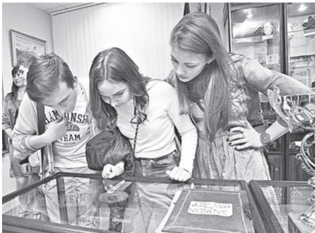
История вуза – это тоже увлекательно!