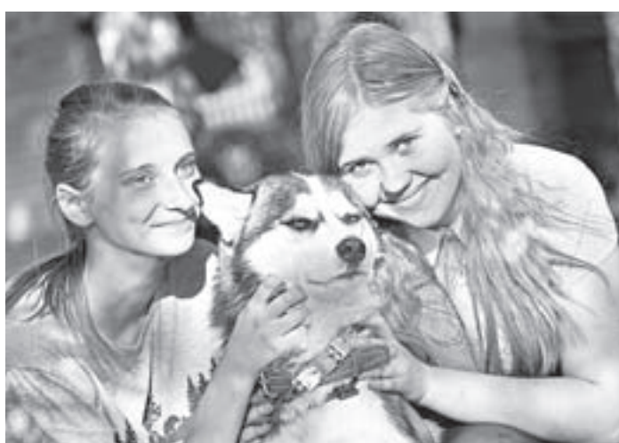
Культурно отдыхать – с лучшими друзьями!