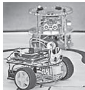
Извилистый путь маленьких роботов...

– Я тут вижу девушку в танце: вот голова, а это юбка,