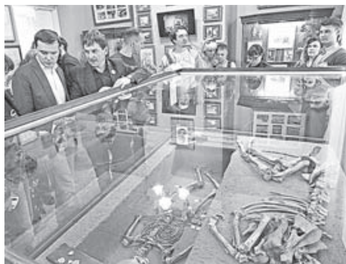
В ГМИЛИКА представили реконструкцию погребального комплекса скифского воина с конем.

В минувшую субботу культурные учреждения края в одиннадцатый раз приняли участие в международной акции «Ночь музеев». Число площадок возросло до рекордных 86, и около 34 тысяч человек предпочли в этот вечер культурный досуг всем другим его видам. В Барнауле свои двери в неурочный час открыли 35 краевых, городских, ведомственных, школьных и частных музеев и галерей.