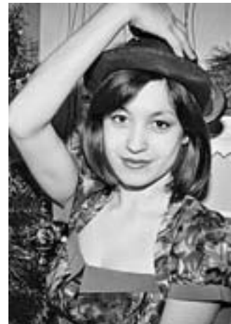
Фотограф Диана Круглова превратила свое хобби в источник дохода.

А чтобы малыши получились удачно, в ход идет все подряд – конфеты, печенюшки, мягкие игрушки... И два котика, которые живут у Дианы в доме, – животные часто сами усаживаются около клиентов. Для нее важен близкий контакт с людьми, которых она фотографирует. Иначе не будет искренности. Поэтому все, кто приходит к Диане на