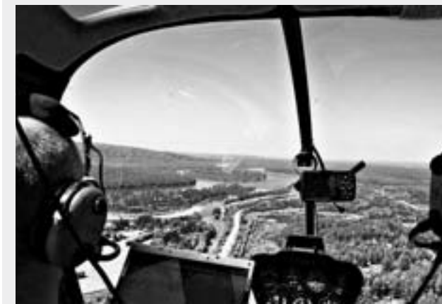
Сверху всё видно.

Основная задача сегодня – охрана лесов от пожаров.