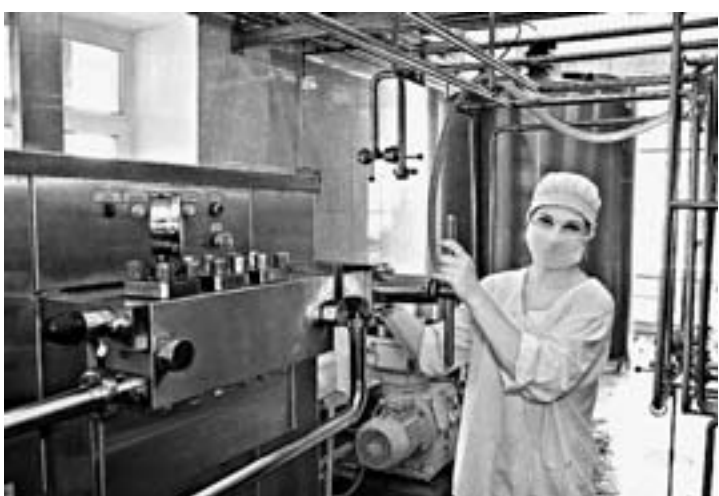
Молочные реки Донбасса.

Этой весной, в день 2-й годовщины провозглашения ДНР, со станции Ясиноватая торжественно отправился в первый рейс пассажирский международный поезд, напрямую связавший республику с Россией: Ясиноватая – Квасино – Успенская. Об этом – репортаж Василия Каранту-парад «И на Успенскую состав отправился». «Несмотря на все экономические, политические преграды, несмотря на транспортную блокаду, мы живём и делаем нашу жизнь лучше. С каждым подобным событием мы приближаемся к тем целям, которые заставили нас два года назад подняться и сражаться