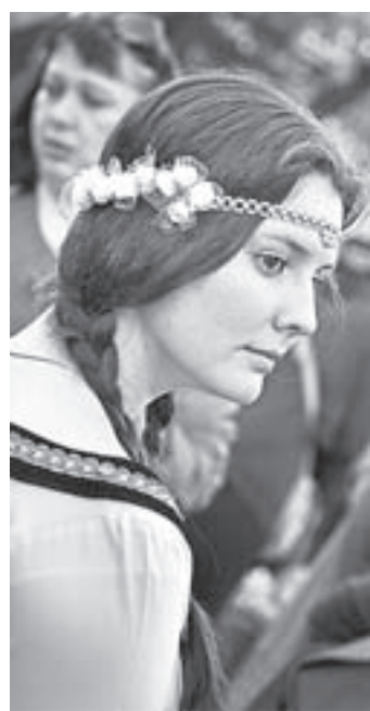
Музеи приглашают в прошлое.

В минувшую субботу культурные учреждения края в одиннадцатый раз приняли участие в международной акции «Ночь музеев». Число площадок возросло до рекордных 86, и около 34 тысяч человек предпочли в этот вечер культурный досуг всем другим его видам. В Барнауле свои двери в неурочный час открыли 35 краевых, городских, ведомственных, школьных и частных музеев и галерей.