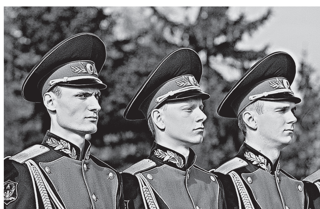
Последние почести от роты караула БЮИ.

Долгие годы я думала, что в рассказе бабы Ани много вымысла. Слишком страшен он, чтобы быть правдой. Но