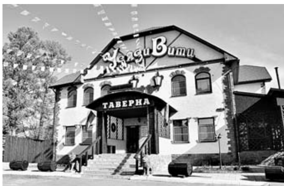
Пример удачной организации бизнеса.

Как отмечают в администрации края, Тальменский район является северными воротами региона, поэтому качество сервиса там обязано соответствовать самым