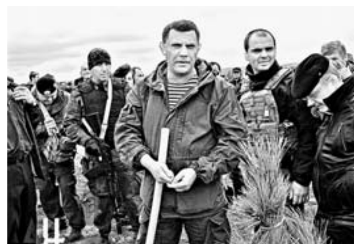
Субботник на мемориальном комплексе.