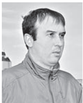
Представитель Регоператора осуществляет контроль капремонта.

– Этому дому 48 лет, сначала было все нормально, но в последние годы крыша стала протекать. Мы собрали документы, подали их в администрацию, и наш дом включили в краевую программу по капремонту. Когда пришли подрядчики, вдруг халтурить начнут, но они справились с работой хорошо. Когда демонтаж сделали, во время дождя ночью приезжали пленкой крышу