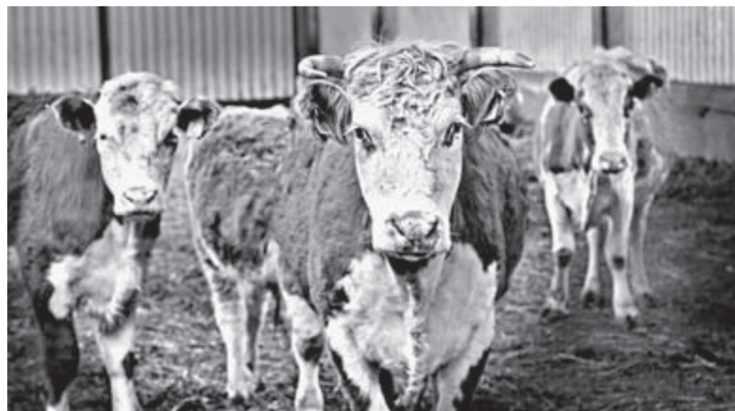
Фермер из Бурлы разводит герефордов.