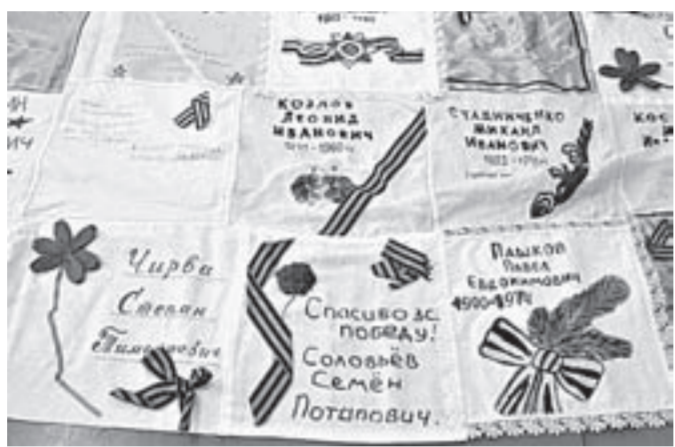
Более 500 человек приняли участие в акции «Солдатский платок».

Мы объявили акцию «Солдатский платок» в прошлом году за месяц до 9 Мая. Не ожидали, что будет так много желающих в ней участвовать, более 500 человек принесли нам заветные платки с фотографиями, вышитыми именами родственников, участвовавших в войне. В результате мы сшили два полотна по 7,5 метра и дали нести 9 Мая школьникам и ребятам из военно-патриотического клуба «Барс» Ключевского профессионального лицея. Колонны