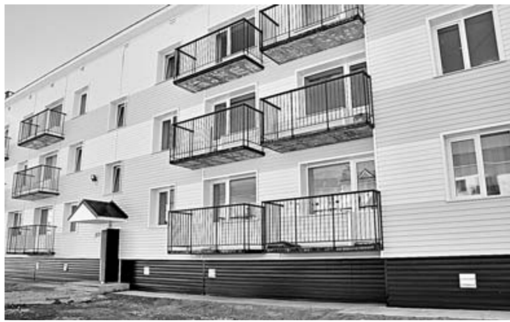
Новый дом для рубцовчан.

Еще один довольный новосел — Раиса Радзивилова. До