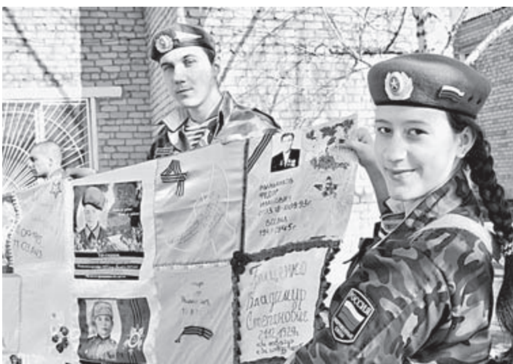
Полотно из солдатских платков длиной 15 метров хранится в Ключевском районном музее.