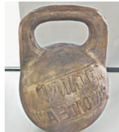
Эта гири сверху покрыта золотистой мукой.

– Ой какая! Это на нее сколько плиток шоколада ушло! Наверное, целый КамАЗ.