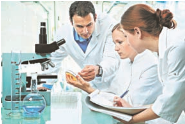
В Израиле много внимания уделяют развитию науки.

На сегодня Израиль контролирует 50% мирового рынка капельного орошения. Конечно, теперь подачу воды к каждому растению регулирует компьютер. Такая система позволяет получить значительную экономию воды и удобрений, дает более ранний урожай, предотвращает эрозию почвы, уменьшает распространение болезней и сорняков. Коэффициент полезного использования воды при капельном орошении составляет около 95%, а при поверхностном – только 45%.