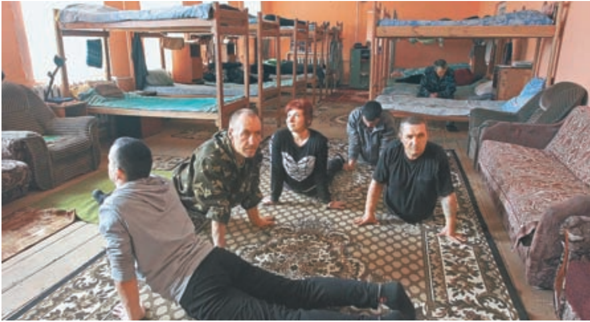
И гимнастика, и релаксация.