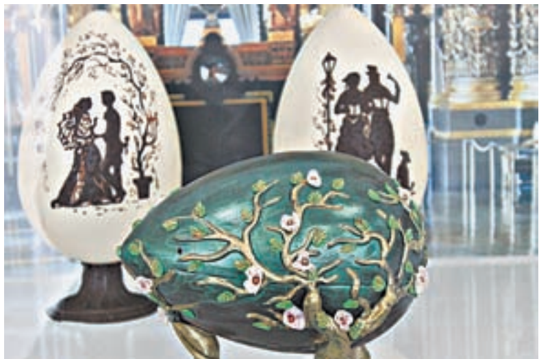
Копии яиц Фаберже.