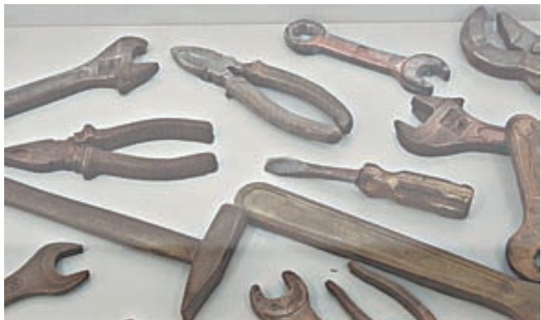
Вот такие сладкие инструменты!