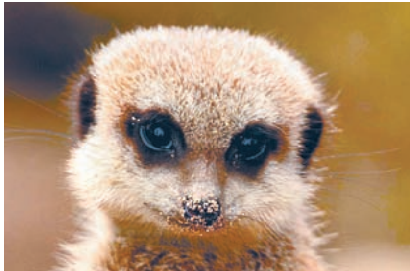
Это – сурикат.

Содержание маленького шимпанзе в домашних условиях может оказаться весьма хлопотным занятием. В отличие от собаки, которая единожды и безоговорочно признает в вас хозяина, обезьяне постоянно придется напоминать, кто глав-