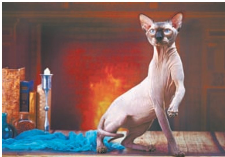
Иннокентий – гордость семьи и ласковый домашний любимец.

– Кеша обожает финики. Очень любит играть с маленькими ребя-