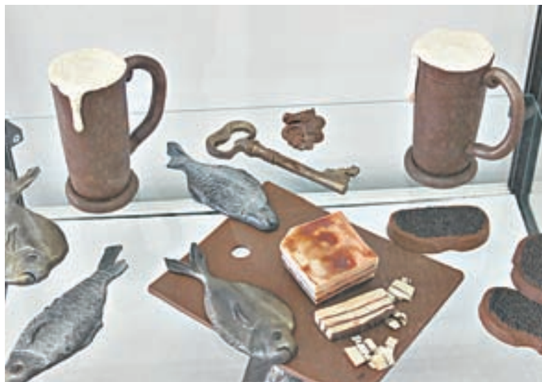
«Пиво» и «закуски» к нему.