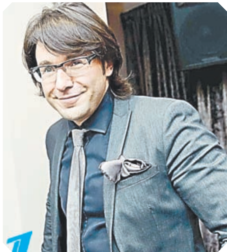
19.50 Пусть говорят (16+)

12.00 Сериал «Станица» (16+) 12.45, 13.45, 15.45, 17.45, 20.15 Спортивный клуб (12+) 13.00, 15.00, 15.30, 17.00, 18.00, 20.30, 22.00, 22.30, 23.00, 23.30, 00.00, 00.30, 01.00, 01.30, 02.00, 02.30, 03.00, 03.30, 04.00, 04.30, 05.00, 05.30 13.15, 15.15, 16.45, 17.15, 18.15, 18.45, 21.45, 22.50, 23.20, 23.50, 00.20, 01.20, 01.50, 02.20, 03.20, 03.50, 04.20, 05.20, 05.50 13.30, 17.30 Большой Барнаул (12+) 14.00 Док. сериал «Тайны советского кино» (16+) 14.30 Док. сериал «Гении и злодеи» (16+) 16.00 Сериал «Станица» (16+) 18.30, 20.00 Новости с субтитрами (12+) 19.00 Ваш вопрос 20.50, 22.20, 00.50, 02.50, 04.50 Былое (12+) 21.00 Сериал «Тульский – Токарев» (16+)