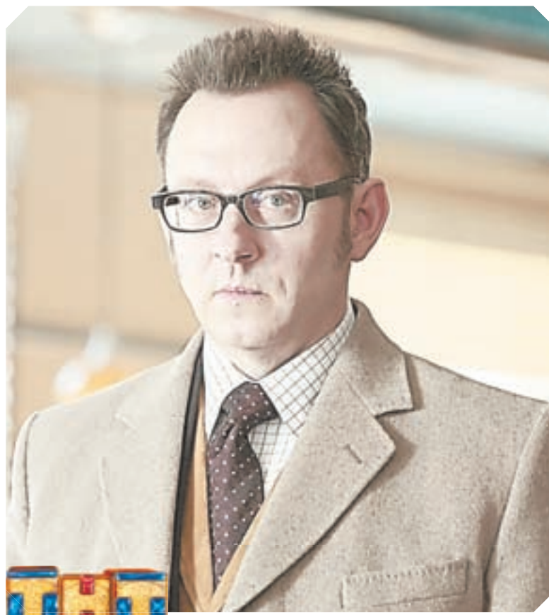
05.30 СЕРИАЛ «В ПОЛЕ ЗРЕНИЯ-2» (16+)

06.30 Джейми: обед за 15 минут (16+) 07.00 Поздравь своих домашних (0+) 07.25, 18.25, 00.25 Гороскоп «Будь готов!» (0+) 07.28 Погода в Барнауле (0+) 07.30 6 кадров (16+) 07.55 Х.ф. «Варвара-краса, длинная коса» (6+) 09.35 Х.ф. «Любовь Надежды, 1-4-я серии» (16+) 13.25 Сериал «Великолепный век» (16+) 18.00 Спасатель Алтай (16+) 18.28 Погода в Барнауле (0+) 18.30 Вуз-ТВ (16+) 19.00 Сериал «Великолепный век» (16+)