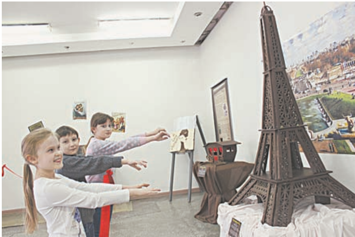
Дети тянутся к шоколадной Эйфелевой башне.