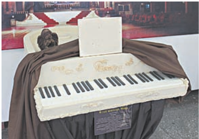
Рояль «играет» на аппетите посетителей.

Выставочный зал музея «Город» находится в центре Барнаула, на проспекте Ленина, в помещении, где раньше располагался Выставочный зал Союза художников России.