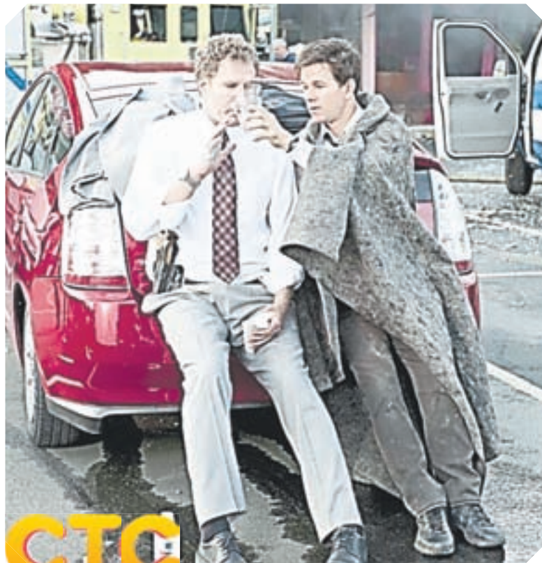
СТС 23.05 Х.ф. «Копы в глубоком запасе» (16+)

07.00 Наши новости. Спецрепортажи за неделю (16+) 07.25, 18.55, 00.25 Гороскоп «Будь готов!» (0+) 07.28 Погода в Барнауле (0+) 07.30 Х.ф. «Материнская клятва» (16+) 10.15 Х.ф. «Буду верной женой» (16+) 14.00 Х.ф. «Любовь Надежды», 1-4-я серии (16+) 18.00 Наши новости. Лучшие программы за неделю (16+) 18.58 Погода в Барнауле (0+) 19.00 Сериал «Великолепный век» (16+) 23.20 Док. сериал «Героини нашего времени» (16+) 00.00 Поздравь своих домашних (0+) 00.28 Погода в Барнауле (0+) 00.30 Х.ф. «Не торопи любовь» (16+) 02.35 Нет запретных тем (16+) 05.30 Джейми: обед за 15 минут (16+)