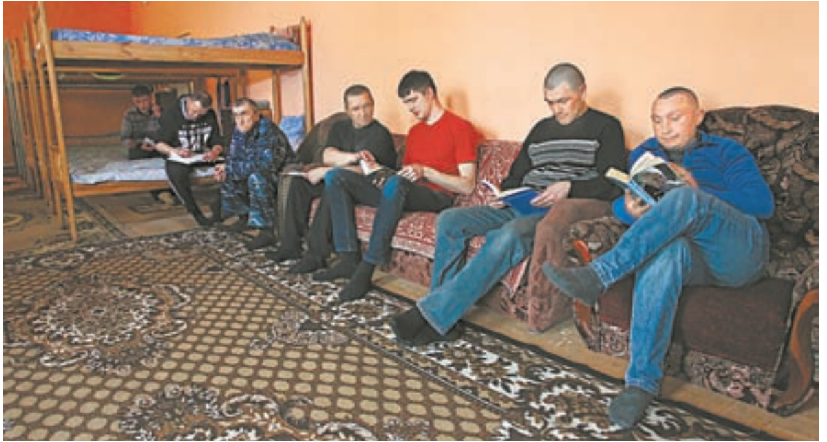
Клиенты центра читают специальную литературу.

Днем и ночью двери в центре закрывают изнутри на навесной замок. На всякий случай. Ключи хранятся у дежурного. Постояльцы как будто оправдываются: «Мало ли что у нас может случиться – местные зайдут или свои свежим воздухом подышать нас всем выйдут, хотя самоволок еще не было». Десятки километров до райцентра пешком по лесу – до-