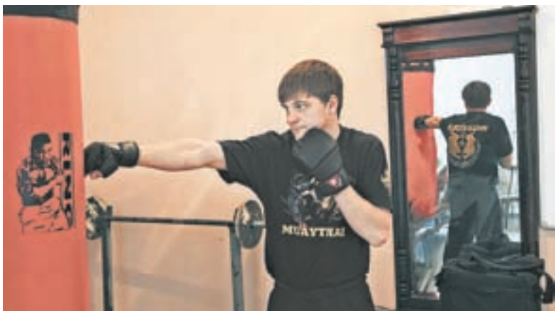
Тренажёрный уголок помогает расслабиться.