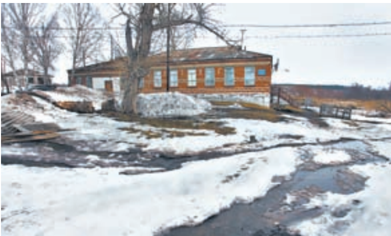
Реабилитационный центр арендует здание бывшего детского сада.

Центр «Независимость» с наркозависимостью борется вот уже три года. За это время через него прошли сотни наркоманов и алкоголиков из разных уголков страны. Администрация Косихинского района сдала в аренду фонду заброшенное здание бывшего детского сада. После косметического ремонта оно превратилось во