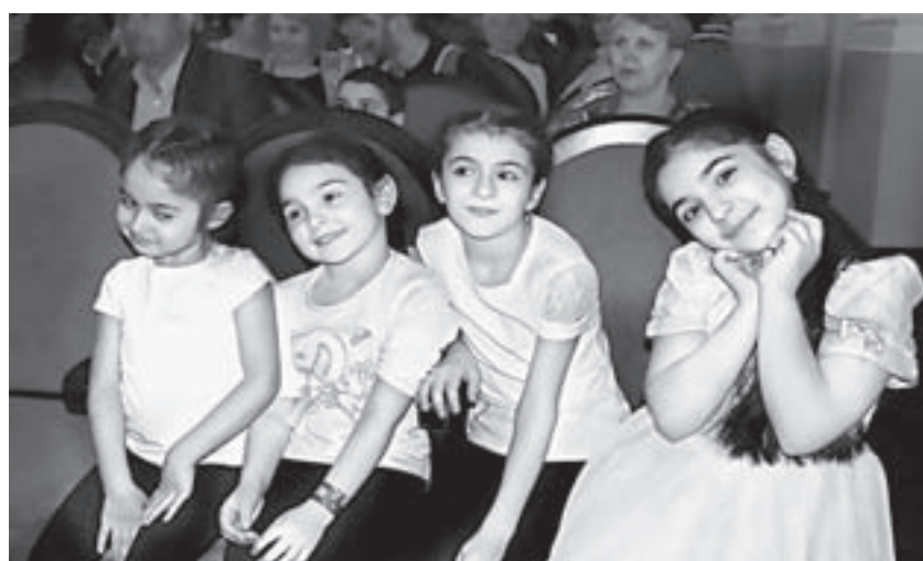
На концерт пришло много детей.

и вокальный «Эребуни». В каждом по три группы, занятия проходят почти каждый день. А вообще наша организация за год проводит более 30 крупных мероприятий, мы активно участвуем в городских и краевых конкурсах», – рассказывают представители армянской диаспоры.