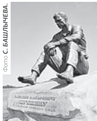
Памятник Шукшину в Сротках.

Заместитель губернатора напомнил о прошлогоднем визите на Алтай министра культуры РФ Владимира Мединского. «Он побывал на Шукшинских мероприятиях, которые его впечатлили. И как результат в этом году мы имеем поддержку федерального центра», – сказал Д. Бессарабов. – Увеличено финансирование из федерального бюджета: выделено более 2 млн рублей, на творческие акции дополнительно еще около 1,3 млн. Не снижается и финансирование из краевого бюджета (около 2,5 млн рублей). Для сравнения: в прошлом году на проведение Шукшинских дней мы всего