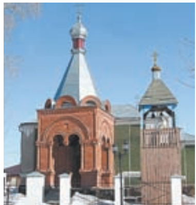
Храм пророка Ильи.