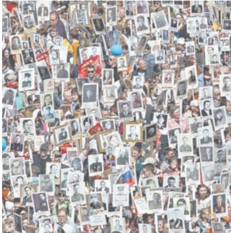
«Бессмертный полк» объединяет потомков солдат.