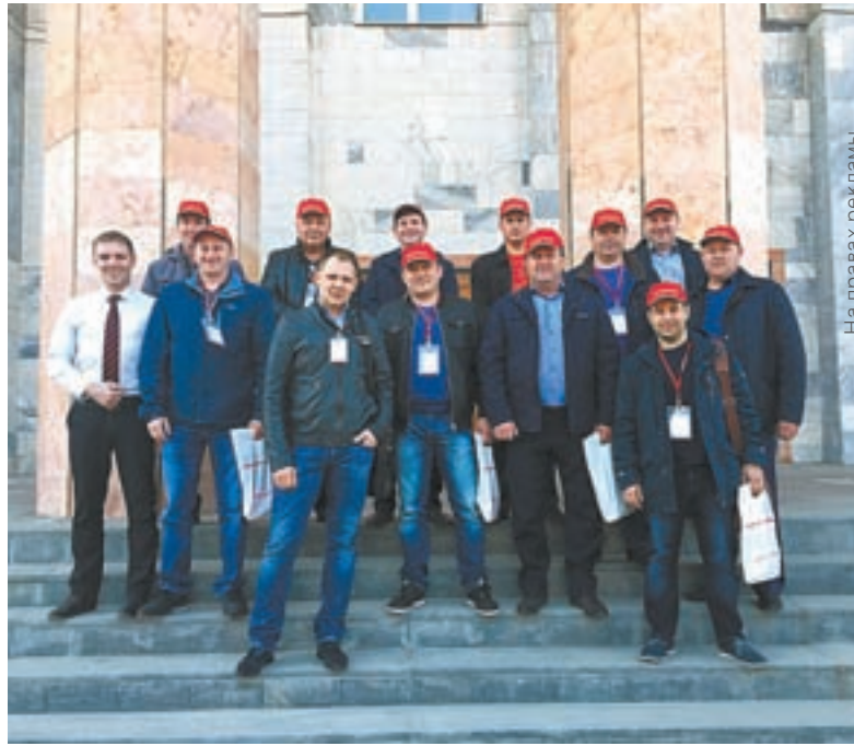
Делегация Алтайского края.

– Мы уже восьмой год пользуемся техникой производства Ростсельмаш. У меня шесть комбайнов VECTOR, еще одну уборочную отработают, и нужно будет менять на новые. Я не первый раз участвую в поездках, организованных Торговой ком-