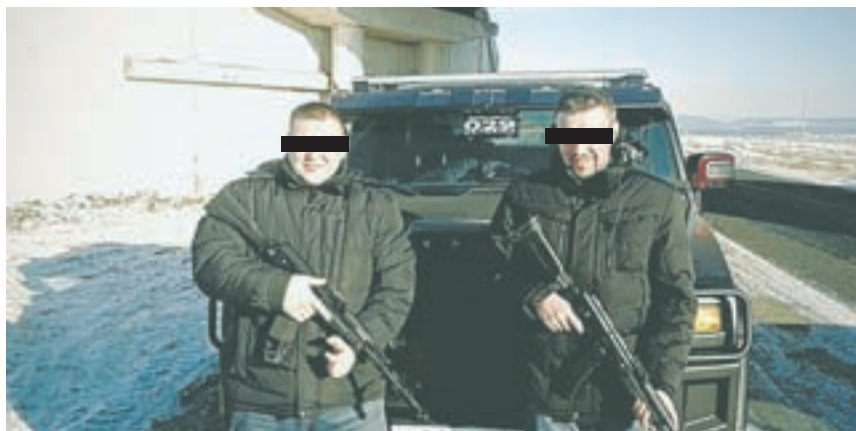
Чтобы напасть на пожилых супругов, братья вооружились обрезом и битой...