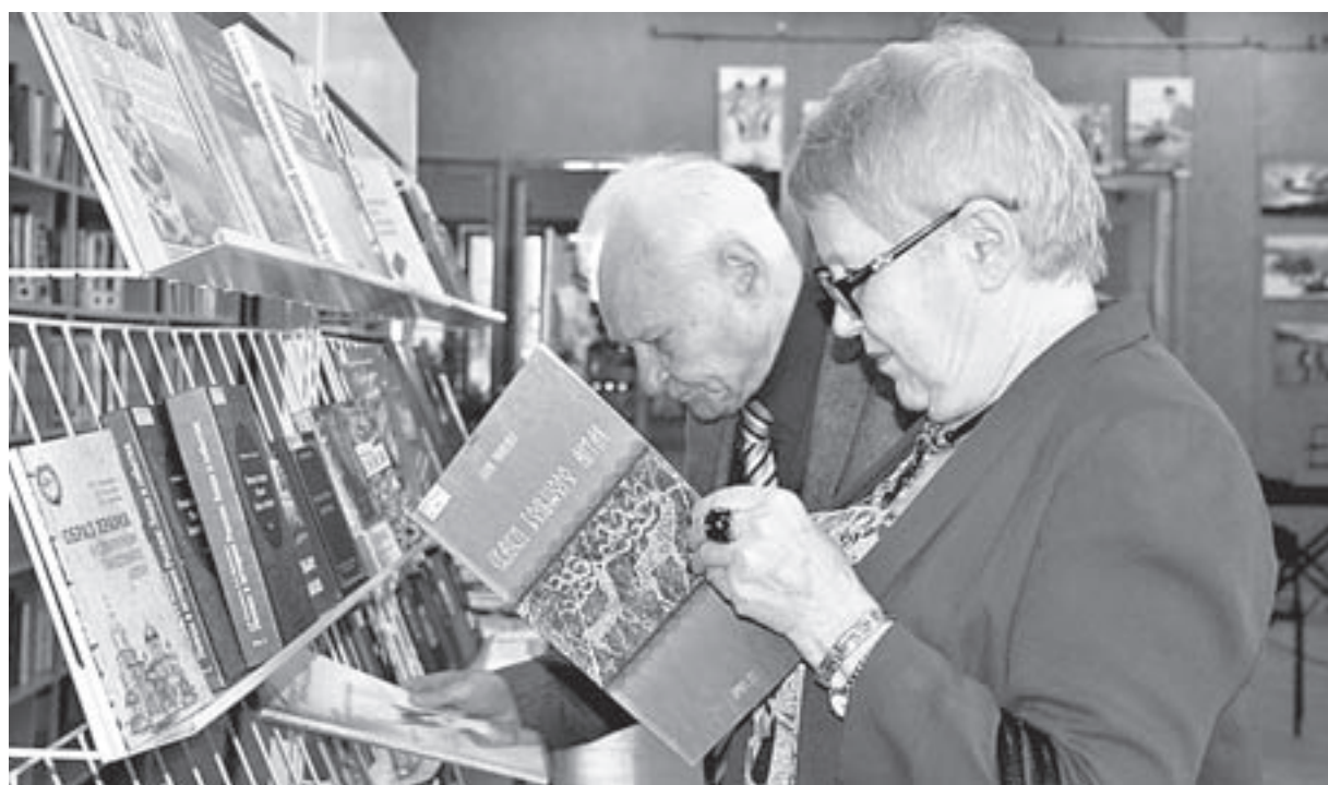
Выставка книжных новинок вызвала большой интерес.