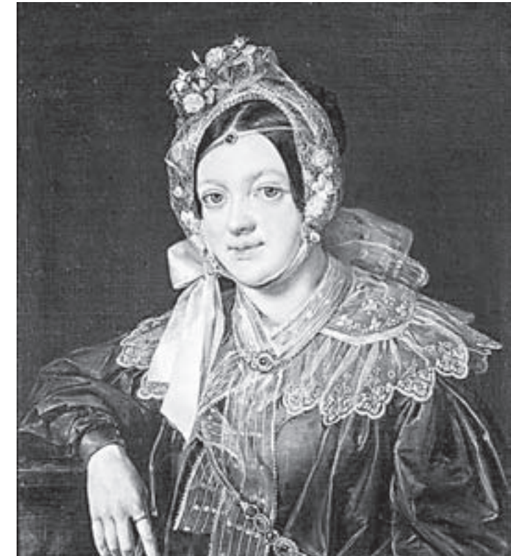
Василий Тропинин. «Дама в зеленом» (1838). Художественный музей.

Мастер-классы по живописи и акварели. Подробности по тел.: 22-61-02, 8-913-260-6995.