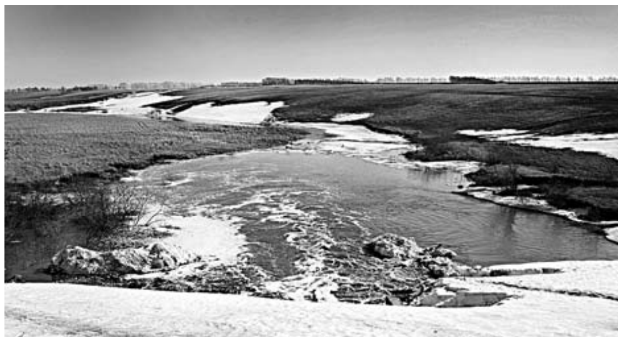
Подготовка к первой волне паводка в крае прошла в полном объеме и успешно.

При неблагоприятных гидрометеорологических условиях (обильные и продолжительные осадки, высокие ночные и дневные температуры воздуха) в период формирования максимальных уровней воды (май-июнь) в верховьях рек