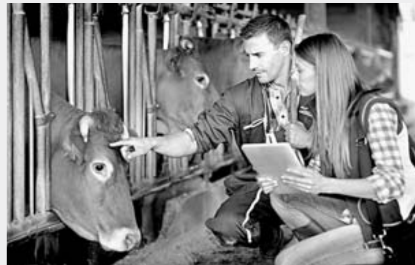
Наиболее активно перепись прошла на селе.

На 30 марта в сельской местности рассказали о своем бизнесе 87% предпринимателей, в крупных городах — 47%. Главный статистик края выразил надежду, что за оставшиеся два дня результаты вырастут