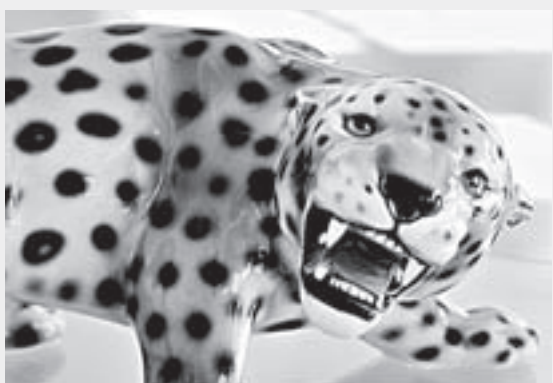
«Леопард». Фарфоровая фигура из Италии.

В Барнауле в музее «Город» открылась уникальная выставка «Фарфоровый зоопарк».