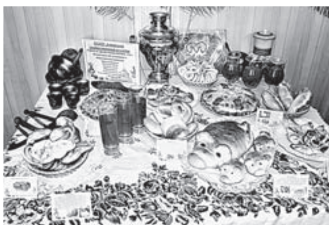
Угощений хватит на всех.