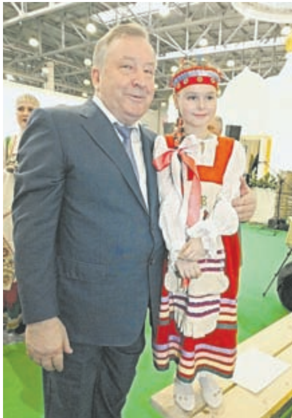
Губернатор Александр Карлин: «Сельский туризм – востребованный сегмент туристической отрасли».