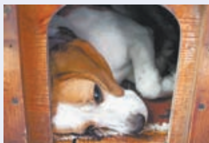
Хорошо, когда есть своя будка.