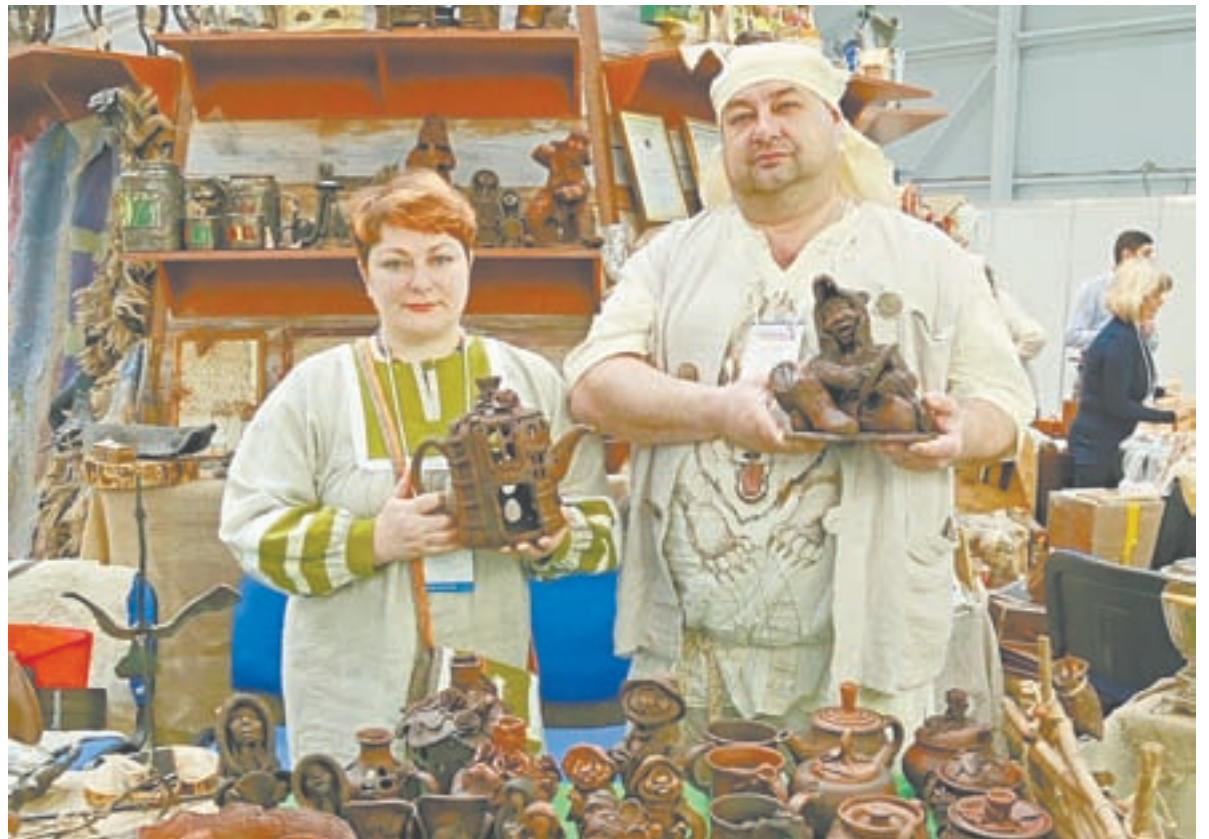
Наши ремесленники предоставили огромный выбор своих работ.