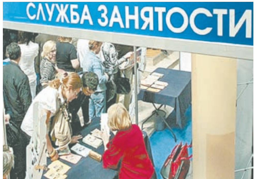
Оборотистая женщина фиктивно трудоустроила в рамках госпрограммы четырех безработных.

Через некоторое время на счет сберкнижки пришли деньги – несколько десятков тысяч. Всю сумму