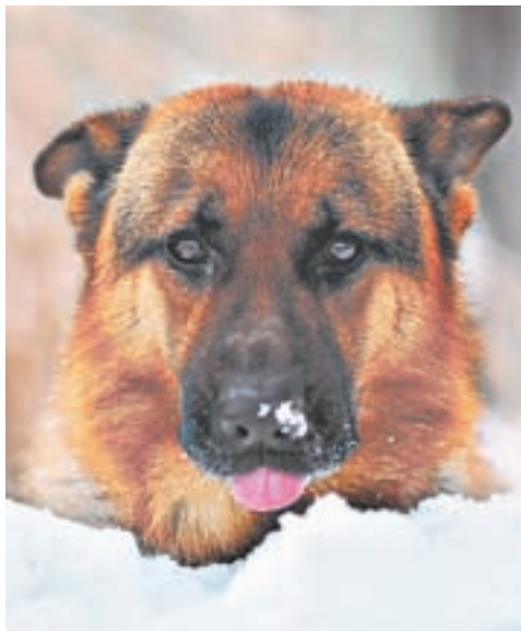
Умный, все понимает, но говорить пока не умеет. Научим?

Британские исследователи подтвердили подозрения многих хозяев собак — лучшие друзья человека действительно умеют распознавать то, как эмоции отражаются на лице и в голосе даже незнакомых им людей, говорится в статье, опубликованной в журнале Biology Letters , а перевели её на русский язык РИА «Новости».