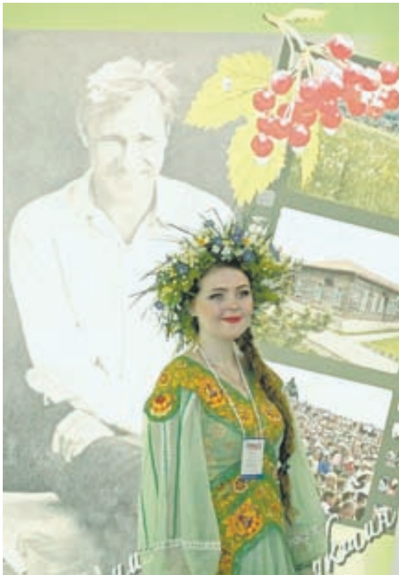
В интерактивной зоне можно было узнать о творчестве Василия Шукшина.

– Пряник изготовлен только из натуральных алтайских продуктов: меда, муки, сливочного масла, в специи входят травы и ягоды. В прошлом году мы получили Гран-при на Всероссийском конкурсе «Туристический сувенир». На Дне города в Барнауле