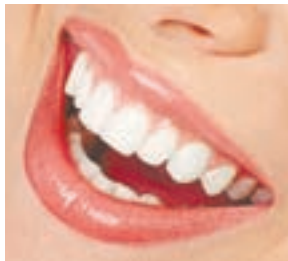
Зубы нужно чистить не менее двух раз в день.

С 15 по 22 марта студенты и педагоги стоматологических кафедр АГМУ проводили социальные акции для школьников, студентов и пенсионеров. Встречи проходили на базе центров совета ветеранов различных районов города. Как сообщают организаторы, со всеми желающими проводились профилактические беседы, лекции по профилактике заболеваний полости рта и современным средствам гигиены, в том числе местных производителей.