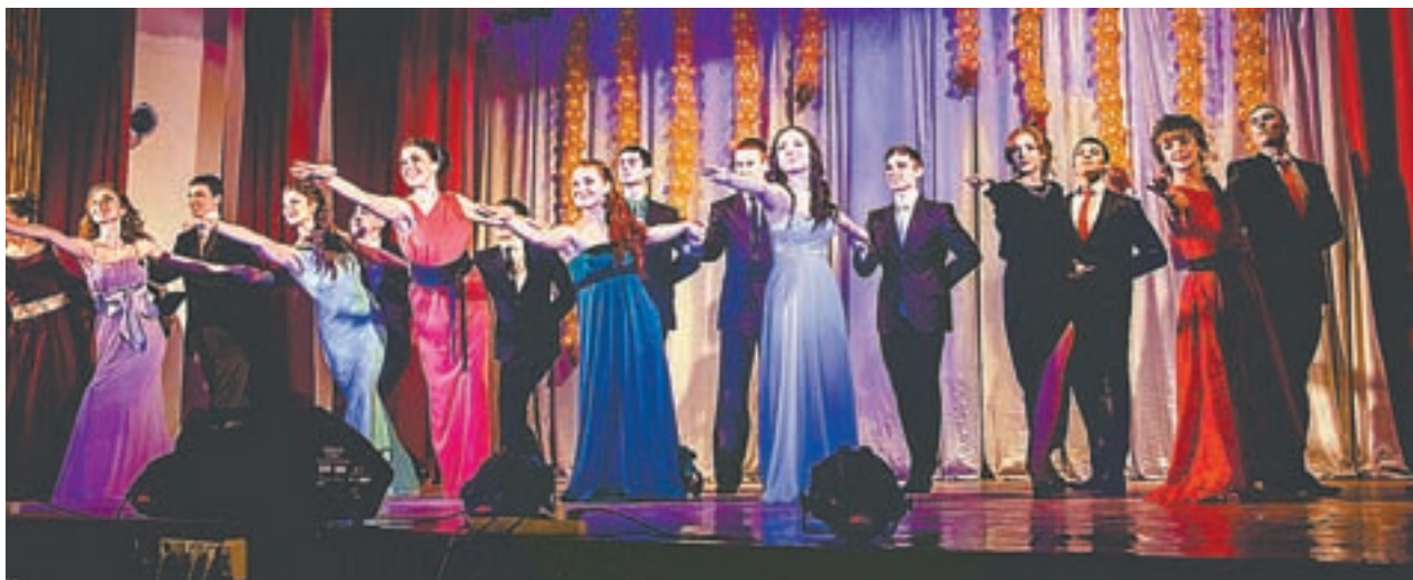
Во время дефиле.

В Алтайском государственном педагогическом университете выбрали лучшую пару бойцов студенческих отрядов.