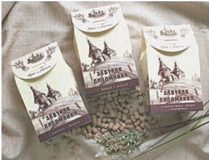
Отруби с алтайскими травами особенно актуальны в пост.

«С учетом пожеланий монастыря мы разработали три наименования: отруби с душицей и мелиссой, отруби