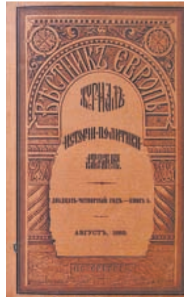
В этом популярном издании публиковались произведения нашей землячки.