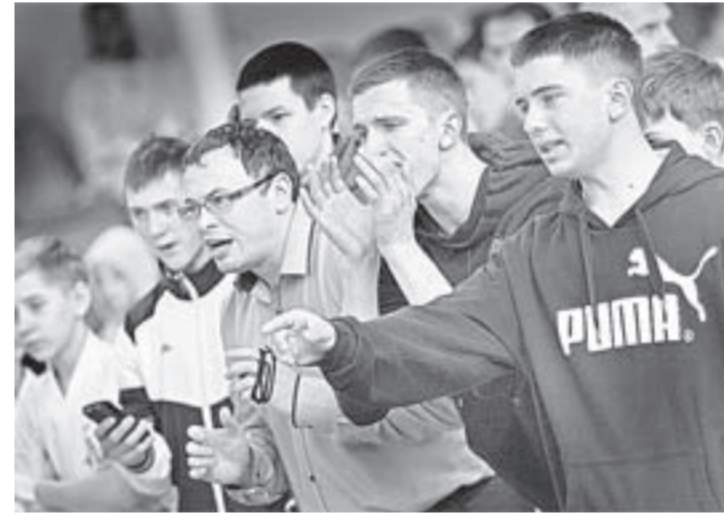
Зрители переживали сильнее участников.