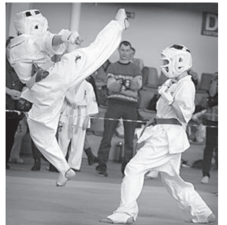
Синкёкусинкай — очень зрелищный вид единоборств.

лет выступили выше всяких похвал. Сборная Алтайского края заняла второе место, уступив лишь более многочисленной команде из Новосибирской области.