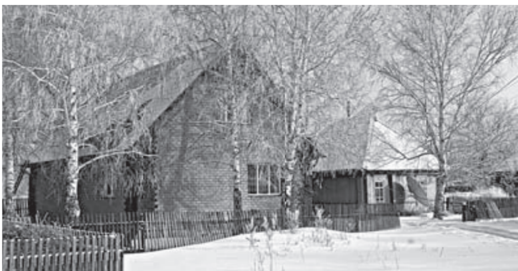
Весной этот дом будет утопать в зелени.