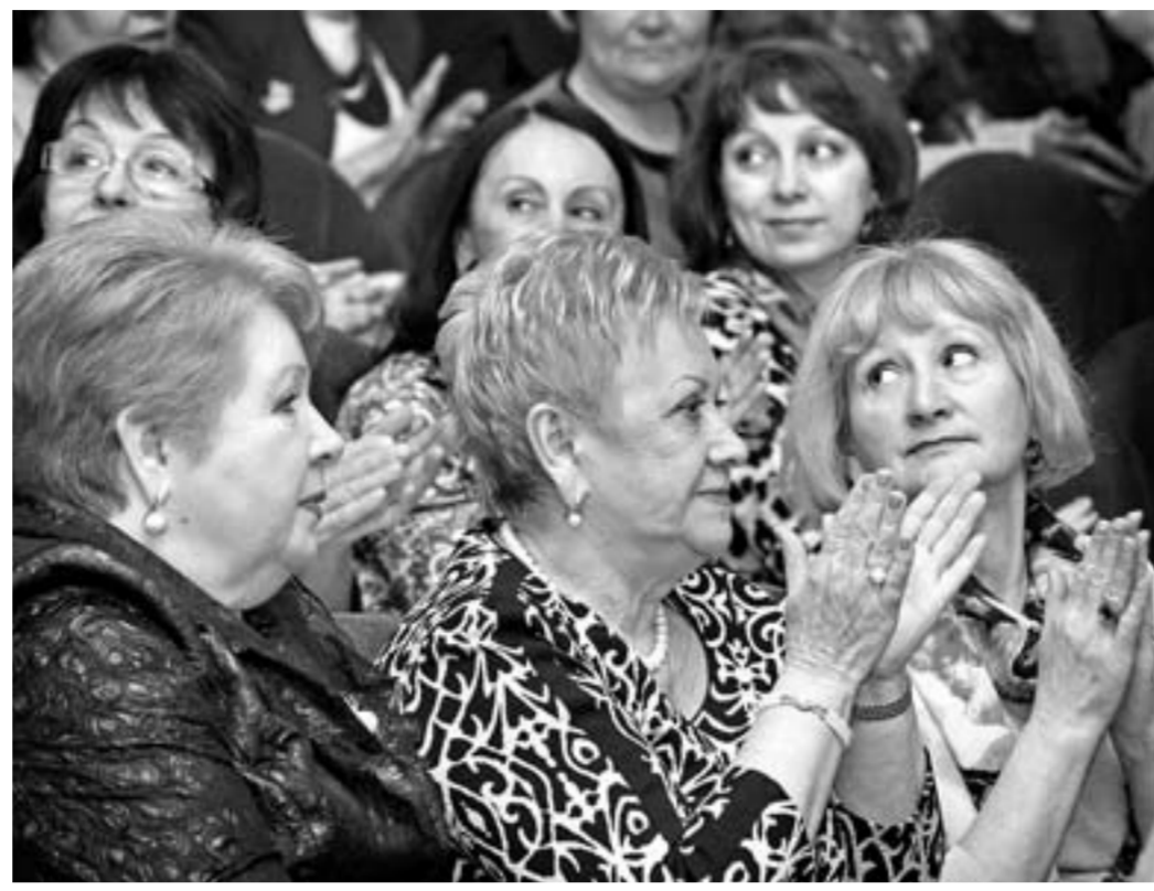
Коллектив роддома №2 – один из лучших в крае.

Приоритетом деятельности российской здравоохранения по-прежнему остается создание условий для оказания доступной, качественной, своевременной медицинской помощи матерям и детям, снижение материнской и младенческой смертности, репродуктивных потерь от аборт.