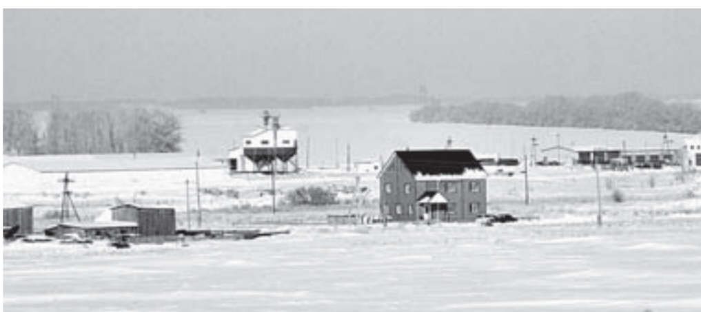
Новый коттедж стал украшением поселка.

На днях стало известно, что в этом году Алтайский край по ряду направлений госпрограммы «Устойчивое развитие сельских территорий» получит самые большие объемы поддержки в стране, в том числе на улучшение жилищных условий – 84 млн рублей. Это примерно столько же, как и в прошлом году. Как идет реализация программы в Поспелихинском районе, журналисты «АП» увидели своими глазами.