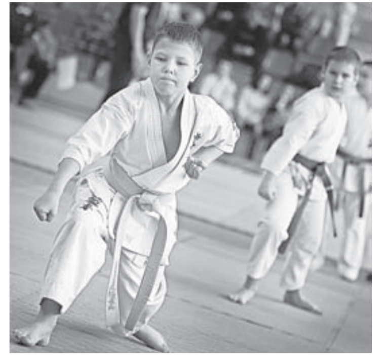
Карате закаляет характер.

года всерьёз претендовал на медали, однако в одном из предварительных боёв по решению судей уступил и выбыл из борьбы.