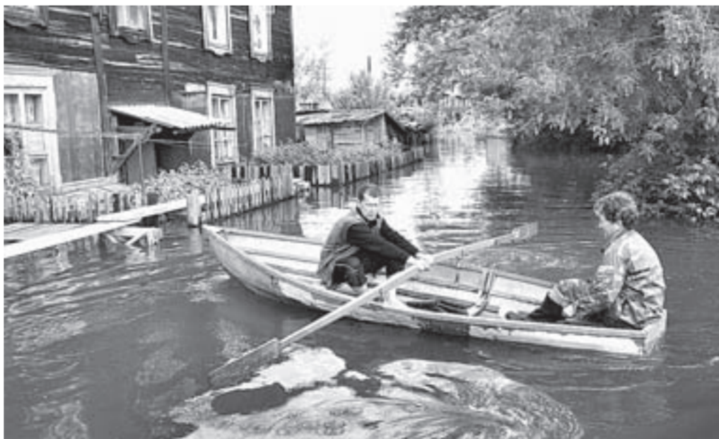
Барнаул, 2010 год. Затоп.