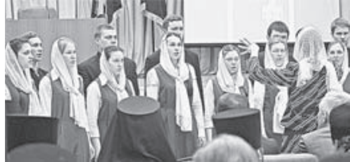
Выступление хора епархии.

Администрация края всегда принимала во внимание традиции русской православной церкви. В результате взаимодействия в регионе стал развиваться православный туризм. В 2014 году реализован межрегиональный православный проект «Казачьи рубежи России», в ходе которого построен храм в селе Малиновое Озеро. Одним из ярких примеров сотрудничества в благотворительной сфере является совместная творческая программа «Алтай православный». В ее рамках в прошлом году прошли благотворительные концерты