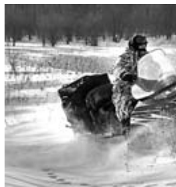
Снегоходы сметают все на своем пути.