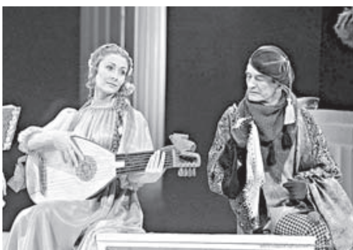
«Укрощение строптивой» (театр драмы).

Выставки «Модели боевой техники» к 70-летию окончания Второй мировой войны 1939-1945 гг. (6+), «За Веру и Честь» к 100-летию Первой мировой войны 1914-1918 гг. (6+) и др.