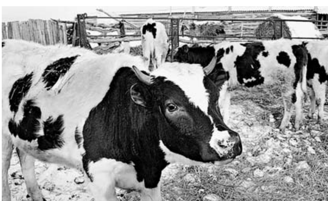
В планах Рябцевых – расширить семейную ферму.

размере 600 тысяч рублей на развитие фермерского хозяйства. Условие для пионеров было жестким – софинансирование. То есть к этим деньгам Рябцевы должны были добавить свой миллион с лишним. Это был самый сложный момент. Одновременно пришлось и выплачивать кредиты, взятые на покупку сельхозтехники, и в новый проект вкладываться. Деньги «вытаскивали» из поля. Оно не подвело. Как всегда, впрочем. Модернизировали помещения, закупили телят, оборудование, холодильники.