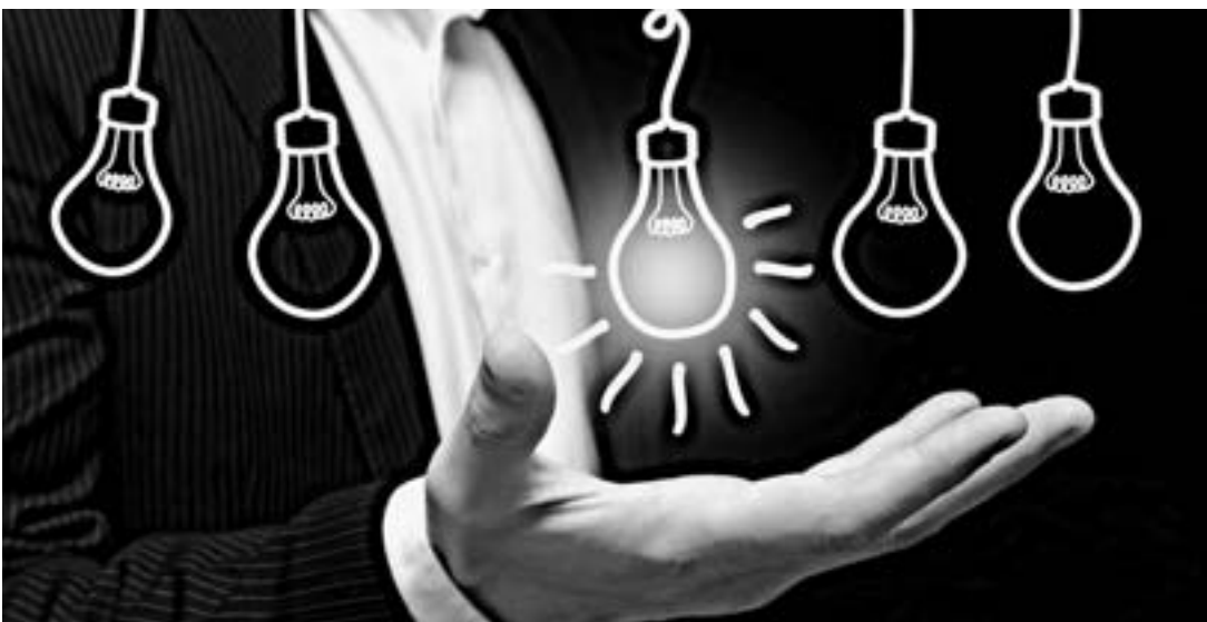
Далеко не всякий проект привлечет инвесторов яркостью и креативностью.

26 февраля оценить перспективность проектов пригласили представителей венчурного фонда «Промсвязьбанка», ассоциации «Бизнес-ангелы Сибири», Алтайского центра государственно-частного партнерства и привлечения инвестиций, банка «Финсервис», Алтайского фонда микрозаймов и руководителей и думающих, что разбираются в инвестиционном процессе.