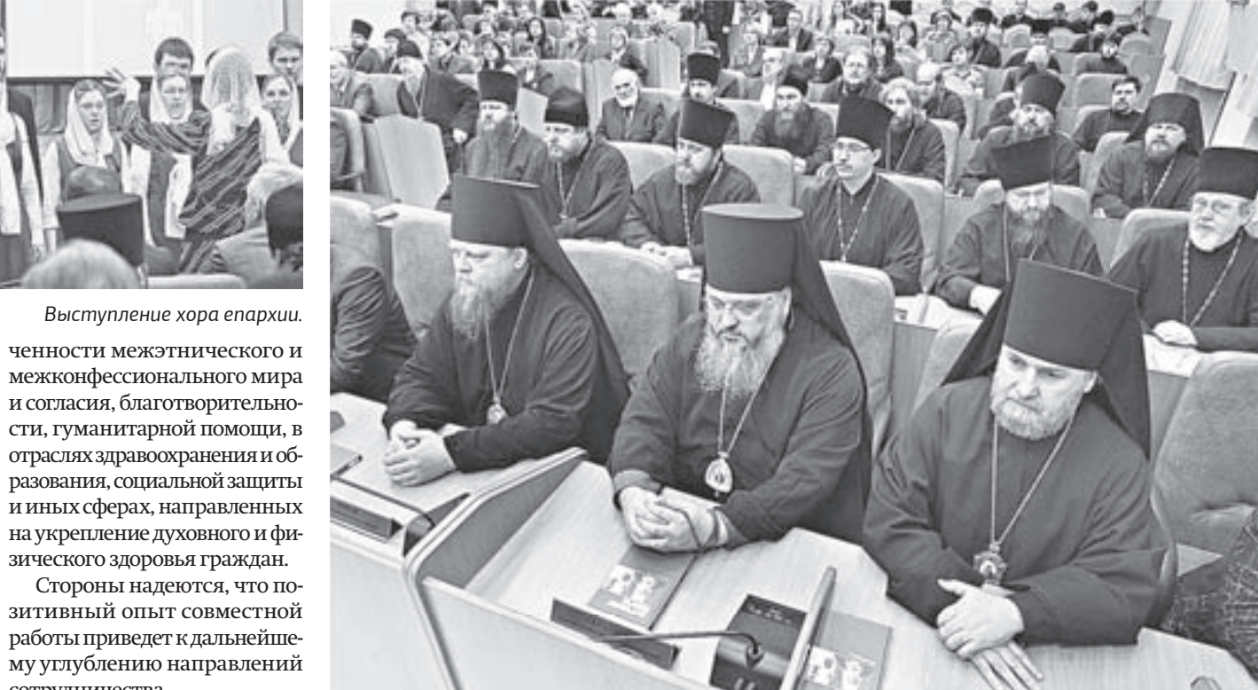
На презентацию издания приехали служители Русской православной церкви из городов Сибири и Алтая.