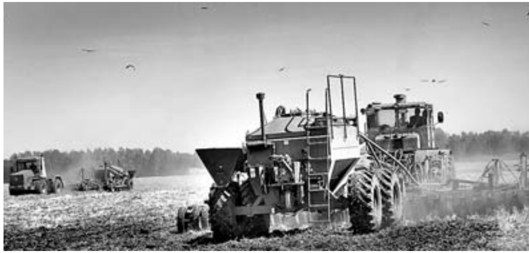
«Зерновой Давос» может скорректировать структуру посевных площадей.