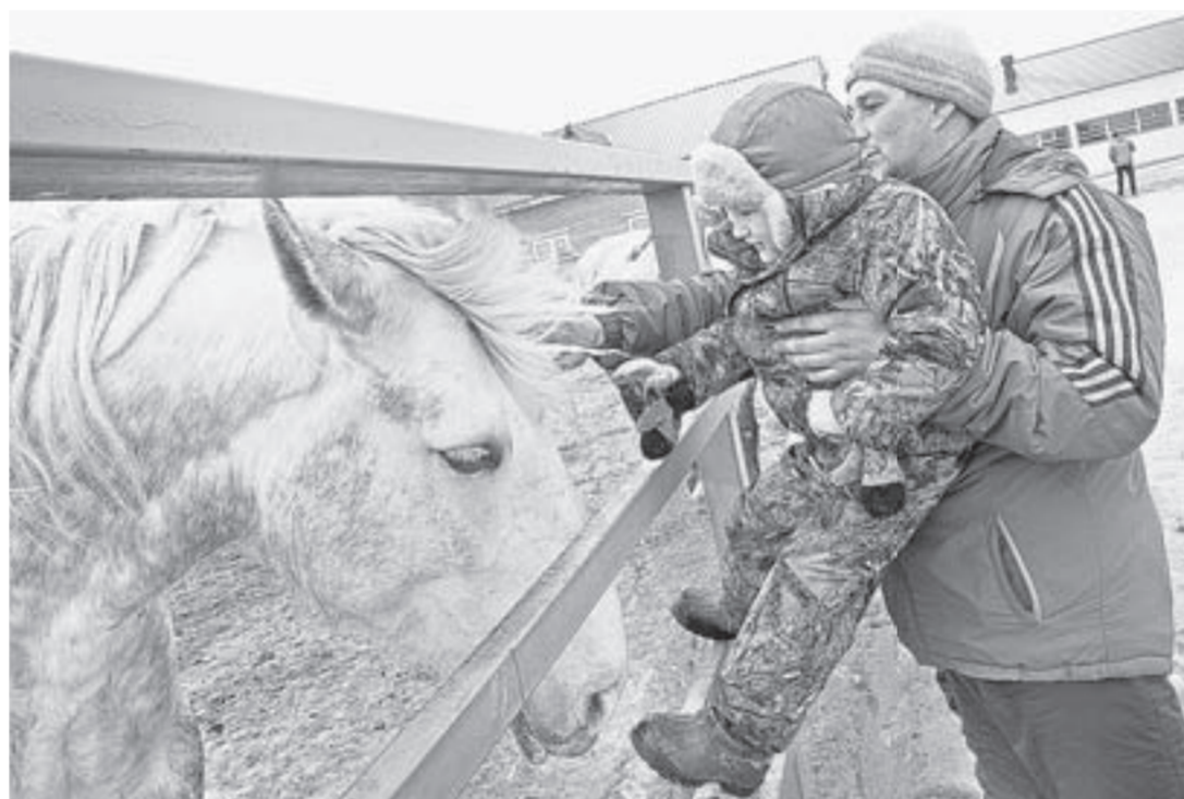
В олимпийской деревне – французский тяжелоатлет першерон.