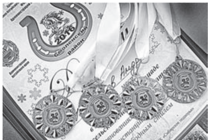
Победителям – кубки и медали.