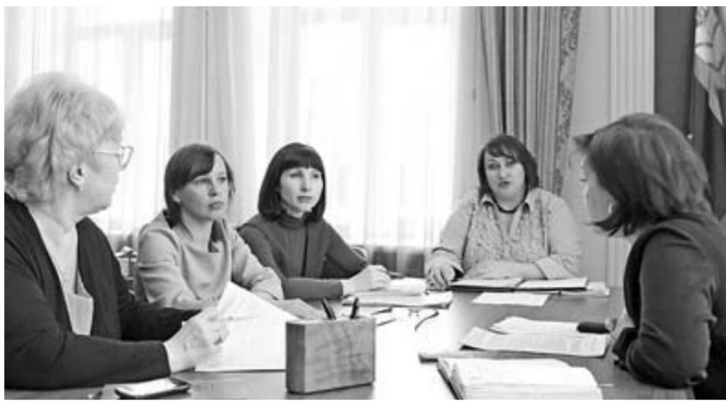
Информационная поддержка «Прямой линии» — от профильных отделов.

Напряженность на рынке труда, то есть количество претендентов на одну вакансию, в Барнауле меньше единицы. Это означает, что каждому работнику найдется рабочее место.