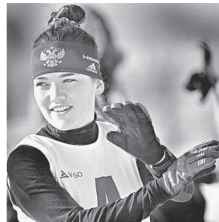
«Сибирское подворье» стало открытием для многих спортсменов.

С нетерпением болельщики предвкушали сражение в лыжных эстафетах, однако на-