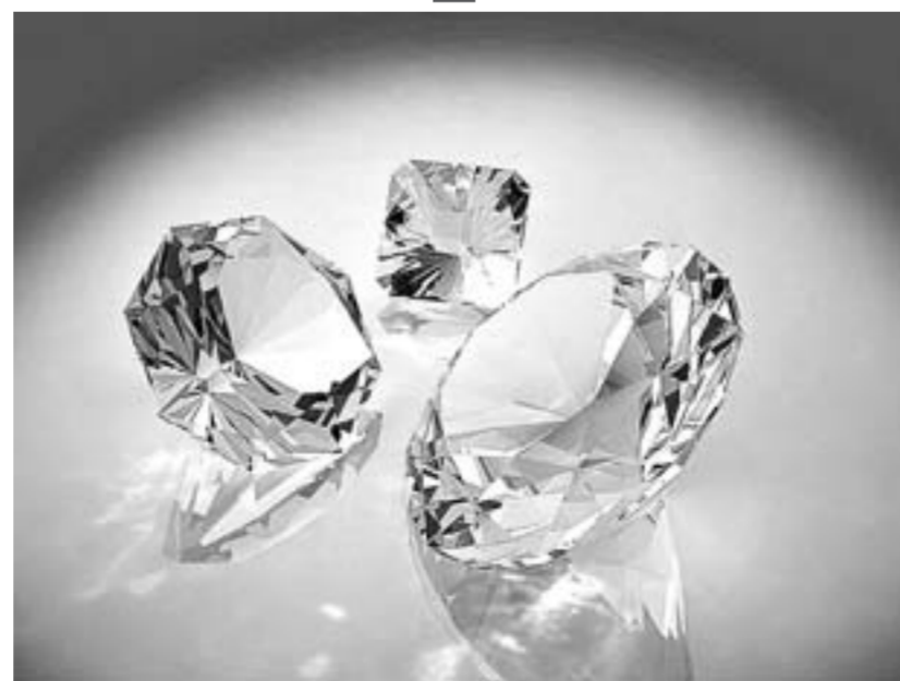
Самый твердый, красивый и дорогой камень – алмаз.