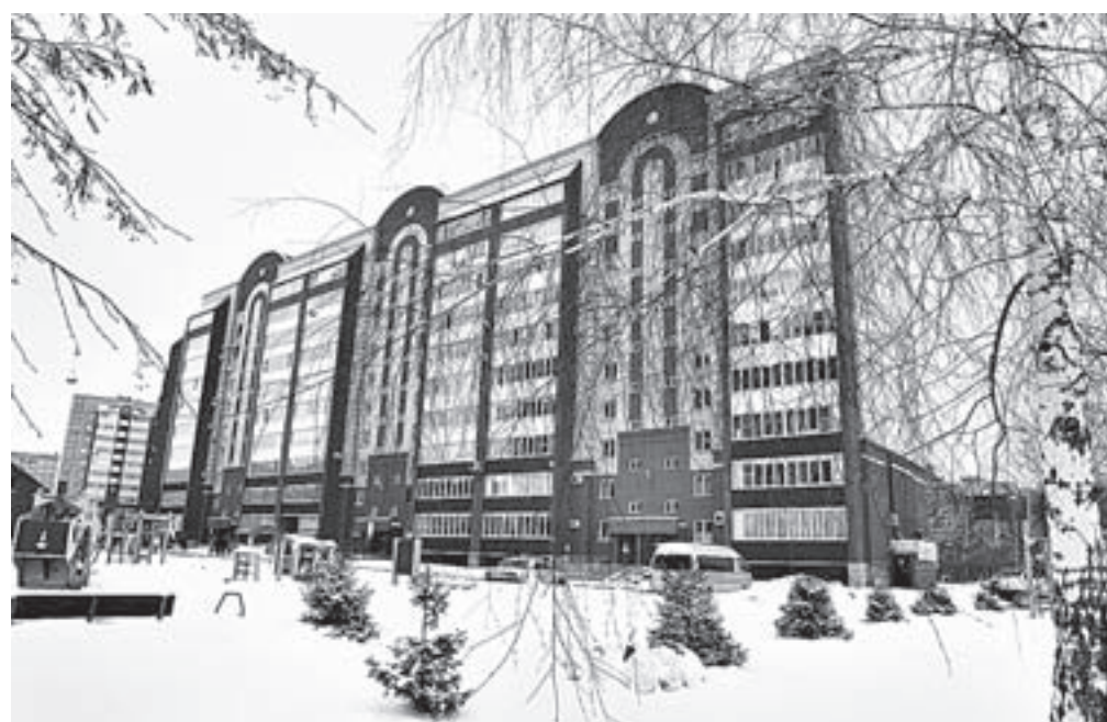
Многоквартирный дом на ул. Антона Петрова, 247-а – пример для подражания.