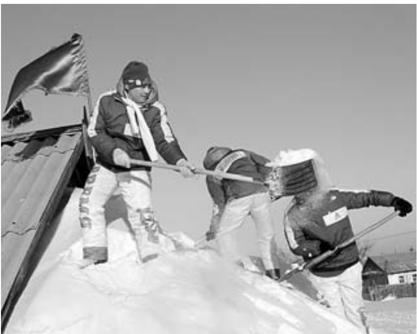
Студенты-помощники чистят крышу.