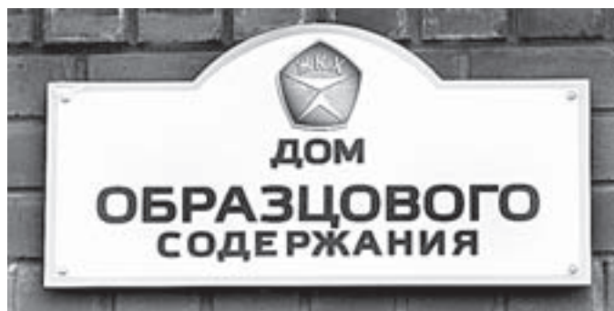
Таких табличек в России всего 14.