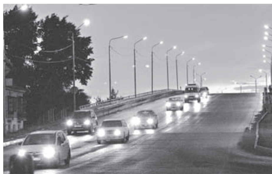
Город в ночи.

На территории города осуществляют вывоз мусора четыре организации: одна муниципальная и три частные. Но на сегодняшний день главная задача профильного управления – убедить население частного сектора (а он в Рубцовске весьма обширный) в необходимости заключения договоров на вывоз мусора. Пока это сделали менее половины. Жители, конечно, могут и самостоятельно доставлять его на городскую свалку, но,