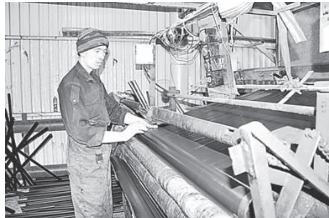
Объемы производства расширяются.

Однако без поддержки государства осуществить такое начинание, впрочем, как и многое другое, что было сделано на «Полимерпласте» в былые годы, было бы попросту невозможно. Господдержкой там пользуются уже несколько лет и делают это умело, как говорится, по всем направлениям.