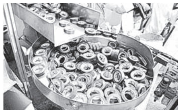
Эту продукцию знают в России и СНГ.

Расширение объема производства и появившиеся ощутимые конкурентные преимущества на рынке подтолкнули руководство предприятия к созданию новой производственной площадки. Заместитель директора