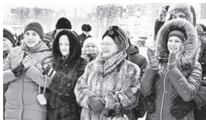
Счастливые жильцы образцового дома.

жилья около 9 рублей, ниже общегородского.