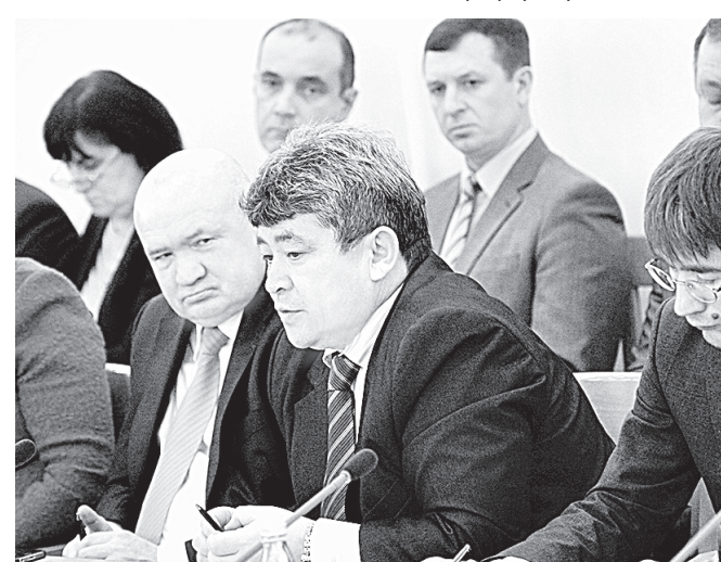
Эксперты со всей Сибири приехали на совещание в Барнаул.

рианта. Первый – продлить работу фонда, о чем просят большинство губернаторов. Но вопрос заключается в том, где взять деньги. Второй вариант – переход на новую концепцию, сейчас уже готовится проект закона. Это маневренный фонд, социальный наём. Жилье продолжит строиться, люди переселяться, но по другой программе. Это не будет частной собственностью.