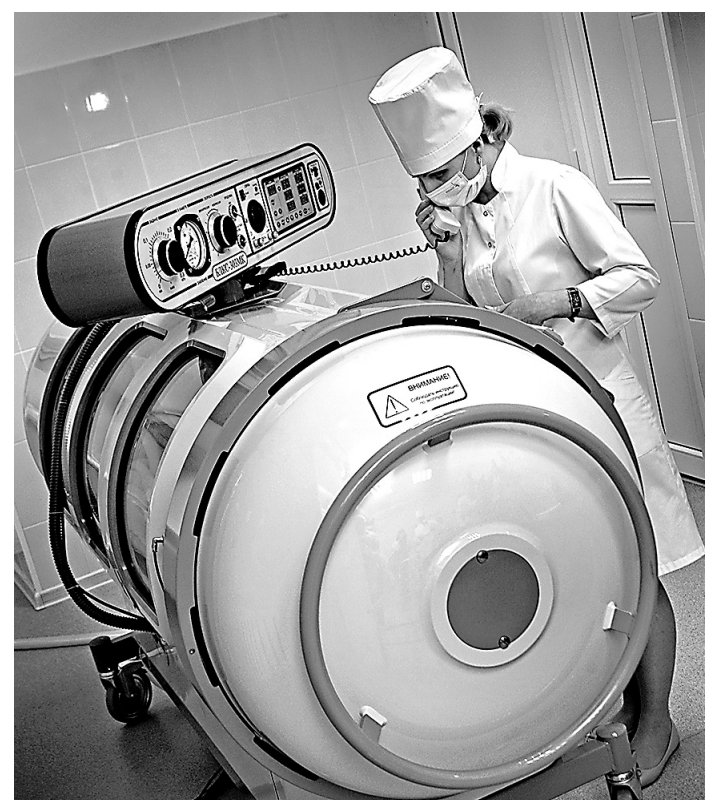
Барокамера незаменима при отравлениях угарным газом.

высокотехнологичную медицинскую помощь, стоимостью которой Коломиец оценивает примерно в 60-70 тысяч рублей на пациента. Если брать только гемодиализ, то одна процедура вместе с работой персонала стоит больнице 12-15 тысяч. А последний пациент, которого спасли с помощью гемодиализа, получил 31 процедуру. Арифметика проста, вопрос один — где взять недостающие деньги? Пока отделение работает за счет больницы, но что будет дальше? По словам Коломиеца, объемы финансирования определяются на федеральном уровне. Главврач говорит, что решением вопроса стала бы дифференцированная оплата — прежний уровень для пациентов, получающих стандартное лечение, и приравненное к