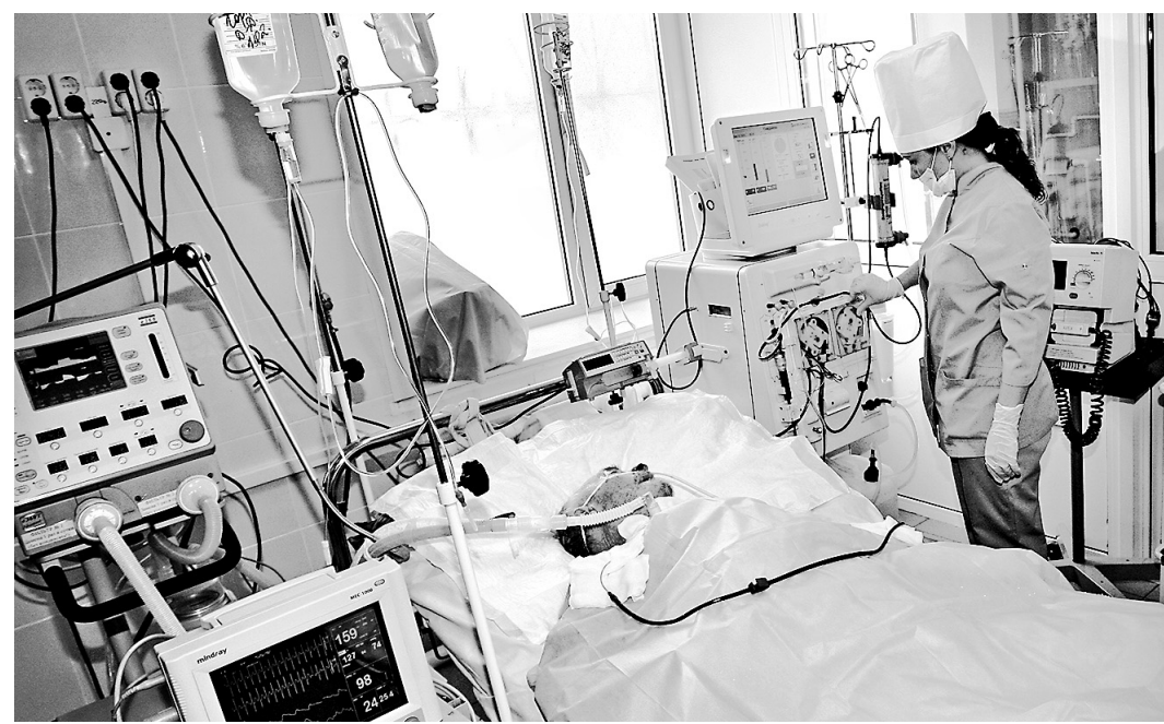
Гемодиализ спас не одну жизнь.

— Некоторые больные поступают к нам в таком состоянии, что просто не могут находиться в общем приемном покое с пациентами обычных отделений. Поэтому, во-первых, необходимо было позаботиться об отдельном при-