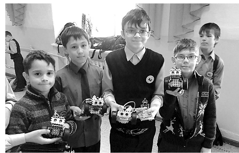
Юные барнаульские изобретатели пробуют силы в масштабных соревнованиях по робототехнике.

Самой зрелищной частью соревнований стала битва роботов-котов в импровизированном