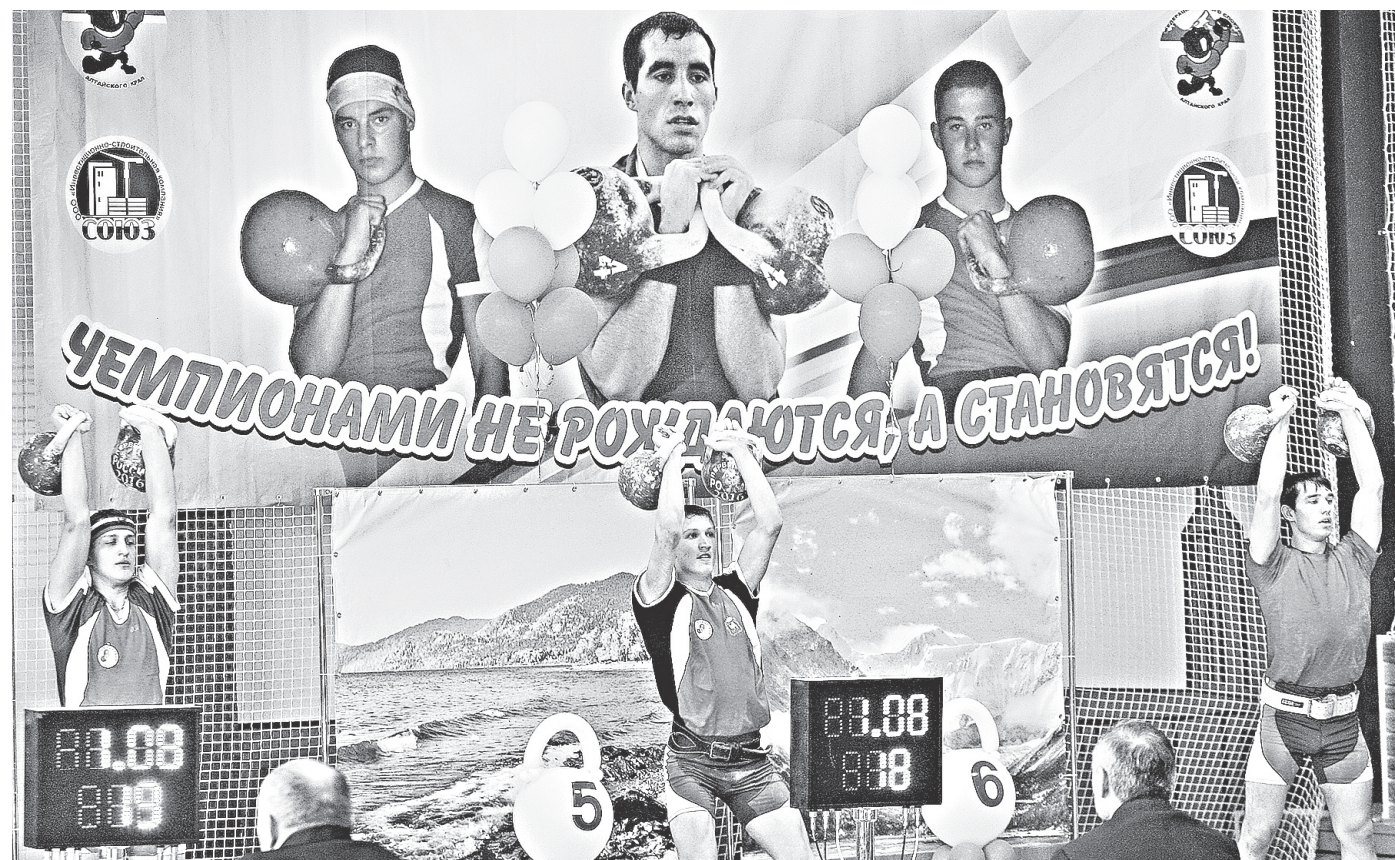
Гири не терпят слабых на помосте.