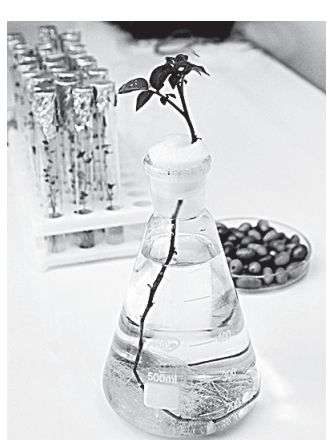
Лабораторный безвирусный картофель.

Если коротко, то определенный сорт обрабатывается термически и химически, проращивается, а из проростков изымается эксплант – всего несколько десятков клеток, освобожденных от любых заболеваний. Дальше его растят в небольших пробирках