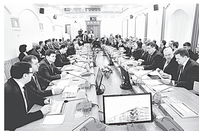
В повестке дня – обсуждение самых важных вопросов по реформированию ЖКХ.

– Таких домов очень много, – сказал он. – Есть два ва-