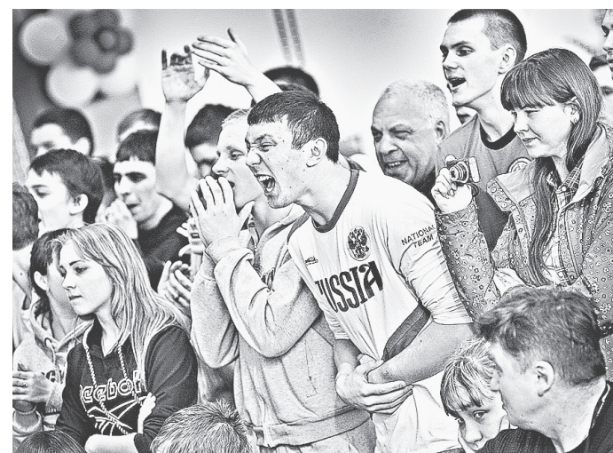
Эмоции зрителей порой зашкаливали.

Среди девушек, которые соревновались в рывке, развлеклись не менее серьёзные баталы. Особенно острой получилась конкуренция в категории свыше 63 кг, где на победу претендовали неоднократные победительницы