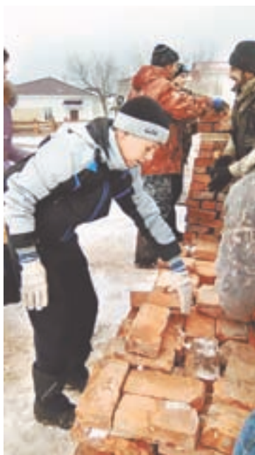
Помощь в строительстве храма.