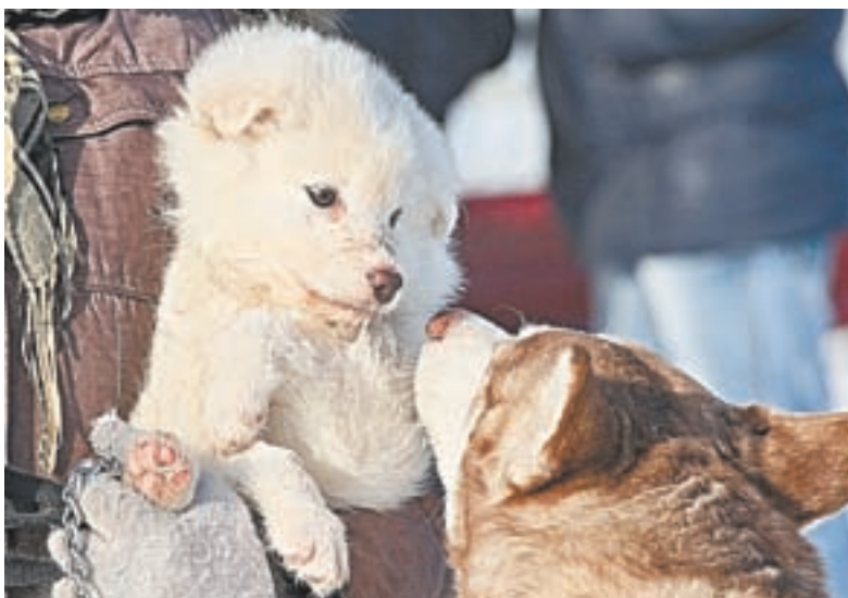
«Привет! Будем знакомиться?»

– Зена для меня самый надёжный друг. Родители разрешили завести овчарку лишь тогда, когда стала сама зарабатывать деньги. Не