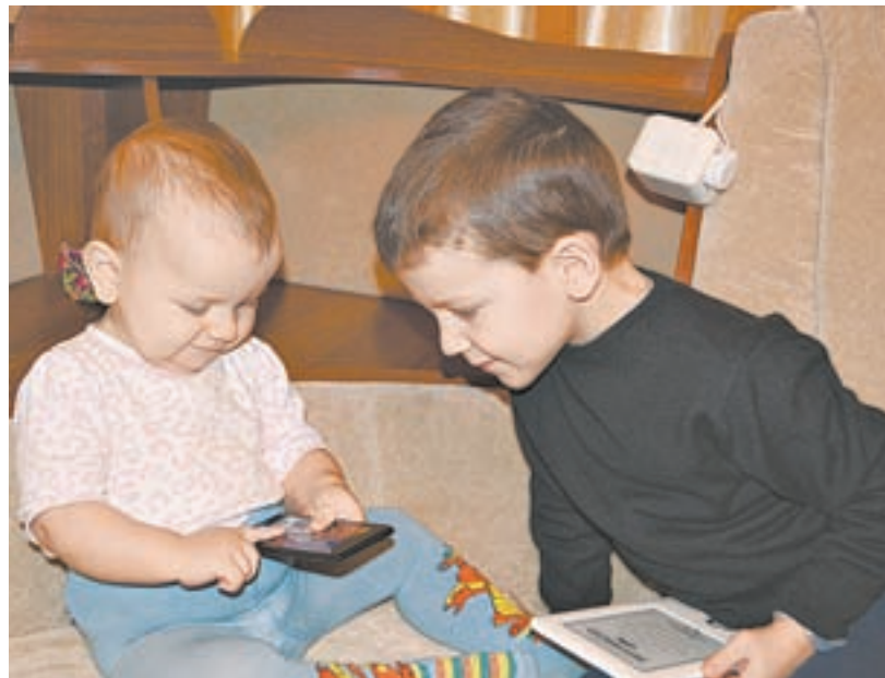
Современная техника вызывает интерес детей любого возраста.