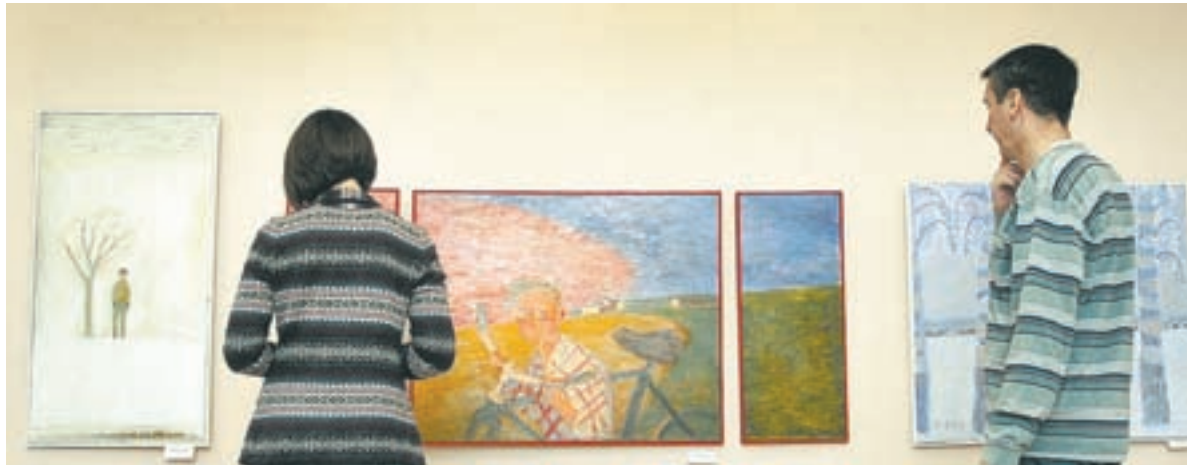
Экспозиция настраивает на философский лад.

Нынешняя экспозиция, как стало понятно из разговоров на открытии, создана в момент некоего творческого перепутья художника, завершения очередного жизненного этапа и поиска новых средств, тем и форм. «Сейчас у нас был такой разговор с автором, который, возможно, не совсем уместен перед открытием выставки: о творческой зрелости, о том, чего ждут от художника зрители, коллеги, критики. И мы хотели бы, чтобы эта экспозиция помогла художнику