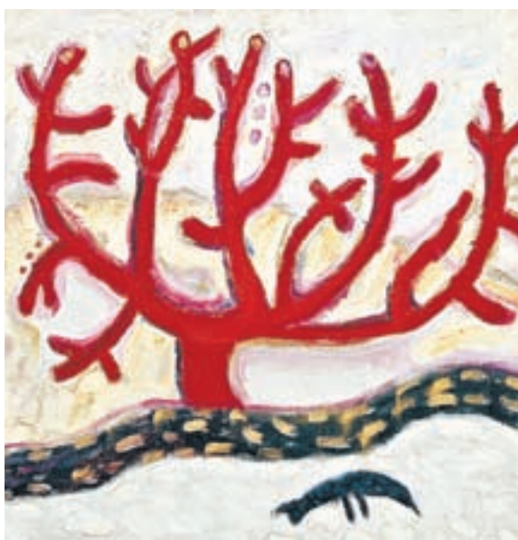
«Март. Яблоня. Ворона» (1998).