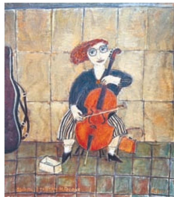
Художник тяготеет к символизму, примитивизму и «наивному искусству».

Итак, что же увидит зритель? Здесь есть ранние работы «Чары на ветер» (1990), «Гость» (1991), «Заговор от куриной слепоты» (1990), созданные в смешанных техниках. Это живопись с использованием фольги – наподобие того, как в иконописи художники использовали тончайшие листы сусального золота или серебра, «подсвечивая» изображение изнутри. Техника, неизбежно придающая работам некое мистическое древнее звучание. Есть работы московского периода, продолжавшегося несколько лет (например, таинственные пейзажи «Сумерки Патриарших» и «Городской романс»,