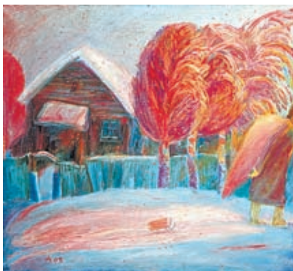
«Дом. Вечер. Ангел» (2005).