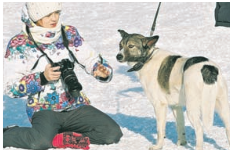
Фотосессия для четвероногих друзей.

ция различных кинологических видов спорта. Важно, чтобы люди поняли, как можно с пользой и весело провести время с любимыми домашними животными. Соревнования любительские, рассчитаны в большей мере на дебютантов.