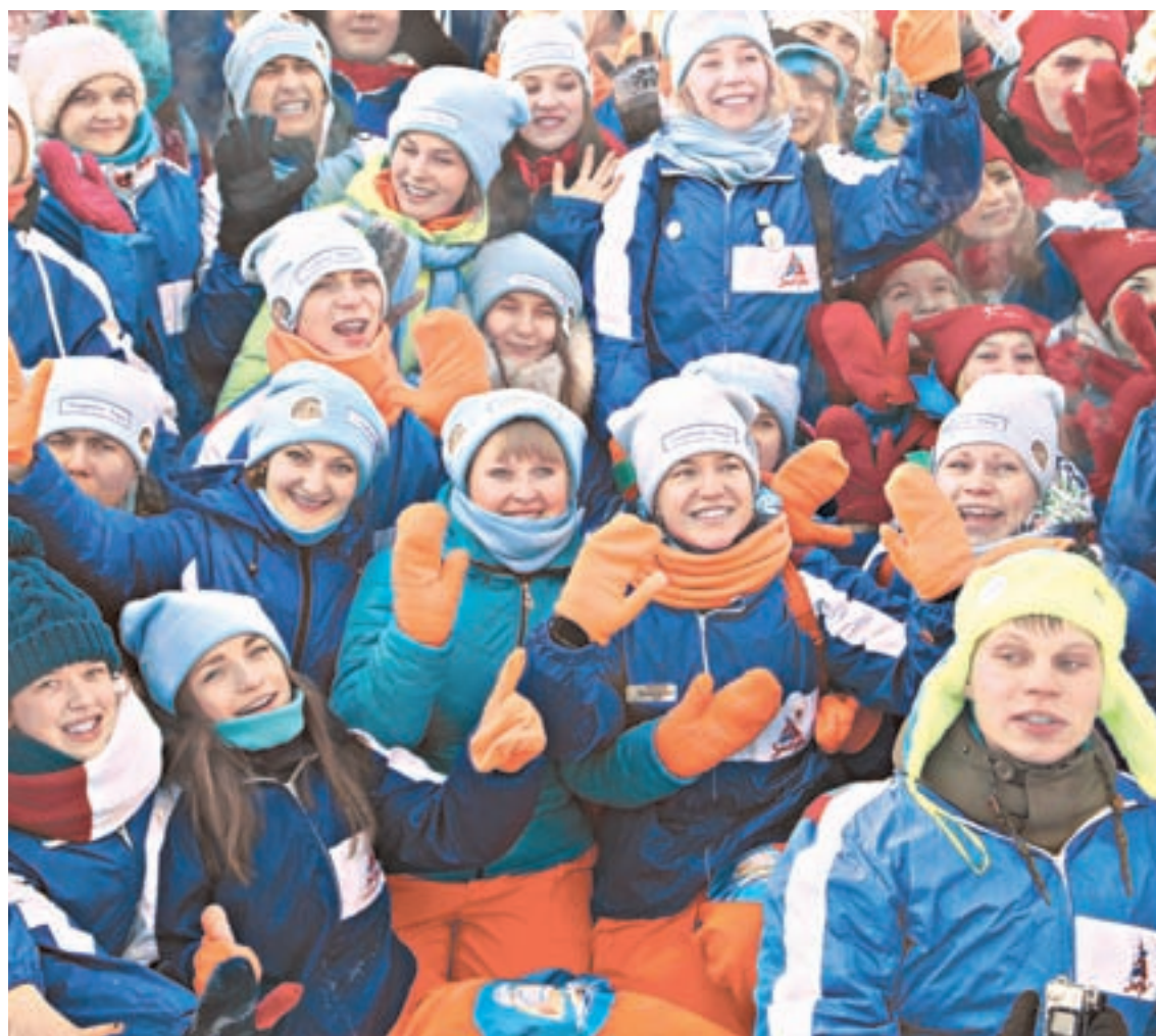
Бойцы к командировке готовы. Она продлится с 29 января по 7 февраля.

На минувших выходных ребята устроили генеральную репетицию и отправились в 15 городских школ. Они показали ученикам творческие но-