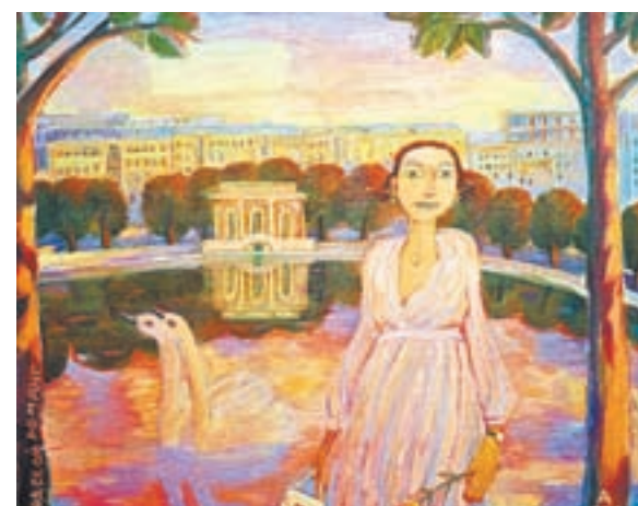
У картины «Городской романс» в этой экспозиции есть еще сумеречный «близнец».