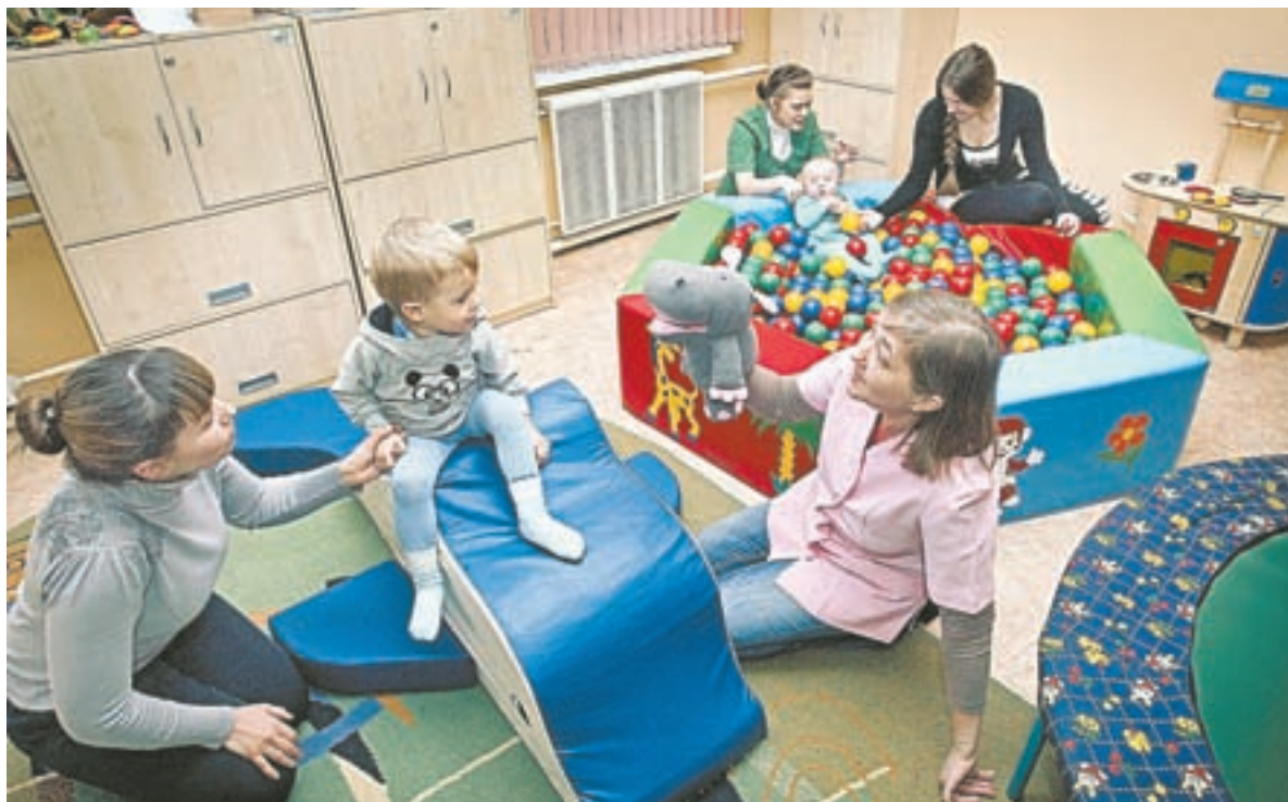
Специалисты центра ранней помощи в Барнауле помогают детям с ограниченными возможностями.