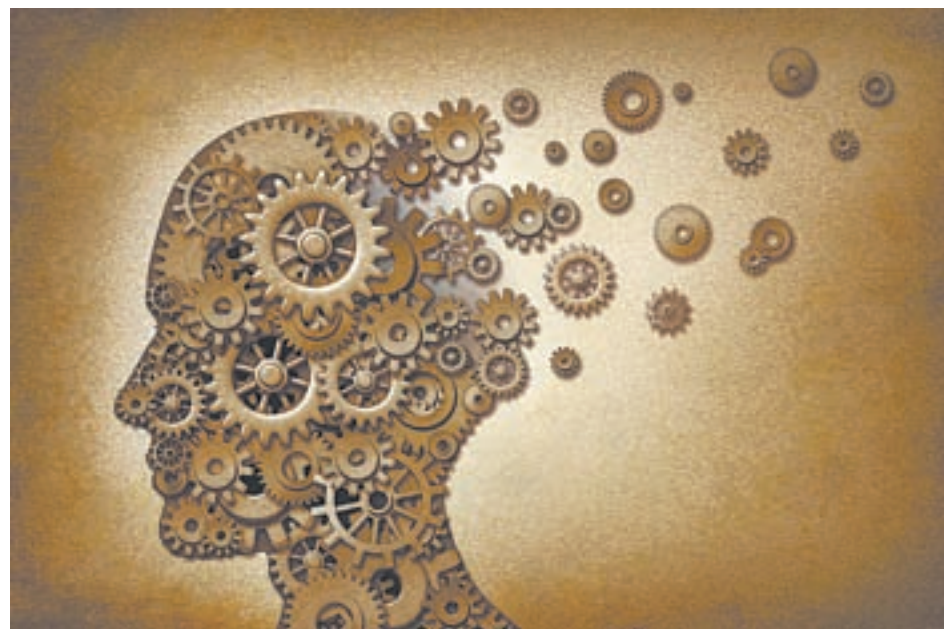
Как правило, люди принимают нерациональные решения, действуя по шаблонам.

Эффект якоря. Когда человек не знает, что произойдет, для того чтобы сори-