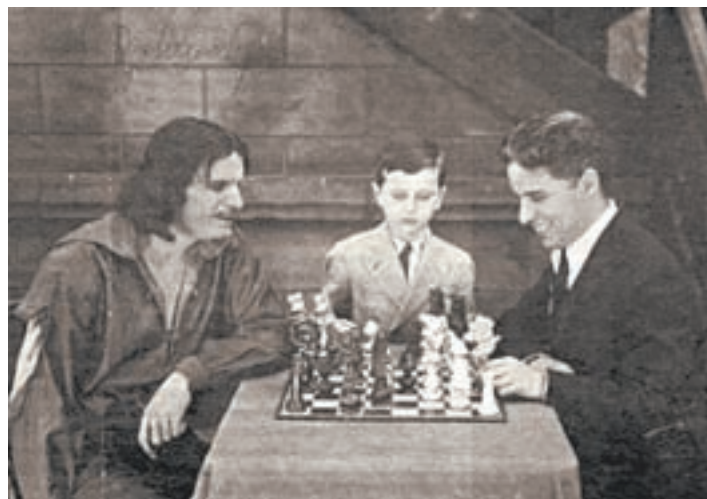
Малыш Сэмми Решевский учит великой игре Чарли Чаплина (за столиком справа) и Дугласа Фэрбенкса-старшего, добрых друзей советских разведчиков, находившихся в Лос-Анджелесе под дипломатическим прикрытием.

Досье на Фишера с итогами многолетней слежки за ним было частично рассекречено в США в 2002 году. А 10 лет спустя британская контрразведка МИ-5 рассекретила данные