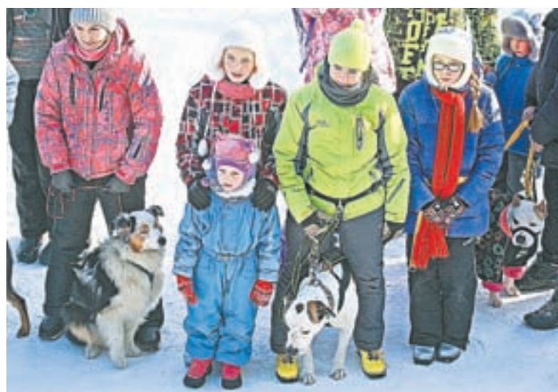
«Детские старты» были самыми весёлыми. Ребята и их питомцы ждут результатов.