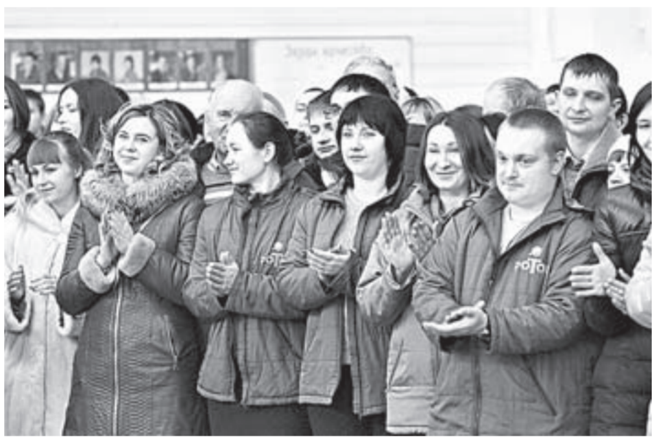
На предприятии стабильный коллектив с достойной заработной платой.