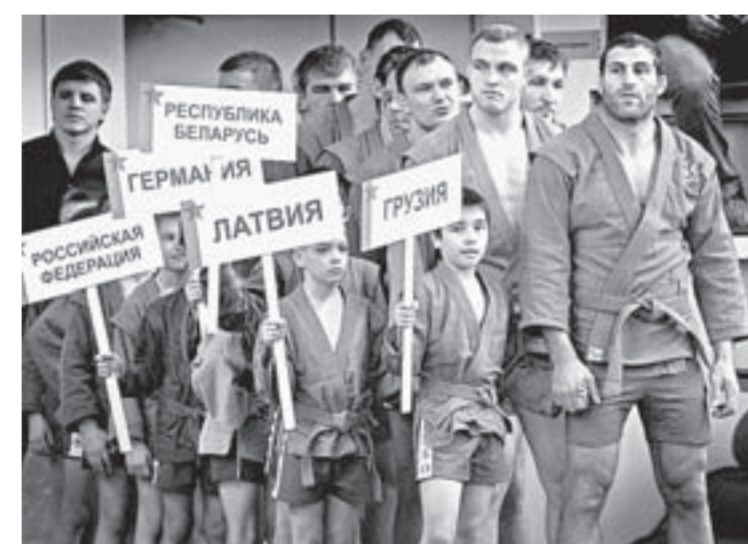
В состязаниях участвовали сплошь победители и призёры мировых и континентальных чемпионатов.