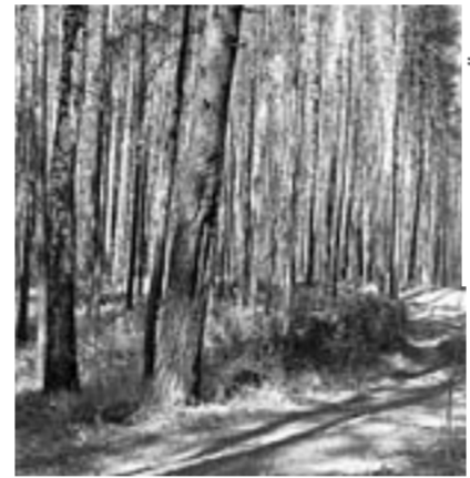
Среди деревьев хорошо и летом, и зимой.

Завершена инвентаризация лесных культур – об этом сообщили ведущие – специалисты отдела лесовосстановления и защитного лесоразведения, – который прошел в интерпрет-приёмной Главного управления природных ресурсов и экологии.