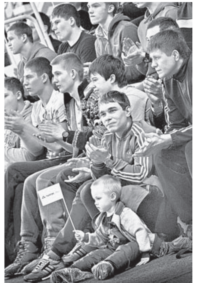
Спортивное шоу вызвало у горожан огромный интерес.

В Барнауле 22 января состоялся уникальный международный турнир «Кубок чемпионов» с участием сильнейших самбистов-тяжеловесов мира. Столь грандиозные соревнования были устроены в честь открытия Алтайского центра самбо.