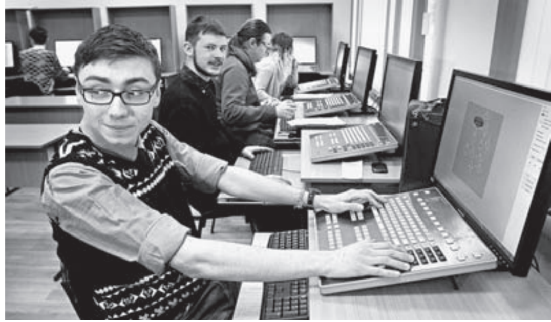
Студенты технического вуза проектируют новые приборы по заданию специалистов завода.