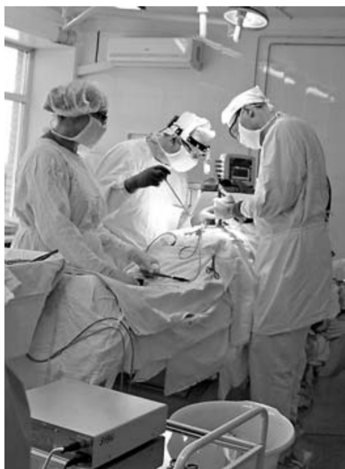
Быстрое и качественное оперативное вмешательство специалистов БСМП спасло немало жизней.

Если говорить о статистике, то специалистам больницы (до 2013 года она называлась городской больницей № 1) удалось спокойно пройти период новогодних праздников. По словам главного врача БСМП