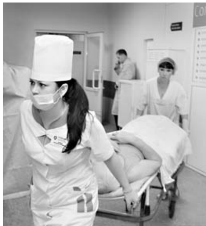
Тяжёлых больных отправляют на каталке в операционную прямо из отделения скорой помощи.

– Я не могу сказать, что в этом есть достижение больницы, скорее это совокупность разных факторов, в чем-то и повезло. Пока нельзя сказать, что мы полностью взяли ситуацию под контроль, однако очень многое нам удалось сделать. К примеру, впервые за много лет у нас снизилось количество летальных исходов в первые сутки поступления. Это заслуга наших врачей и, конечно же,