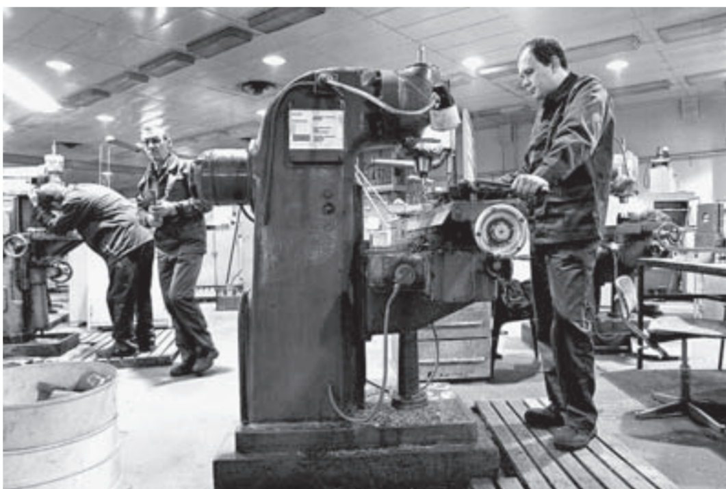
На «Роторе» создаются высокотехнологичные рабочие места.

Ежегодно «Ротор» осваивает порядка 20-30 наименований новой техники спецназначения. В 2015 году проходило активное освоение гидроакустического комплекса на подводные лодки – это перспективные разработки, кото-