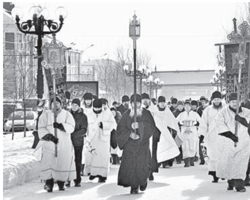
Крестный ход от Никольской церкви к часовне Святой Татианы.