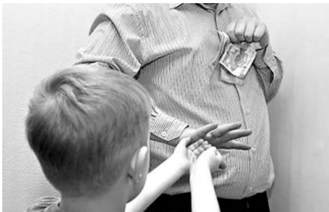
Папа, имей совесть!

Мнимые неимущие, причем нарочито неимущие, – отдельная тема исполнительного производства. Каждая вторая история про алиментщиков такая. Еще вчера судебные приставы с трудом взыскивали алименты со злостных неплательщиков из-за сложности сбора доказательной базы. Наконец решение проблемы найдено. Появился действенный инструмент воздействия – ограничение на пользование должником специальным правом (так эта мера звучит на языке законников). Проще говоря, они могут приостано-