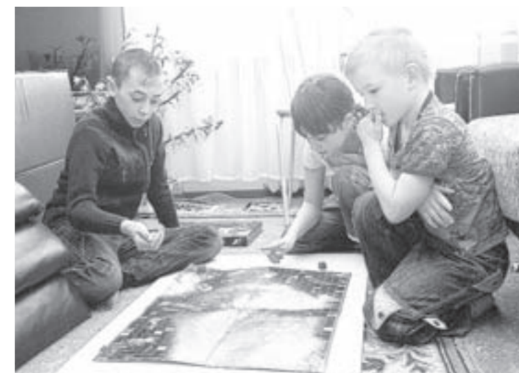
Игра – часть занятия.

После знакомства со всеми профессиями организаторы планируют провести конкурс