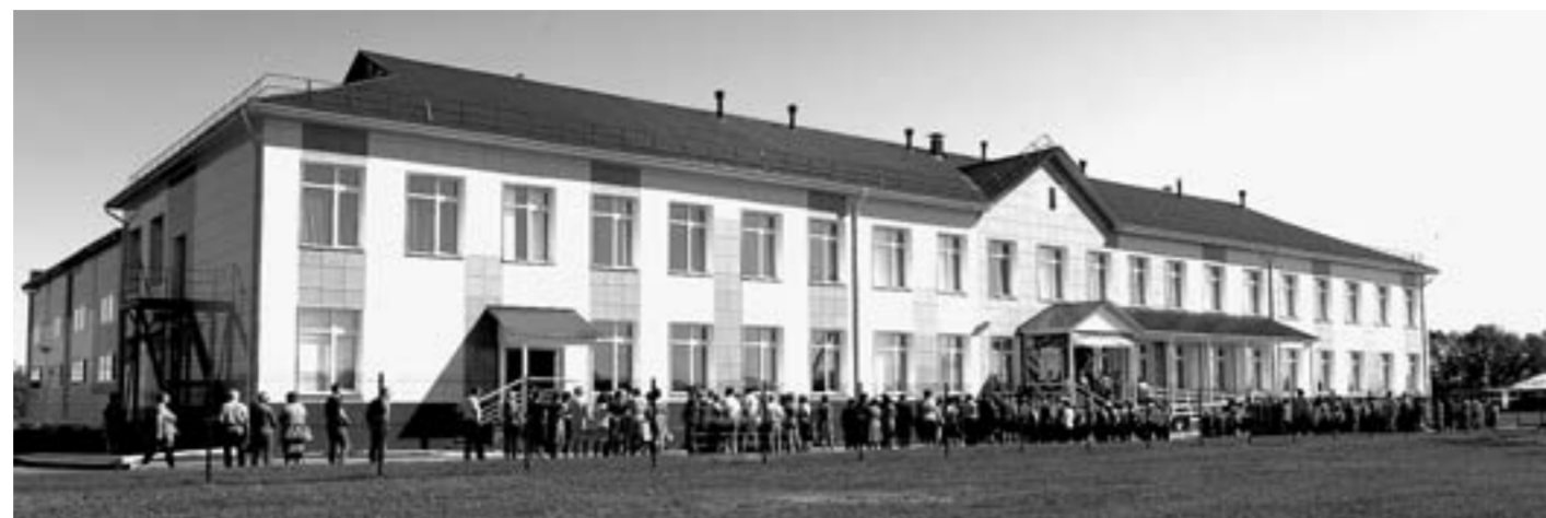
Новые школы будут строиться в городах и селах края.

– Что касается счета, выставленного по ОДН, я дам поручение разобраться с управляющей компанией и структурой, поставившей электроэнергию, – говорит глава региона. – Вопрос заключается в том, за какой период вам выставлен платеж. Если компаниями допущены нарушения, мы примем меры. По второму вопросу – на вас выйдут специалисты и все разъяснят. Закон подписан перед новым годом, механизм