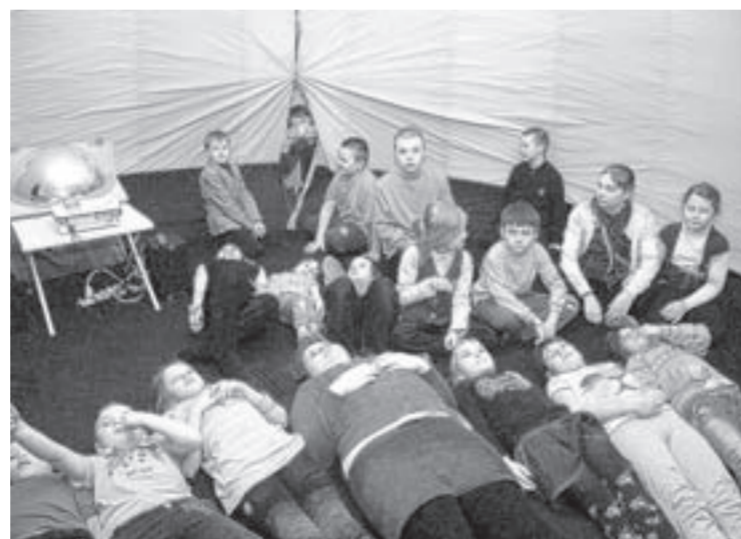
В передвижном планетарии ребятам показали увлекательный фильм о небесных телах.

– В игровой и познавательной формах волонтеры и специали-