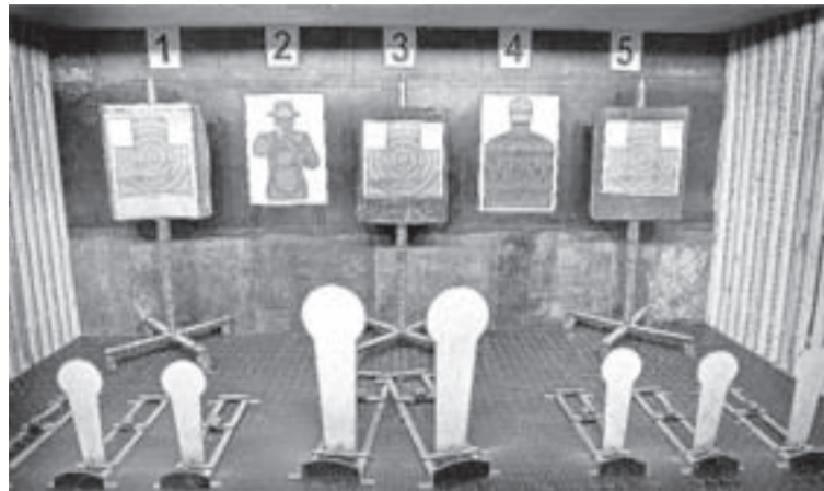
Комплекс полностью соответствует требованиям безопасности.

Уникальный для Сибири стрелковый тир появился в Барнаульском юридическом институте МВД России.