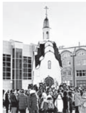
Божественная литургия у часовни Святой Татианы.