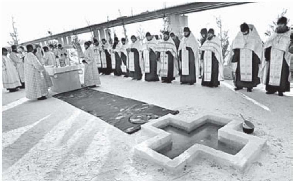
На каждый год на Оби совершается чин водосвятия.

В этом году лед на Оби крепкий, в районе берега он до 60 см толщиной, ближе к середине – 40 см. Но в целях безопасности полиция и МЧС не пускали к проруби сразу много народу. Большинство наблюдало церемонию водосвятия с берега. Чин освящения провел митрополит Барнаульский и Алтайский Сергей вместе с духовенством епархии. По православному канону после