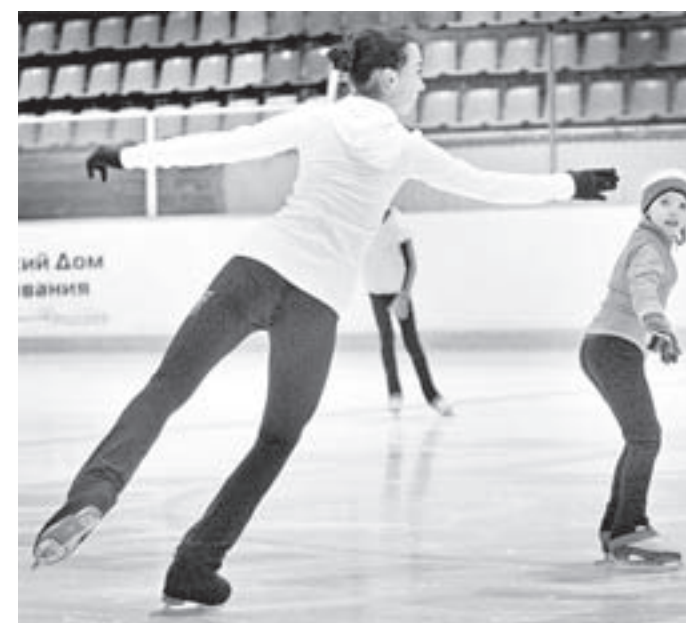
«Делай, как я».

жайшие месяцы будет сдан в эксплуатацию. Также в крайспортуправлении заявляют, что как только на проспекте Сибирском будет достроен крытый каток, у фигуристов появится бесплатный лёд. Но это, скорее всего, произойдёт не раньше 2018 года.