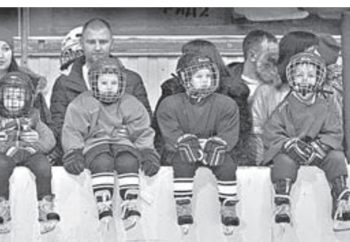
Лёд во Дворце спорта расписан по минутам. Своей очереди дожидаются «галчата» из хоккейной школы «Алтай».

вечером. Кроме того, родители платят в месяц от двух с половиной до трёх тысяч, покупают хорошие коньки, полностью оплачивают и выезды своих детей на сборы и соревнования. Но тот, кто действительно хочет заниматься фигурным катанием, не останавливается перед этими препятствиями.