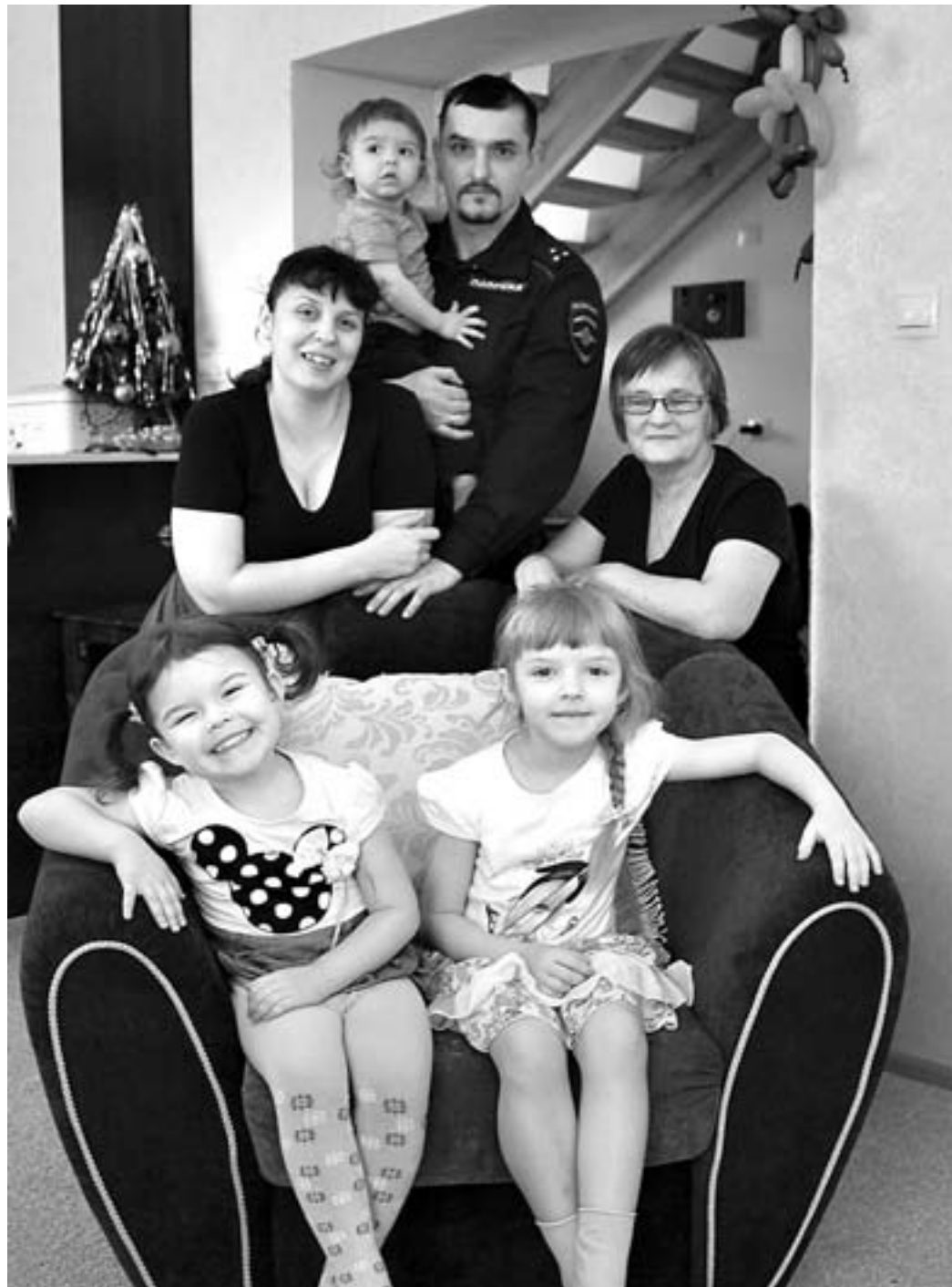
Вся семья в сборе.