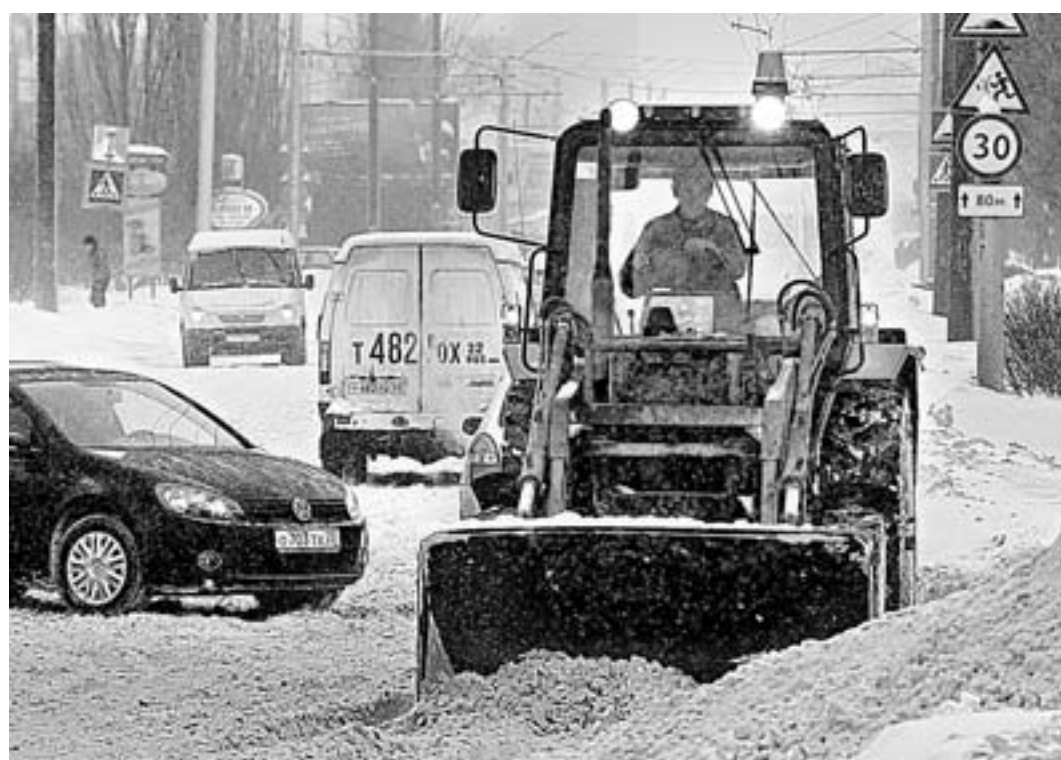
Очистка дорог и внутридворовых территорий — одна из насущных задач, которые решаются зимой.

— Соотношение строится на базовом показателе — средней заработной плате в регионе, — отметил губернатор. — По итогам 2015 года зарплата в регионе в номинальном выражении выросла на 3 с небольшим процента. Темпы инфляции в Алтайском крае несколько ниже, чем в стране и Сибирском федеральном округе. Это очень важно с точки зрения социального самочувствия населения. Ниже темпы инфляции в том числе по группе продовольственных товаров. Продовольственная корзина в Алтайском крае одна из самых дешевых в стране и Сибири. Болезненная сфера — продовольственное обеспечение — достаточным образом защищается целым рядом факторов, среди которых вопросы заработной платы и выплаты социальных пособий, оказание других форм социальной поддержки населению. Мы активно прибегаем к помощи