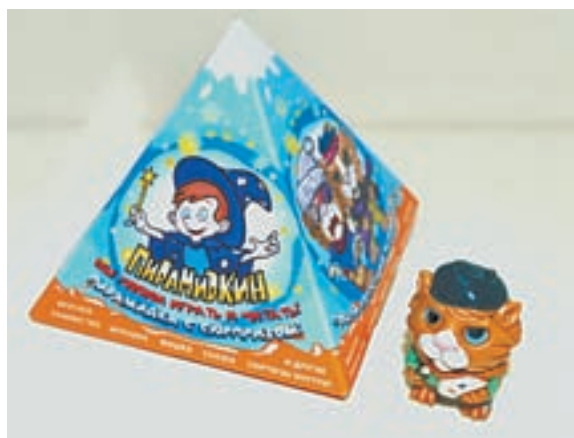
Наш ответ «Киндеру».

Лакомство называется «Пирамидкин». Если в «Киндер-сюрпризе» игрушка спрятана в яйце, то здесь сюрприз в сладкой пирамиде. Необычный продукт стала выпускать одна фирма. Как рассказали «Алтайской правде» производители, шоколадные яйца сегодня выпускают многие компании, а пирамидки – барнаульское изобретение, свой продукт компания запатентовала. В отличие от яйца в пирамиде ребенок найдет с игрушкой еще и мини-книжку со сказкой.