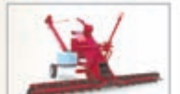
Пропризатор зерна РСМ-29 ширина зазора 4 м, производительность до 20 т/ч