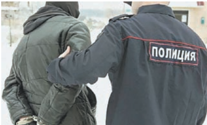
С полицейскими нужно беседовать спокойно.

Житель Усть-Калманского района сначала поскандальил с женой, потом напал на защитников правопорядка.