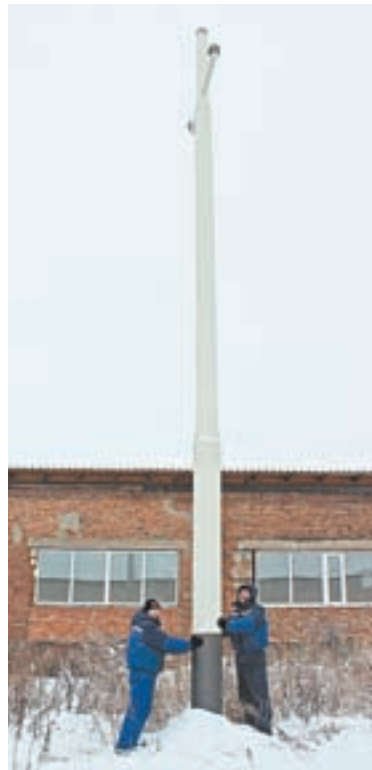
Те самые стеклопластиковые опоры ЛЭП от фирмы «Алтик».

тровым, и гололедным нагрузкам и зарекомендовали себя хорошо. Но опоры не получили широкого распространения, потому что дороже металлических. Сейчас предприятие разработало оборудование для массового производства опор, с помощью которого надеется уменьшить их себестоимость.