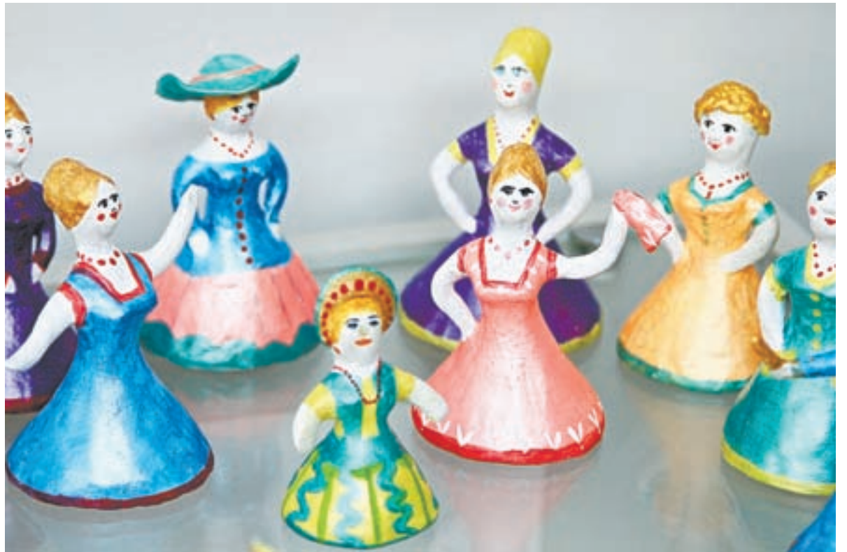
Туристы увозят с Алтая сувениры, изготовленные руками мастерицы.

Ничего не происходит случайно. С этим мастерица не спорит и давно уже научилась читать знаки судьбы, следовать им. Ее роман с глиной длится всю жизнь, с са-