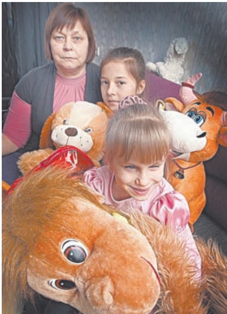
Мягкие подарки для девочек.