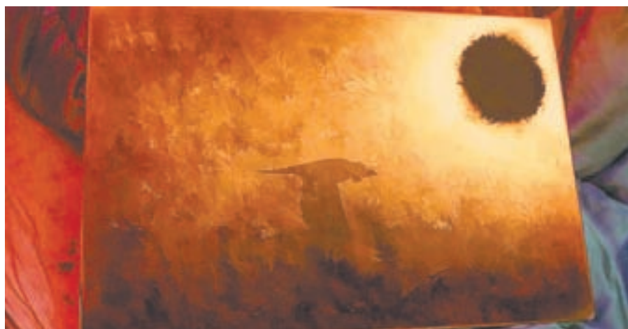
Фильм не об искусстве, хотя ему и уделено много внимания.

В минувшее воскресенье на «ТНТ» состоялась телевизионная премьера фильма «Да и да» режиссера Валерии Гай Германики. У фильма оказалась непростая судьба, да и сам он для зрителя весьма непросто. Мнения профессиональных кинокритиков по поводу второй полнометражной картины режиссера радикально разделились, что тоже происходит не так уж часто.