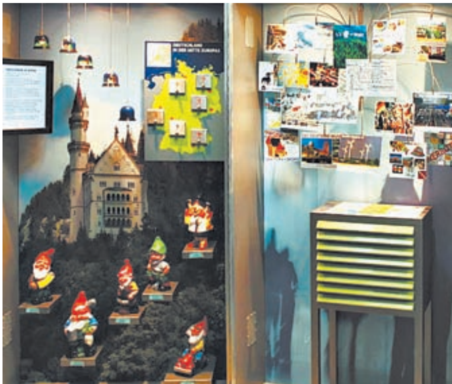
Выставка смотрится эффектно.

В Барнауле в Краевом дворце молодежи начала работать необычная выставка – «Германия в чемодане».