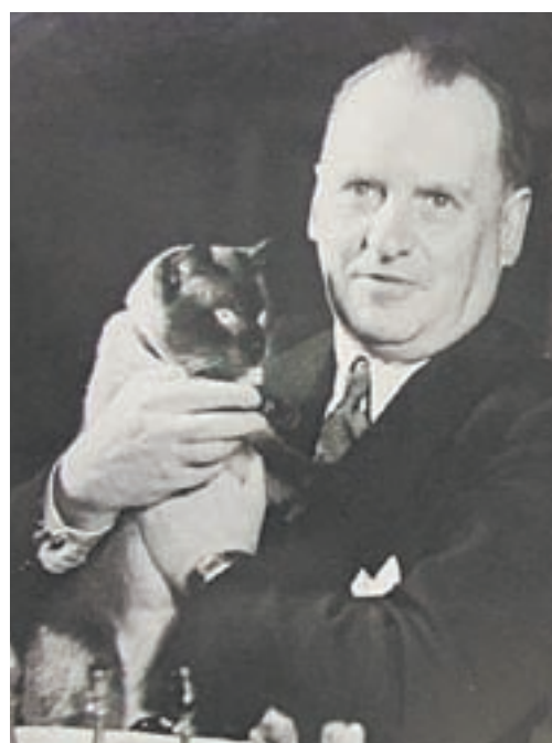
Фотоподсказка к одному из вопросов викторины.