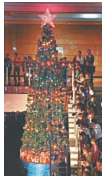
Губернаторские елки в театре драмы продлятся до 30 декабря.