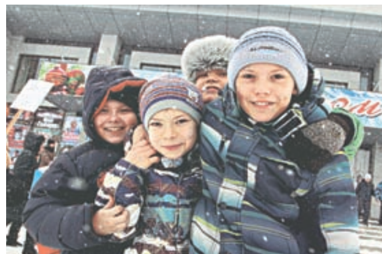
16 новогодних представлений в театре драмы посетят более 12 тысяч школьников.