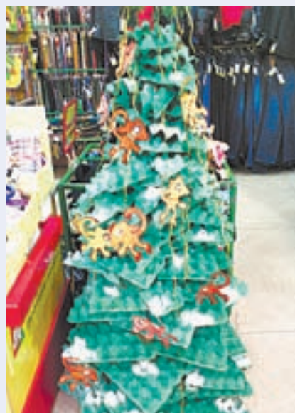
Ёлку можно сделать из чего угодно.

Мы созвонились с магазином и узнали, что идея сделать такую елку пришла случайно. «Хотелось создать ново-