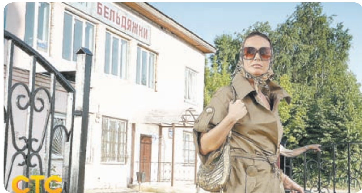
01.45 Х.ф. «О ЧЕМ ГОВОРЯТ МУЖЧИНЫ» (16+)

06.00, 06.30, 07.00, 07.30, 08.00, 08.30, 09.00, 09.30, 13.40, 18.15, 22.50 Интервью дня (12+) 06.10, 07.10, 07.40, 08.10, 08.40, 09.10, 09.40 Утренний канал (12+) 06.35, 13.00, 17.30, 22.10 Здесь была Маша (12+) 10.00 Х.ф. «Снежная сказка» (12+) 11.15 М.ф. «Гнездо дракона» (12+) 13.25 Один день (12+) 13.50 Новогодний концерт (16+) 16.00 Х.ф. «Везет же людям» (16+) 18.00 Один день (12+) 18.30 Новый год на «Первом» (16+) 20.40 Х.ф. «Моя мама - Снегурочка!» (16+) 22.35 Один день (12+) 23.00 Фестиваль «Автордио» «Дискотека 80-х» (16+)