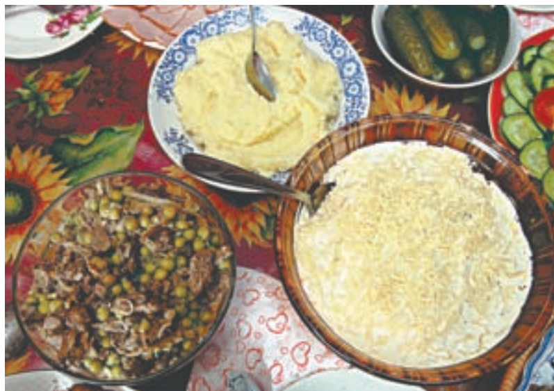
Готовьте, женщины, с любовью к своей семье.