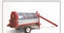
Очиститель зерна мобильный ОЗМ-29 диаметр барабана 122 см, производительность до 20 т/ч