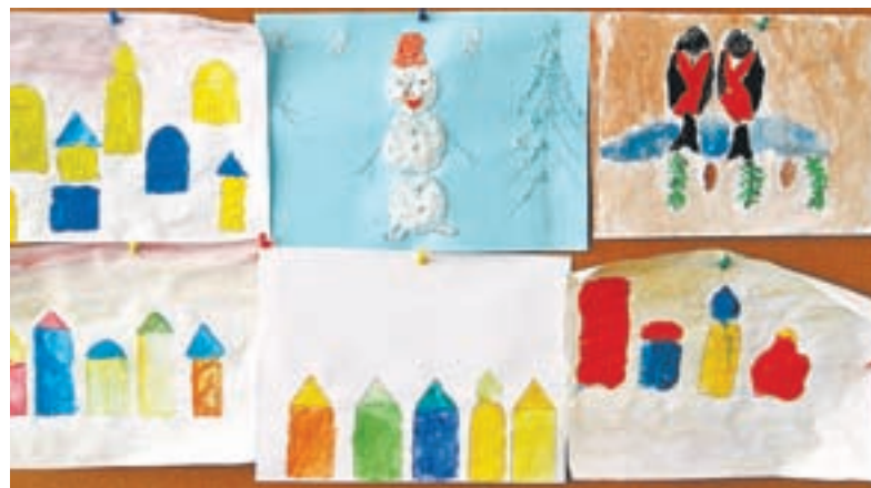
Рисунки на память от подопечных.

ют опытные врачи, педагоги, приглядывают воспитатели, кормят шесть раз в день. В кабинетах светло, много игрушек, стоят мягкие диваны. Ребят водят в библиотеку, музей, на различные экскурсии. Другими словами, малышки и девочки являются активными участниками социального и культурного пространства города, – говорит Алёна Егошина.