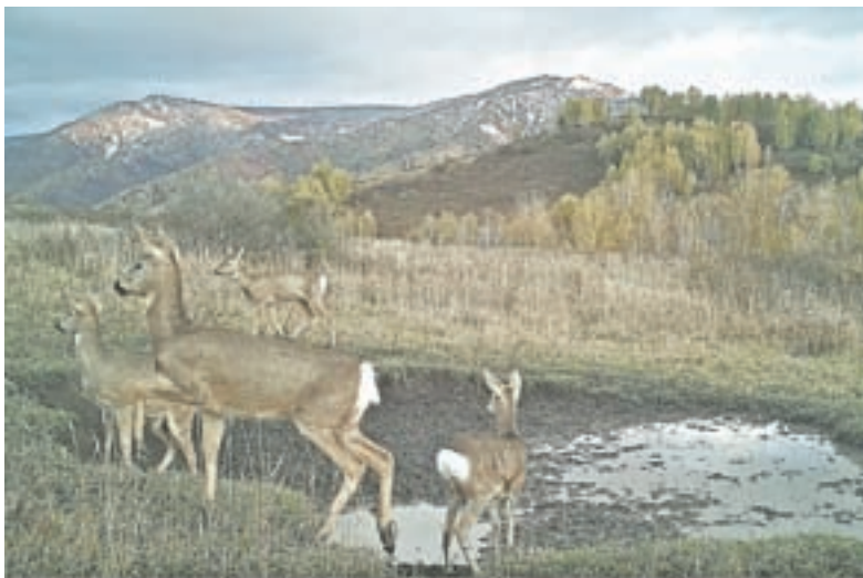
А эти красавицы на фотоловушку внимания не обращают.

вой целью была фиксация зверя для того, чтобы посмотреть, кто в заповеднике живет.