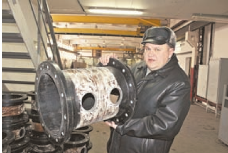
Преимущество стеклопластиковых изделий в том, что они гораздо легче стальных и не корродируют.