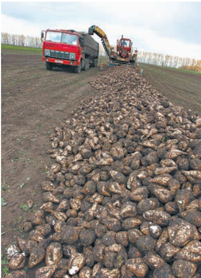
Алтайские аграрии в этом году собрали рекордный урожай свеклы.

Функционирует медицинский кластер в нагорной части Барнаула. Помимо перинатального центра в ближайшем будущем здесь планируется создать учреждения для реабилитации больных в рамках программ государственно-частного партнерства. В свое время такой принцип был реализован при создании центра гемодиализа при краевой клинической больнице совместно с немецкой компанией ООО «Б.Браун Авитум Руссланд». Сегодня в краевой клинике проводятся операции по трансплантации почек. А ведь еще десять лет назад люди не имели возможно-