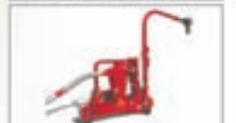
Вакуумный пересушитель зерна ПЗВ-70 высота корпуса 1,7 м, производительность до 70 т/ч

Торговая компания «Европа» официальный дилер ООО «КЗ «Ростсельмаш» г. Барнаул, ул. Взлетная, 192 тел./факс: 8(3852) 500-533 www.tk-evropa.ru E-mail: evropa55@inbox.ru