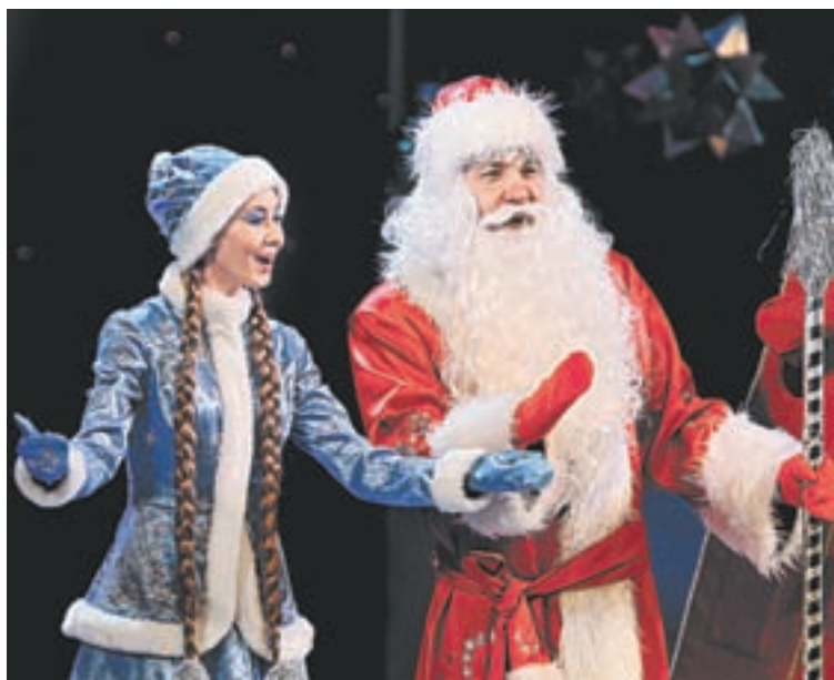
Дед Мороз и Снегурочка в спектакле тоже появятся.