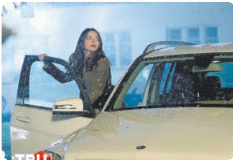
18.45 Х.ф. «С НОВЫМ ГОДОМ, МАМЫ!» (6+)

06.30 Домашняя кухня (16+) 07.00 Поздравь своих домашних (0+) 07.25, 18.25, 00.25 Гороскоп «Будь готов!» (0+) 07.28 Погода в Барнауле (0+) 07.30 Х.ф. «Синьор Робинзон» (16+) 09.35 Х.ф. «Если наступит завтра» (16+) 15.45 Х.ф. «Завтрак у Тиффани» (16+) 18.00 Поздравь своих домашних (0+) 18.28 Погода в Барнауле (0+) 18.30 Поздравь своих домашних (0+) 19.00 Х.ф. «Невеста с заправки» (16+) 21.00 Х.ф. «Мой парень - ангел» (16+) 22.55 Док. сериал «2016: предсказания» (16+)