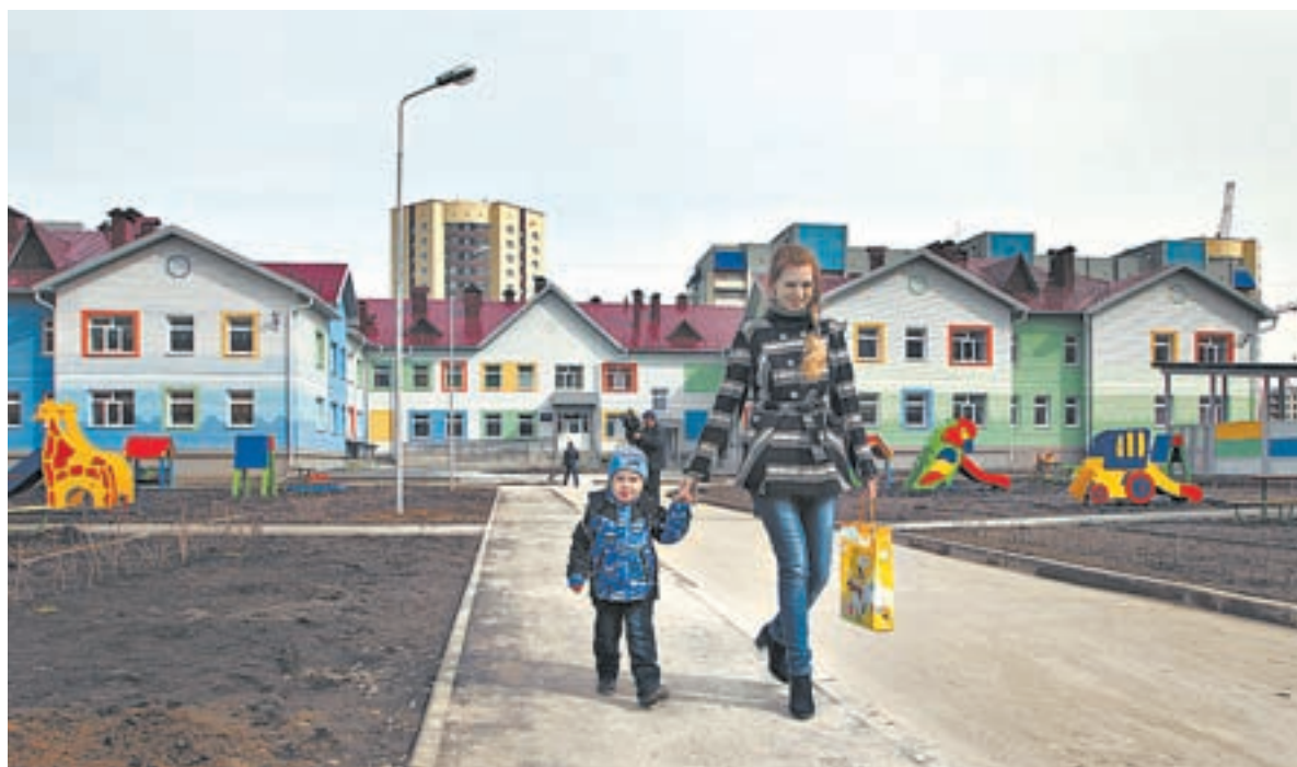
В 2015 году в крае продолжились строительство и реконструкция детских садов и школ.