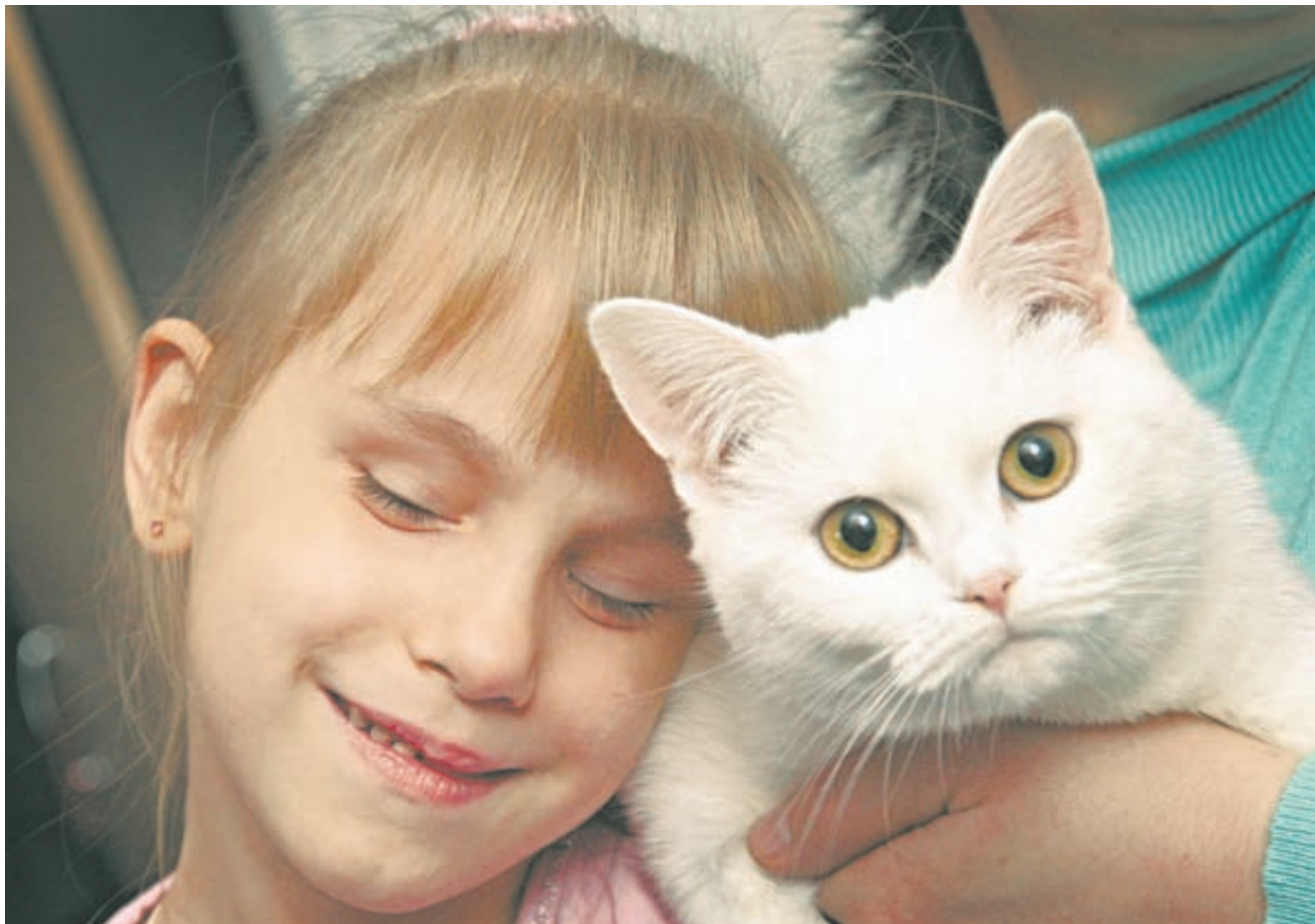
С кошкой Ньюшей хорошо и спокойно.