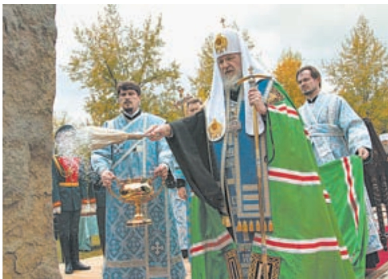
Визит Патриарха стал знаковым событием для нашего региона.

– Туристический поток в регион растет постоянно. Однако наибольшую популярность сегодня получают праздники и мероприятия событийного туризма. Например, «Алтайская зимовка». Этот праздник привлекает все больше гостей со всей России и из-за рубежа.