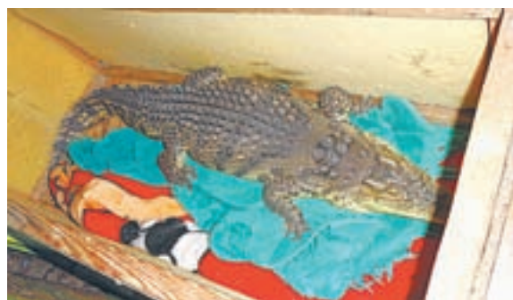
Крокодил паспорт не предъявил...

Сотрудники Пограничного управления ФСБ России по Алтайскому краю и краевого управления Россельхознадзора задержали змею и крокодила с паспортами кошки и собаки.