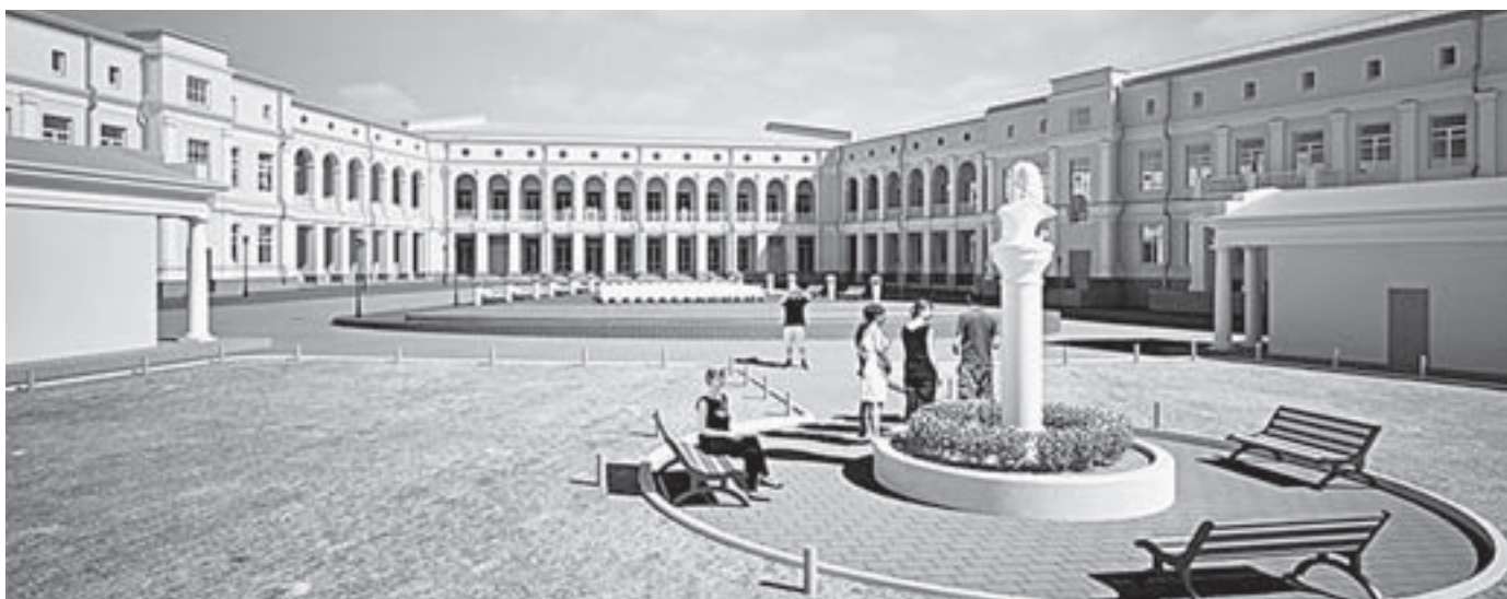
Проект Художественного музея Барнаула.

— Строительство электростанции в Солтонском районе предусмотрено Генеральной схемой развития генерации, — сказал губернатор. — Инвестиции на возведение станции на Мунайском месторождении составляют порядка 100 млрд рублей. Это очень серьезные средства. Интерес инвесторов несколько стих в силу очевидных причин. Но по мере восстановления экономического роста, думаю, он будет восстановлен.