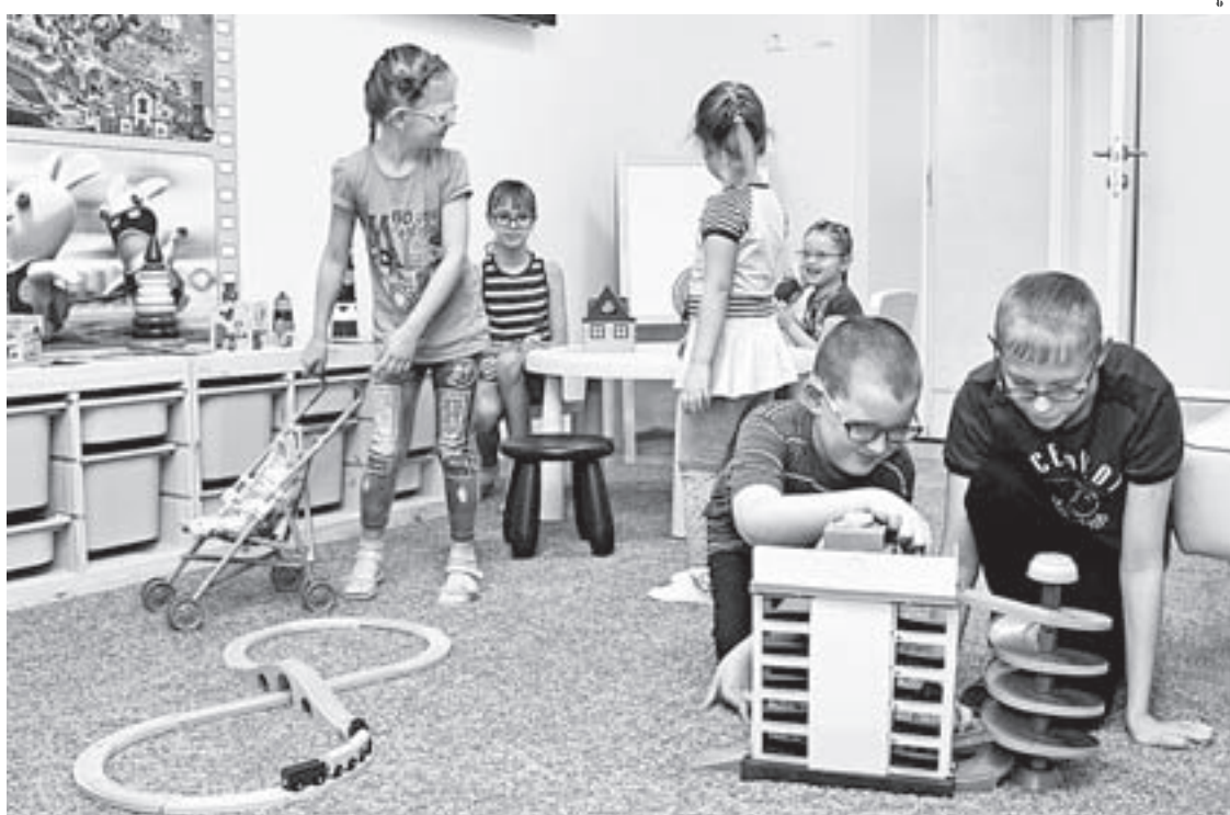
Здесь каждый ребенок найдёт себе занятие по душе.