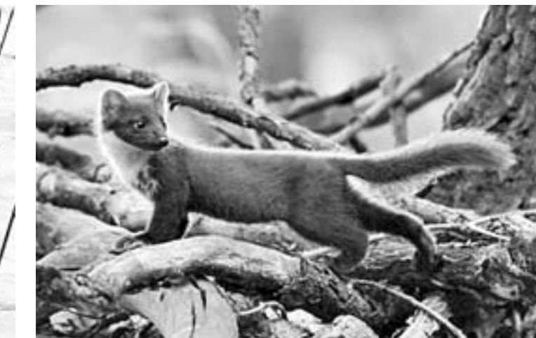
Гиблая и грациозная куница.