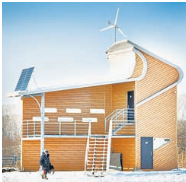
На вышке установили ветрогенератор и солнечную батарею.