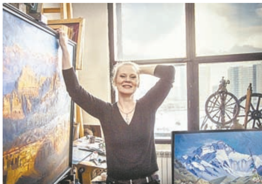
Работы автора передают настроение его героев.