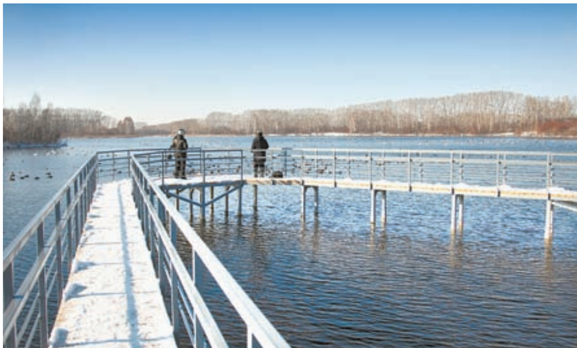
На этом мостке скоро установят турникет.