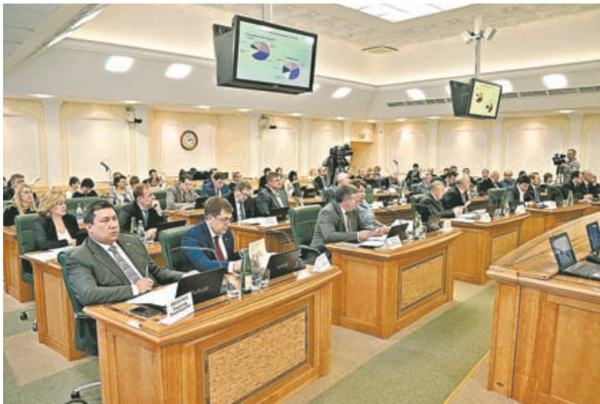
Предложения нашего региона обсуждались на заседаниях комитетов Совета Федерации.

Спикер АКЗС попросил поддержать инициативу о развитии индустрии здорового питания, в том числе детского. Наш край готов стать пилотным регионом в реализации такой программы. Это предложение получило одобрение Совета Федерации.