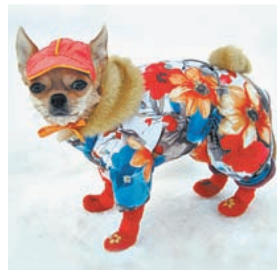
Эти валенки на правый и левый не различаются.

Кстати, стоит комплект валенок для собак от 1000 рублей. В магазине рассказывают, что необычную собачью обувь уже покупают, а одна женщина даже интересовалась, а будут ли галоши для этих валенок, чтобы пес в них мог и весной ходить.