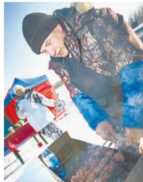
На свежем воздухе шашлыки хороши.