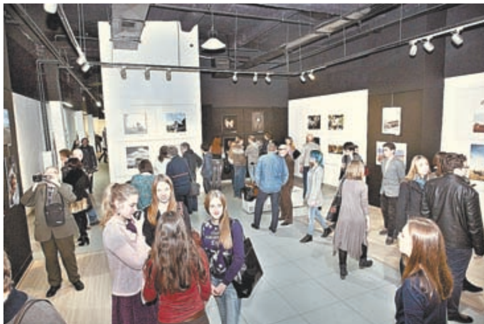
Среди посетителей выставки много молодёжи.