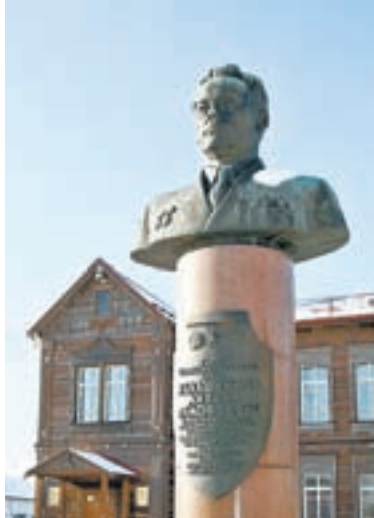
Мемориальный музей М.Т. Калашникова работает в Курье уже два года.

чертежей и выпуске испытательного образца.