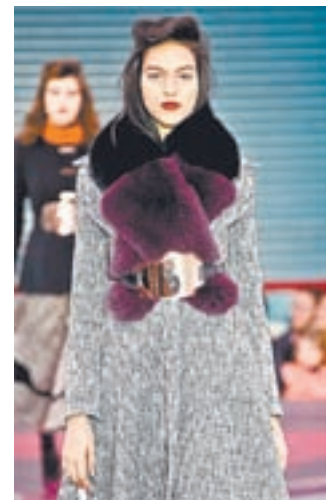
Свободное элегантное пальто для женщин любого возраста.

ляется образчиком элегантности. Скажем, из одного цельного куска ткани можно сделать изящную туннику, модную рубашку. Опять же всё упирается в размеры, расчеты индивидуальных пропорций, то есть конструирование.