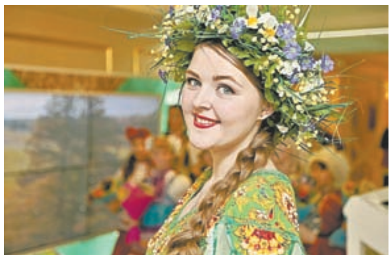
Жители края рады гостям.