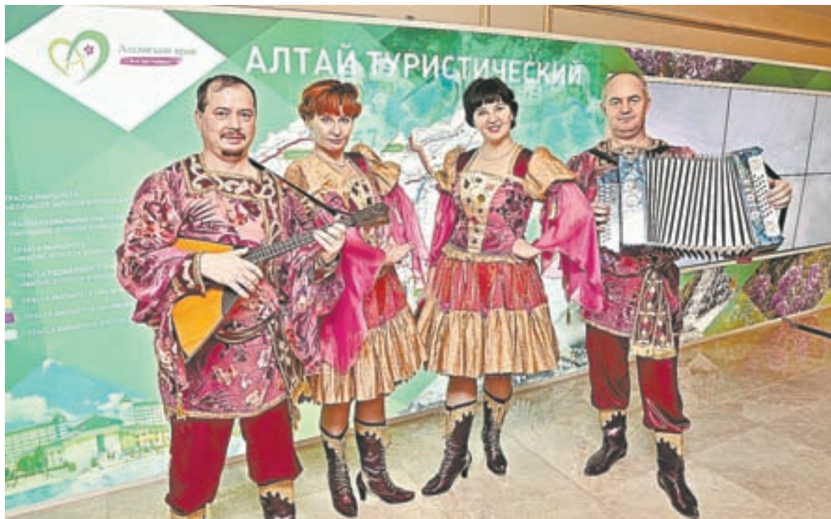
Творческие коллективы украсили выставочную экспозицию региона.