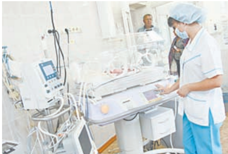
Технологии вынашивания позволяют крохам с низкой массой тела избежать проблем со здоровьем в будущем.

– Да, в перинатальном центре постоянно происходит что-то чудесное. Малыш поступает к нам с экстремально низкой массой тела, и мы тревожимся, выхаживаем его вместе с мамочкой, всем коллективом, который давно уже стал профессиональной семьей. Когда он набирает вес, округляются щечки, кроха впервые фиксирует взгляд и ты понимаешь, что он тебя видит, это