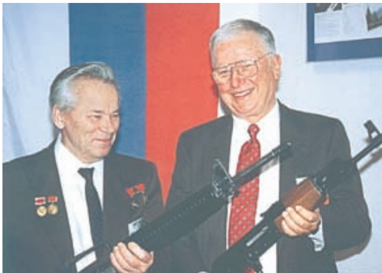
Михаил Калашников и Юджин Стоунер, два друга, два великих оружейника.

В армию его призвали в 1938 году танкистом в Киевский особый военный округ (Стрый Львовской области). В характеристике младшего сержанта Калашникова, выданной в/ч в марте 1941 года, сказано: «Изобрел прибор, показывающий работу мотора в часах... тем самым облегчил правильность учета моточасов...» В конце документа – приписка, обязательная по тем временам: «...предан делу партии Ленина – Сталина и социалистической родине». Документ от 24 июня 1941 года, подтверждающий ценность разработки, пришел из архива Ленинградского завода № 147 им. Ворошилова. «Счетчик моточасов», придуманный Михаилом, был более простым и удобным, нежели существующие аналоги. Завод сообщал об обработке