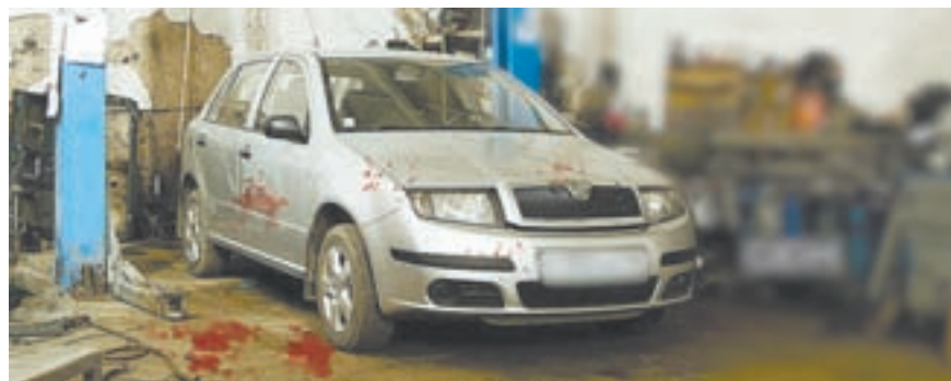
В ходе разборок в гараже остались следы.

А дальше последовал уже сам процесс «воспитания». Участковый и глава администрации так приложили к этому руки и ноги, что кровью ока-