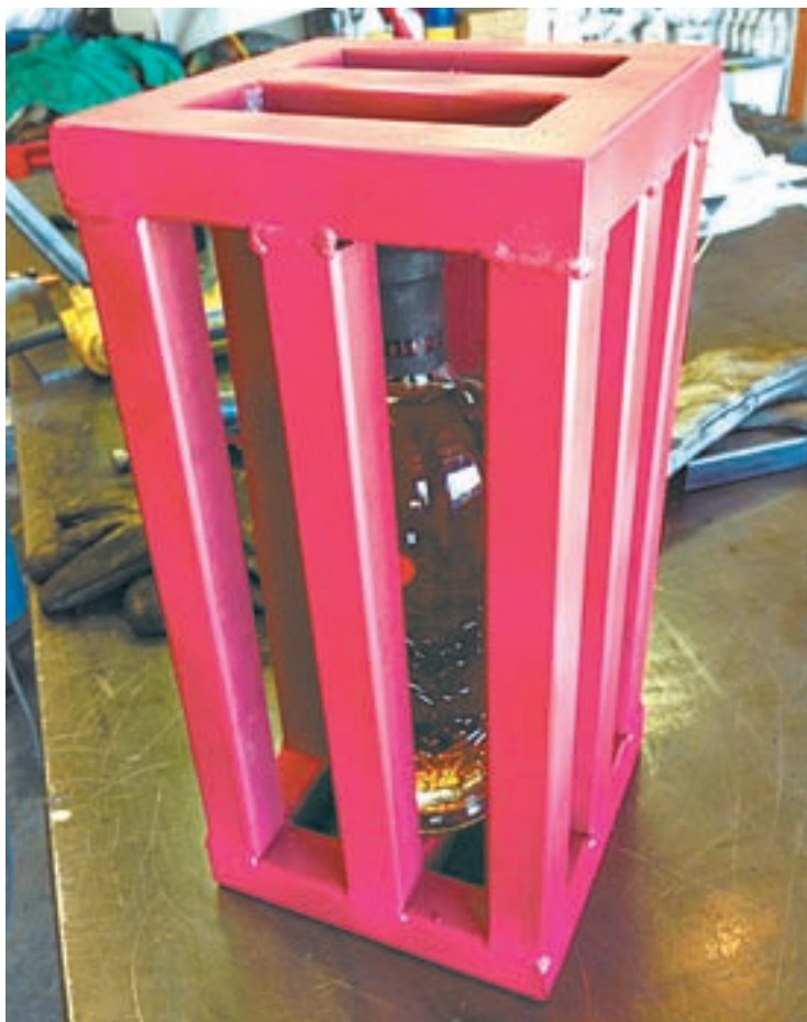
Чтобы продегустировать вино, нужно до него еще добраться.

В Барнауле появилась необычная услуга – железная упаковка подарков.