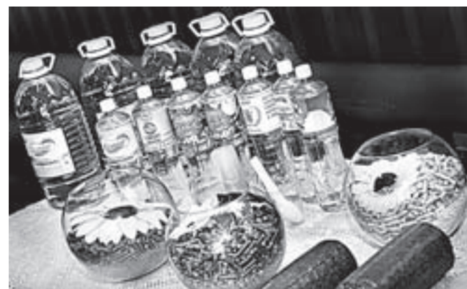
Растительное масло с Алтай поставляется даже в страны Азии и Африки по Всемирной продовольственной программе ООН.