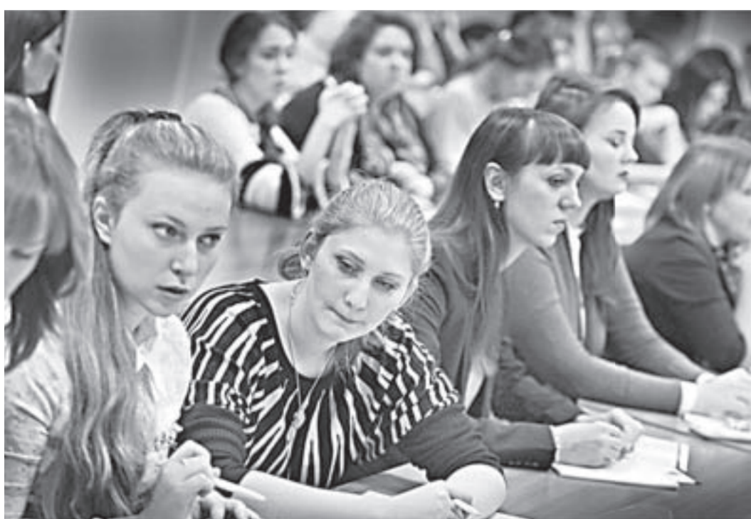
Конференция собрала молодых педагогов со всего края.