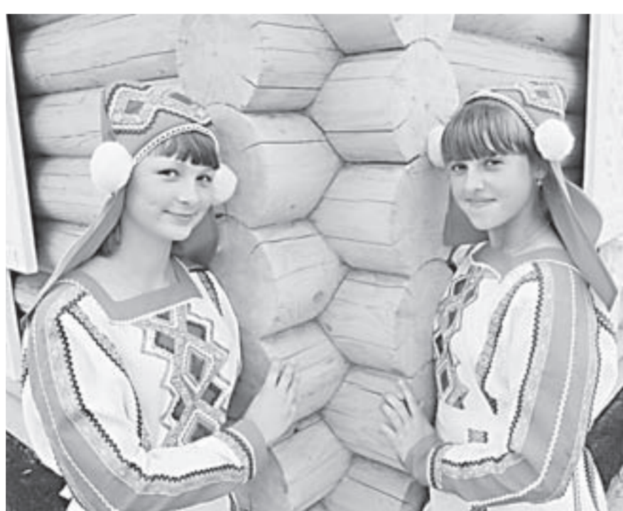
Юные «эрзяночки» в национальных костюмах.

Центр мордовской культуры с национальным подворьем и музеем, открытый ровно три года назад в селе Борисово Залесовского района, становится всё популярнее у местных жителей и заезжих гостей.