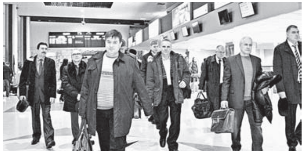
На форум «Единой России» отправилась представительная делегация из Алтайского края.

коррупционное законодательство и предварительное партийное голосование перед выборами в следующем году. Согласно новым правилам на секретарей местных отделений будет возложена большая ответственность за проведение этой процедуры, она должна стать максимально конкурентной и открытой. Форум наполнит новым со-