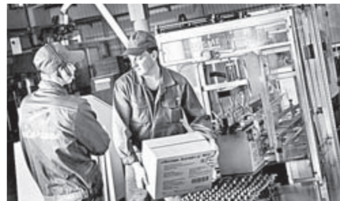
«АгроСиб-Раздолье» способно производить 66 тысяч тонн рафинированного дезодорированного масла в год и 68 тысяч тонн шрота.

С современных заводских площадей полномочный представитель президента отправился на строящуюся неподалеку не менее современную спортивную площадку. Крытый ледовый спорткомплекс вскоре откроет свои двери на улице Жасминной. Эксплозивный проект реализуется в форма-