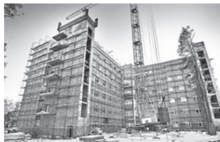
Строительство перинатального центра идет по утвержденному графику.

В апреле планируется завершить работы на втором блоке. В него входит зал для гимнастики и хореографических занятий, конференц-зал, фитнес-центр с кардиозоной и тренажерным залом, медицинский блок, сауна с небольшим бассейном, массажный кабинет и многое другое. Еще одна очередь ледового дворца – это ледовая площадка и гостиница, рассчитанная на три хоккейные команды, полноразмерный зал для игры в волейбол и баскетбол. Воздушный переход соединит здания огромного спортивного комплекса.