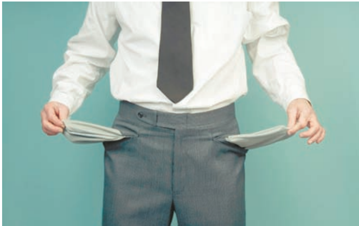
Если у банкрота не хватит средств, чтобы рассчитаться с кредиторами, то суд простит ему остальной долг.

Если жилье является совместным нажитым, то взыскание обращается исключительно на долю должника. При этом жилье потребует продать, вырученные за долю заемщика средства будут изъяты, а оставшиеся от реализации средства получают другие собственники. При наличии детей к процессу банкротства будут привлечены органы опеки, задача которых защитить право на жилье несовершеннолетних. Если банкротом признают индивидуального предпринимателя, то его свидетельство о