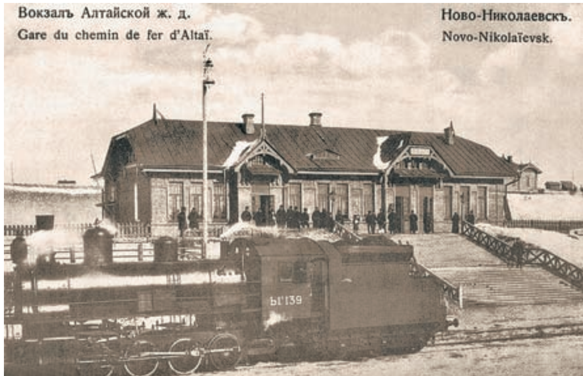
Вот такие паровозы были первыми на железной дороге.