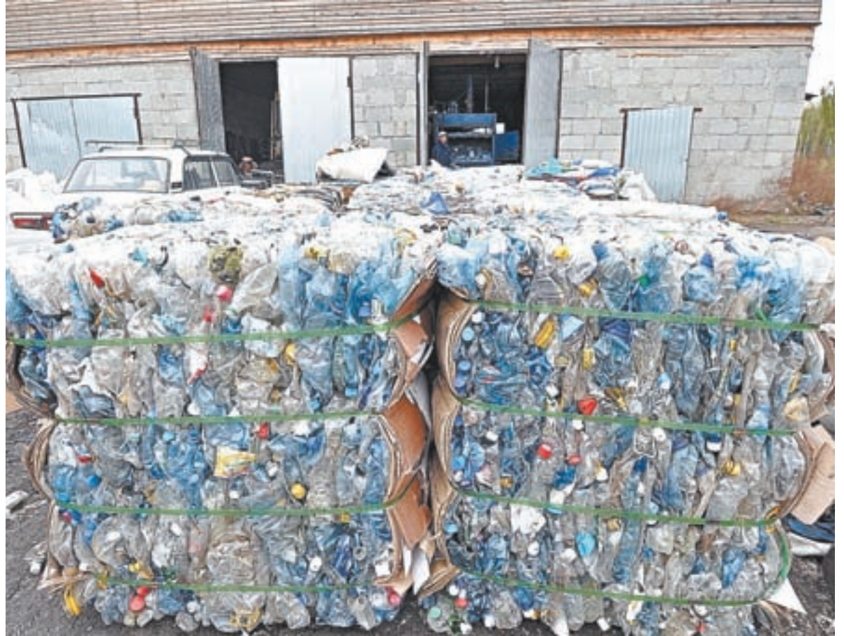
Самый прибыльный мусор – пластиковые бутылки.

Сегодня коллектив сформирован. На предприятии трудятся водители, бухгалтер, диспетчер, семь человек задействованы на