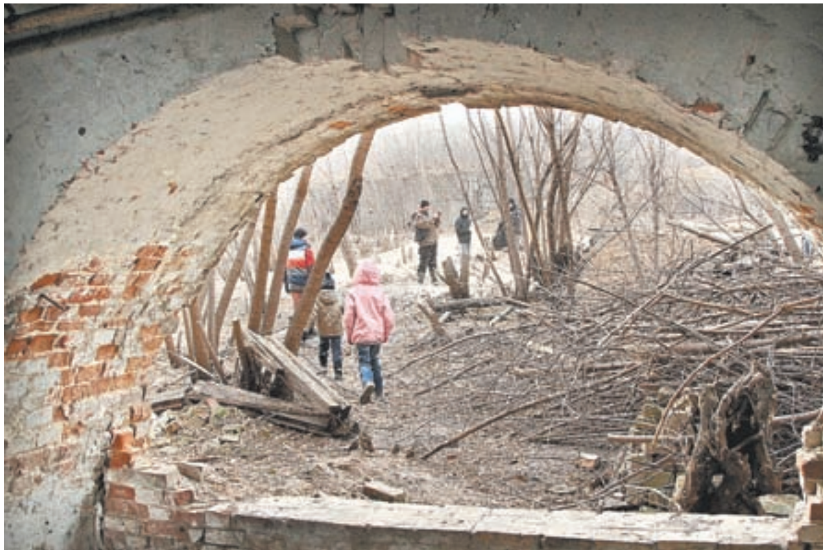
На территории бывшего завода работы хватит всем.