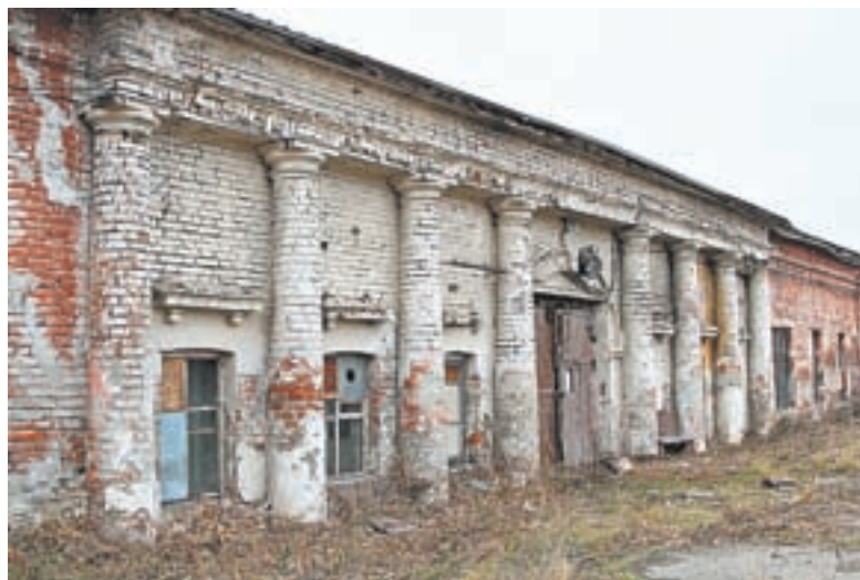
В прошлом крупнейшее промышленное предприятие Алтая нуждается в реконструкции.

Неравнодушные горожане продолжают приводить в порядок территорию бывшего Барнаульского сереброплавильного завода.