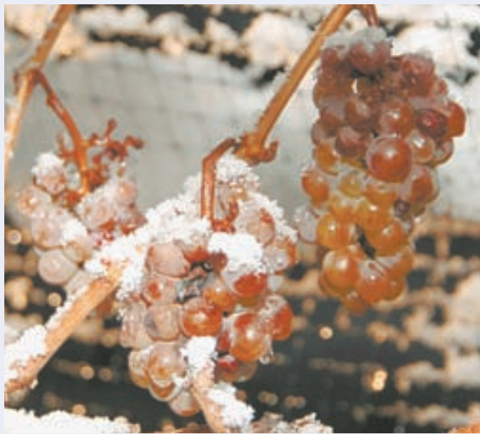
От мороза ягода приобретает особый вкус.

На Алтае взялись за разработку рецепта ледяного вина.