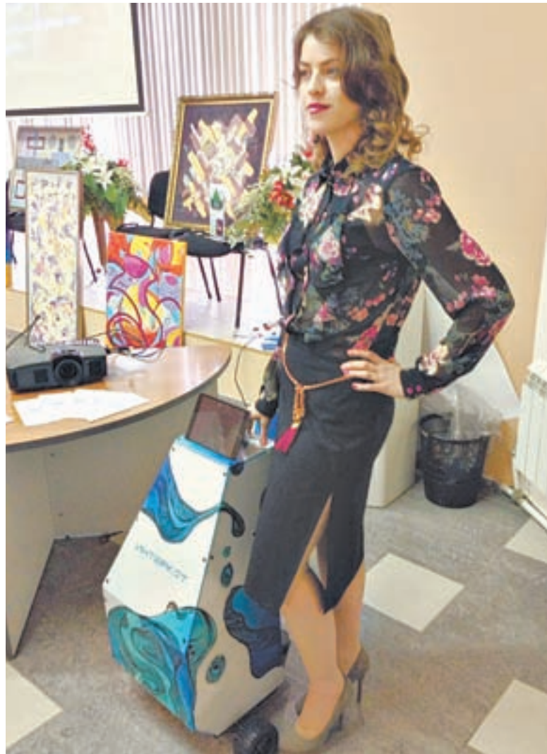
Виртуальный промоутер готов заменить живого человека. Даже красивая девушка в рекламе скоро будет не нужна.