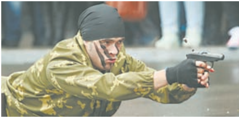
«Группа специального назначения «Вымпел» (АлтГТУ) подготовила показательные выступления для гостей.

Алтайский государственный технический университет – единственный вуз в крае с военной кафедрой. На сегодняшний день здесь обучаются семьсот человек. Для многих будущих офицеров и сержантов запаса это путёвка в армейскую жизнь.