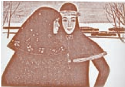
Студенческий эскиз Вячеслава Зайцева. Этот стиль снова в моде.

На пике популярности классическая обувь, например, сапоги на невысоком устойчивом каблучке. Сумки радуют практичностью. Они объемные, лаконичные, из качественных материалов классических оттенков.