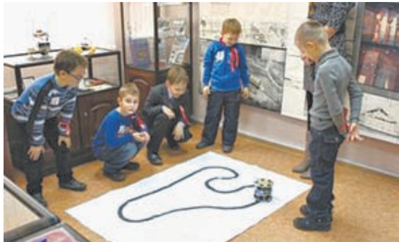
Кружок юных конструкторов.

Мы привыкли, что робот – это персонаж из фильмов, и даже в XXI веке трудно представить, что ты пойдешь в магазин и встретишь подобие киборга. А вот алтайские изобретатели думают по-другому.