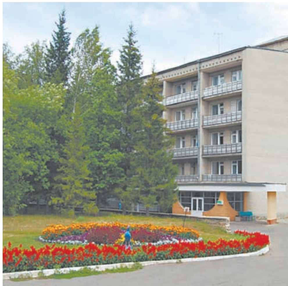
Комфортные корпуса санатория ждут отдыхающих.

Большие преобразования материально-технической и лечебно-диагностической базы произошли с 2000 по 2006 годы (директор Бочаров Г.П.). Построены лечебно-диагностический корпус, 4-этажный лечебно-оздоровительный комплекс, теплый переход между корпусами, реконструкция корпуса № 7, конференц-зала, пищеблока, летнего бассейна и парковой территории, открыта грязелечебница на 18 мест и спелеолечебница на 15 мест. Открыты центры гинекологического, вертеброневрологического, по лечению профбольных, реабилитации сосудистых больных на 90 коек, отделения долечивания после инсульта, гастроэнтерологическое, диагностическое (с УЗИ и эндоскопией), кабинет андрологии, введены новейшие технологии (озонотерапия, аэрокриотерапия, колоногидротерапия), организован детский оздоровительный лагерь на 70 мест. Проведена компьютеризация рабочих мест персонала санатория, перевод на газ котельной, замена водопроводных и инженерных сетей.