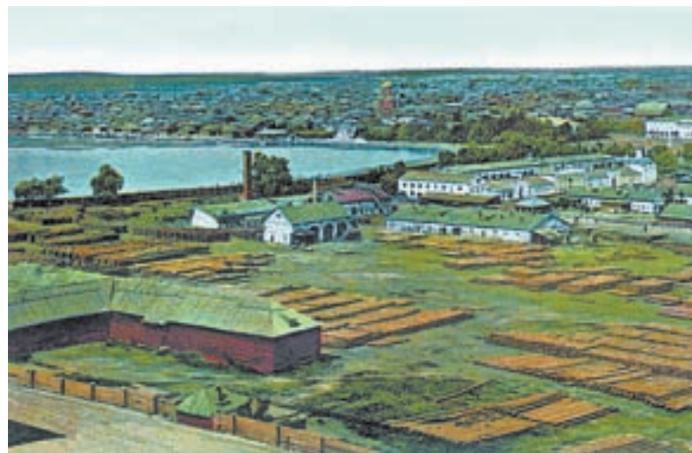
«Чугунка» Барнаулу была жизненно необходима.