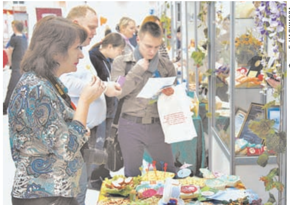
Производители презентовали более 2 тысяч наименований продуктов питания.

В Барнауле завершила свою работу II Торгово-продовольственная биржа деловых контактов «АлтайПродМаркет». Ее итогом стало подписание ряда соглашений о сотрудничестве между алтайскими товаропроизводителями и торговыми сетями. В частности, меморандум о сотрудничестве подписан между торговой сетью «Мария-Ра», Куяганским и Солонешенским маслозаводами, Рубцовским мясокомбинатом и АКХ «Ануйское». Аналогичный документ подписали руководитель ТД «Аникс» и генеральный директор бийской компании «Алтайская ягода».