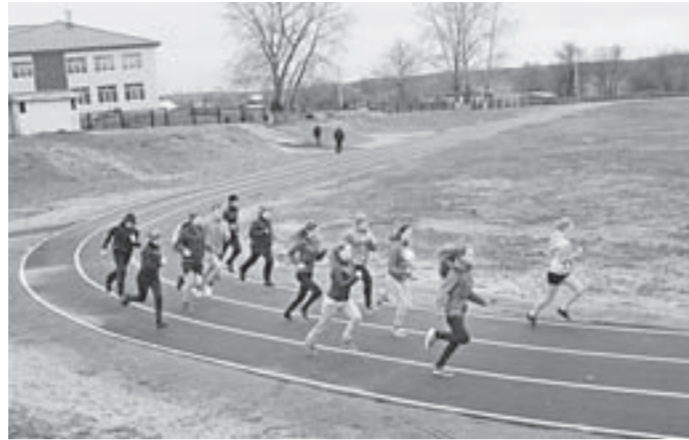
Так выглядит сейчас.

Центр села Вылково Тюменцевского района преобразуется на глазах. Новая детская площадка и реконструированный школьный стадион стали центром притяжения местных ребят и молодежи.