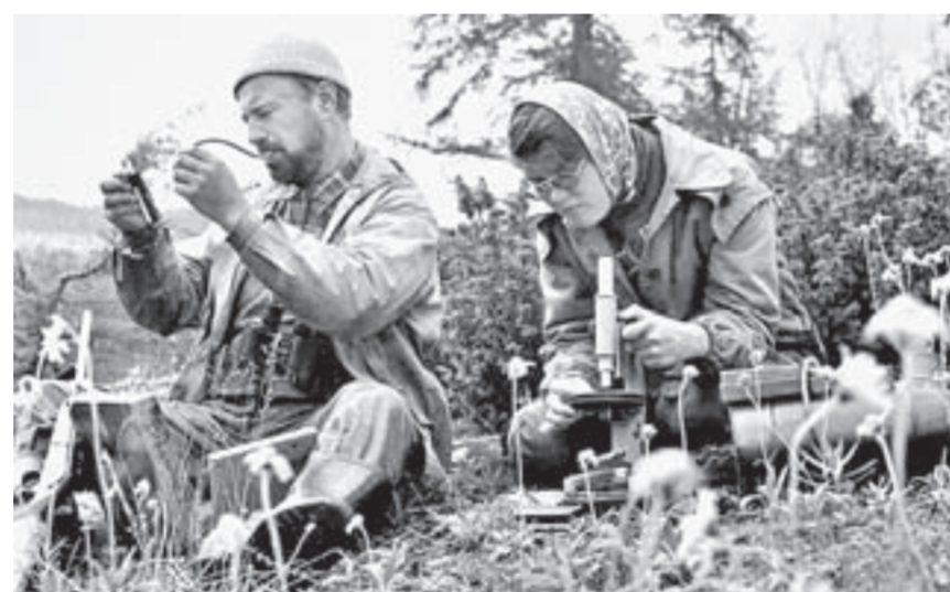
Орнитологи в экспедиции.