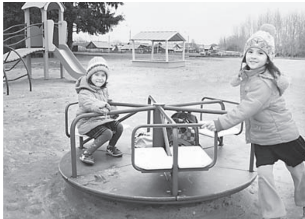
Детская площадка в Вылково - пример для других сёл.

Центр села Вылково Тюменцевского района преобразуется на глазах. Новая детская площадка и реконструированный школьный стадион стали центром притяжения местных ребят и молодежи.