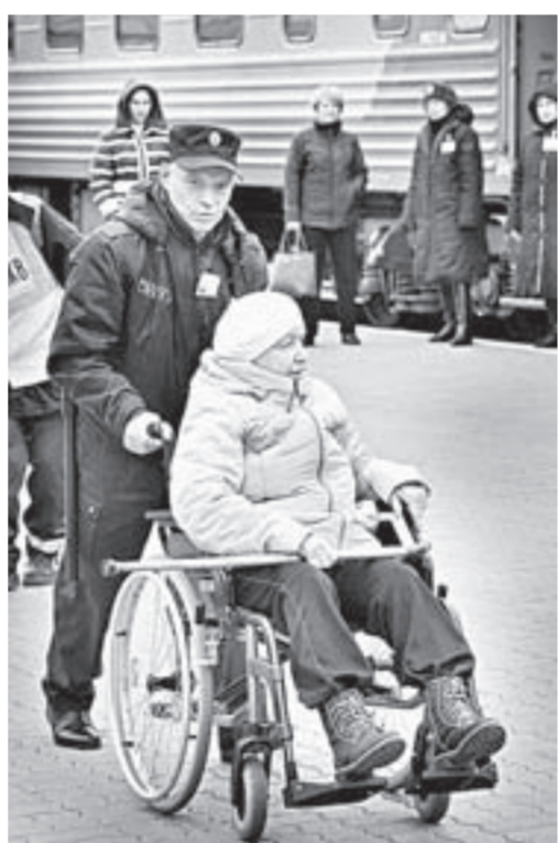
Теперь работники вокзала помогают добраться от поезда к стоянке транспорта людям с ограниченными возможностями.

ции. Так в Барнауле появился Железнодорожный район. По словам начальника железной дороги Руслана Кочелаева, сегодня руководимое им подразделение представляет из себя мощный железнодорожный узел, который день ото дня динамично развивается,