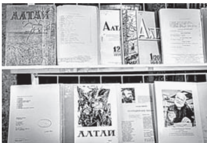
Почти 70-летняя история журнала «Алтай» – на выставке в «Шишковке».