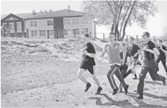
Так выглядел стадион летом...