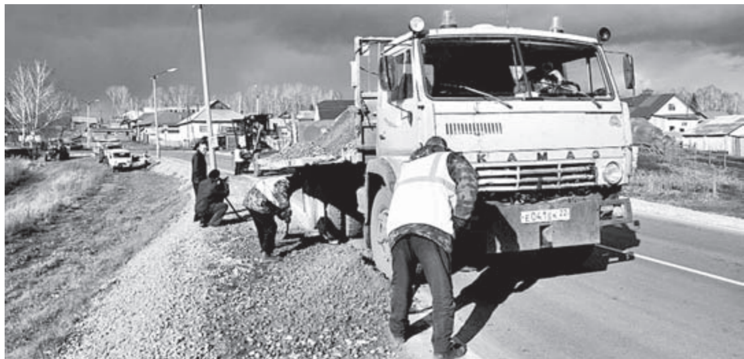
Рабочие ведут отсыпку обочин.