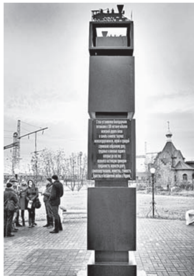
«В память о многих тысячах железнодорожников...»