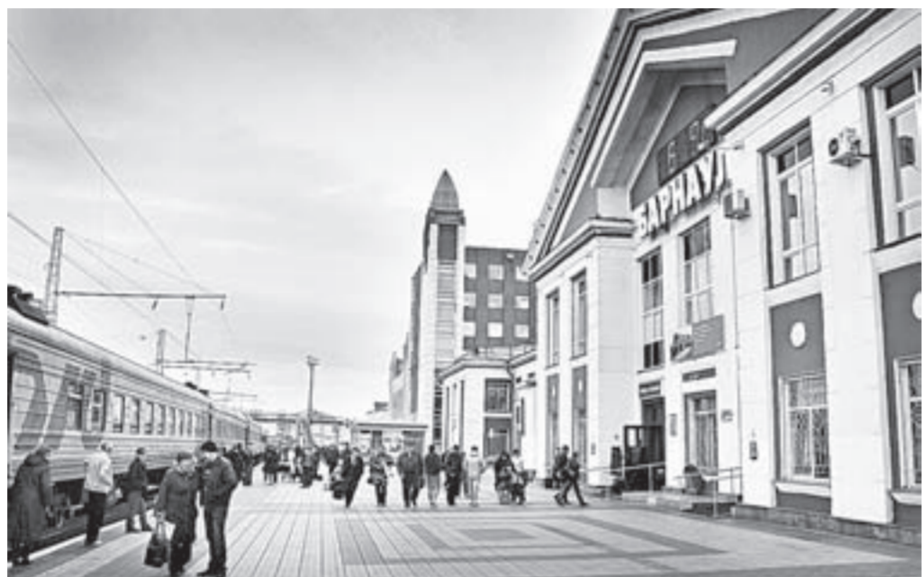
Сто лет станции, а как новенькая.