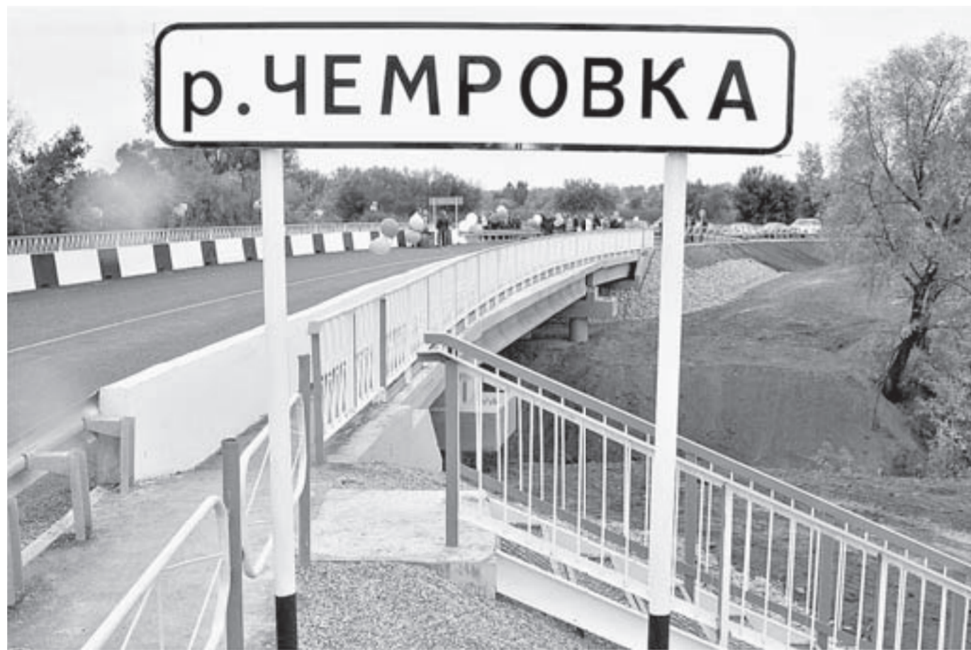
Надежно и красиво.