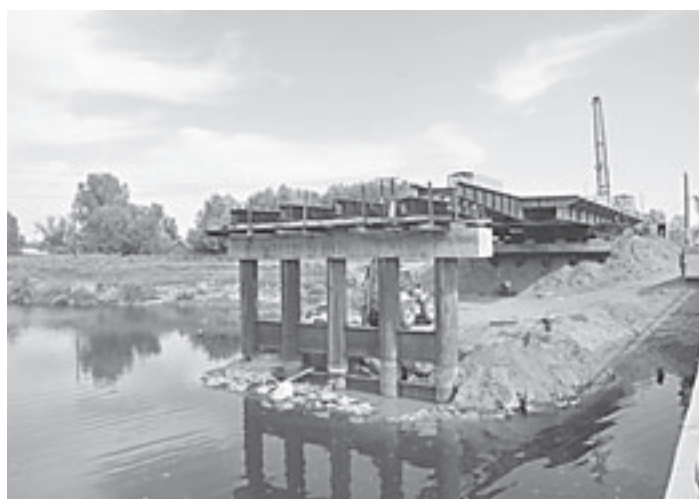
Вид на мост капитальный с моста временного.