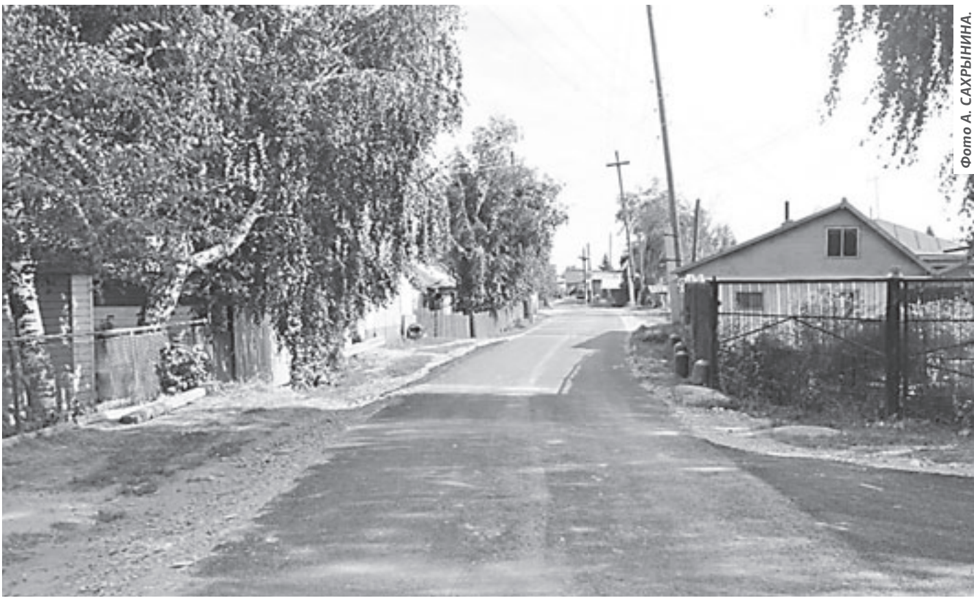
Закатали улицу в асфальт.