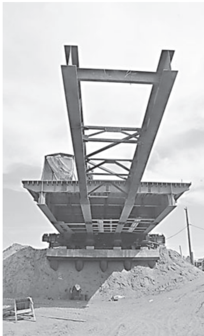
Свяжутся два берега у одной реки.