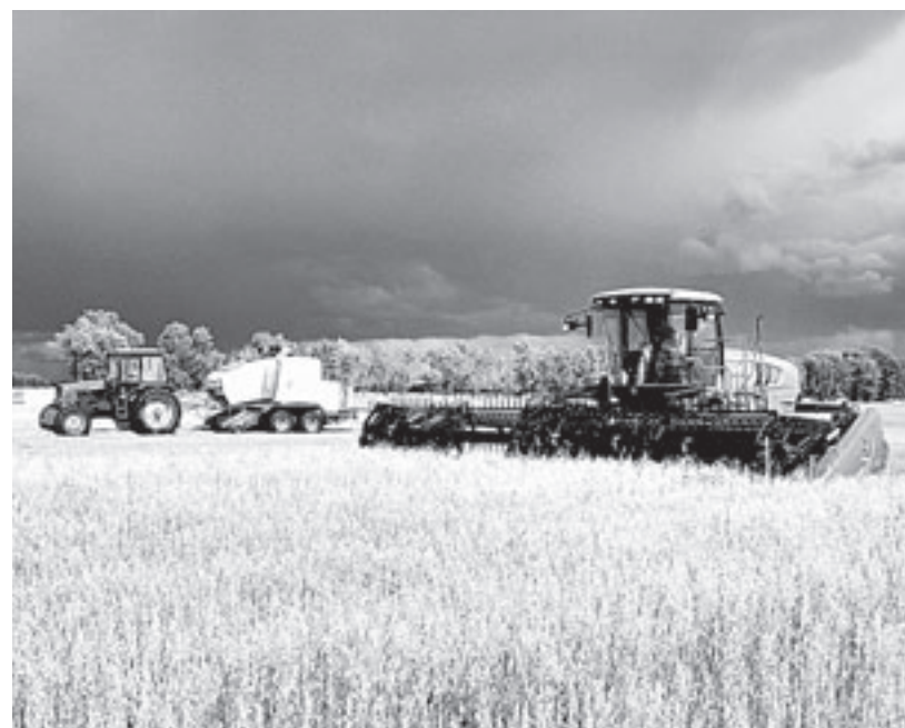
Новый пресс-подборщик «Крона» в работе.