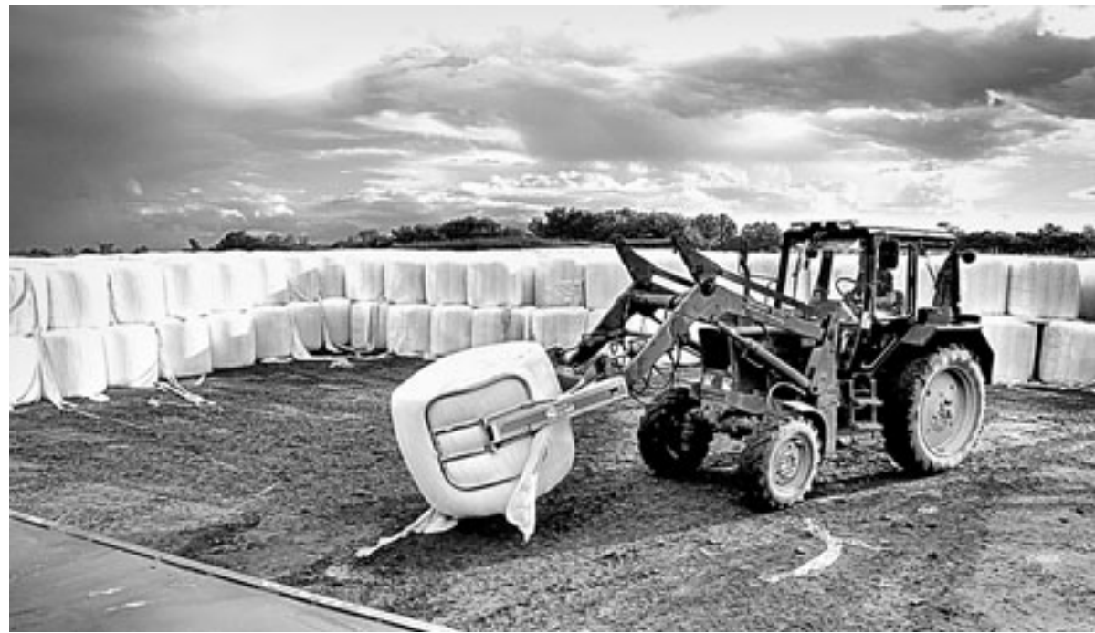
Закладка сенажа на сенобазу.

– Эффективность сенажа, хранящегося в целлофане, мы в полной мере оценили, когда в марте он закончился, – рассказывает самая опытная доярка-передовик Марина Шнайдер. – Суточный надой