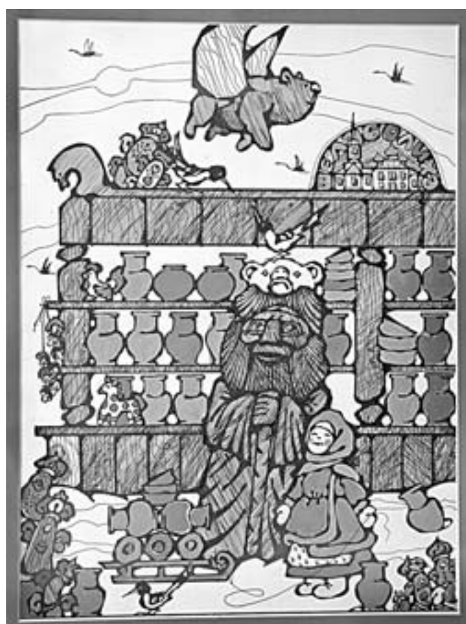
«Лети, лети под облака!..»

– Для меня она не просто живая. В ней есть что-то от матушки, от батюшки, от чего-то божественного... Эта связь описана в моем стихотворении, там есть такие строки: ...Коль придет человек