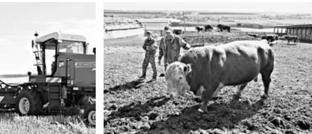
Самый крупный бык герефордской породы в Алтайском крае. Вес Степана около 1700 кг.