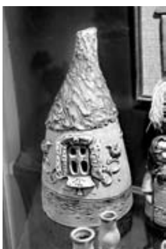
«Кто-то в теремочке живет!..»

со вниманием К берегам крутояры-глинушки Да положит поклон, не тая греха, Вмиг получит любовь-исцеление От родимой своей доброй матушки.