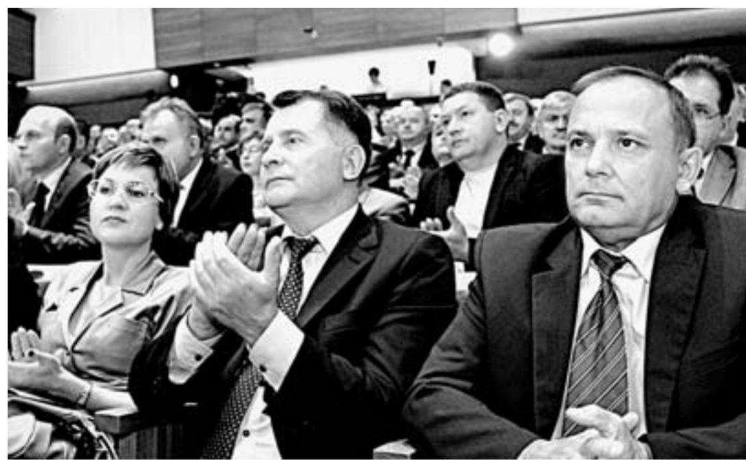
Во время пленарного заседания.

Академик назвал инвестицию топливом экономики и раскритиковал пессимизм правительства: – Если мы посмотрим правительственные прогнозы (уже есть до 2018 года), то увидим, что в них размер инвестиций снижается. А по планам государственных вложений в основ-