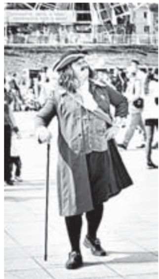
В День города некоторые барнаульцы вышли в костюмах исторических персонажей.

5 сентября Барнаул широко отпраздновал свое 285-летие. Корреспонденты «АП» побывали на самых интересных праздничных площадках.