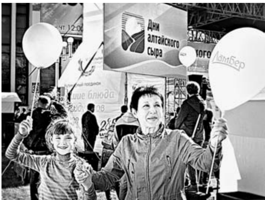
На сырный праздник барнаульцы приходили с детьми.

Через проспект Ленина от «Города мастеров» развернулась большая национальная деревня. На площади Советов прошел большой фестиваль национальных культур. Более 30 диаспор и культурных центров Алтайского края сделали свои презентации. Каждая хотела удивить