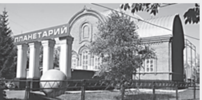
Звездный дом - место свиданий с вечностью.

Луна в фазе последней четверти восходит в полночь, новолуние во Льве