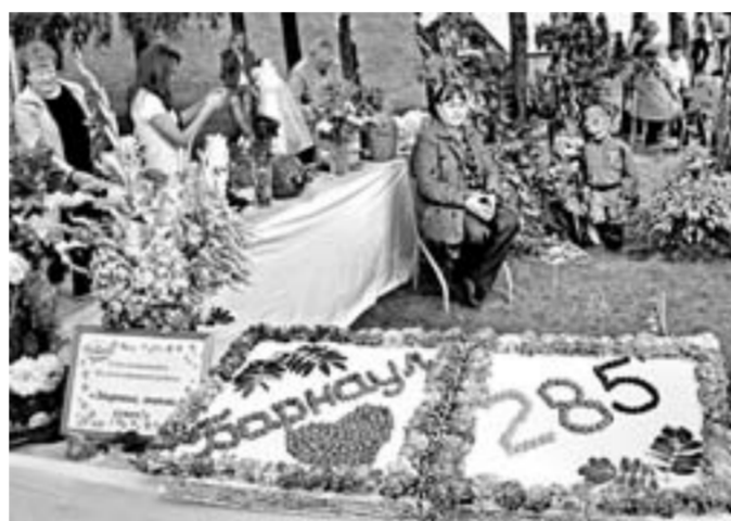
В День города в Барнауле можно было увидеть оригинальные открытки.

«Барнаул день ото дня преобразуется, становится краше. Здесь создаются новые объекты культуры, здравоохранения, образования. Барнаул сегодня позиционируется как город, где созданы все условия для реализации жителями своих мечтаний и жизненных целей, получения достойной профессии, создания семьи, дальнейшего воспитания детей. Я абсолютно убежден, что в этом основополагающая роль отведена вам, жители краевой столицы. Никакое дело не будет успешным, если не ведется совместная работа, нацеленная на результат. Сегодня мы с удовольствием отмечаем, что в Барнауле царит атмосфера соратбата