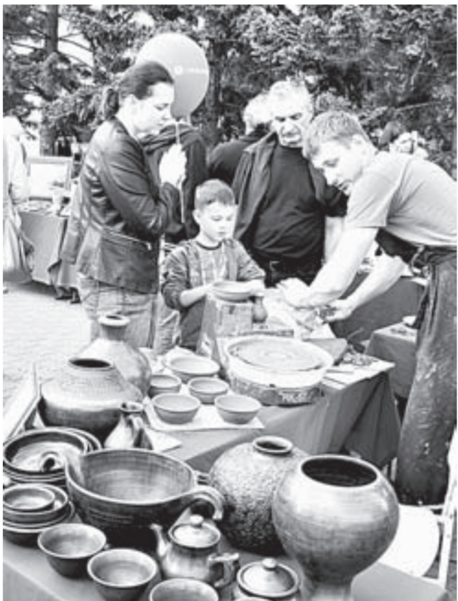
Гончары провели для горожан мастер-классы.

Открывая сырный фестиваль, губернатор Алтайско-