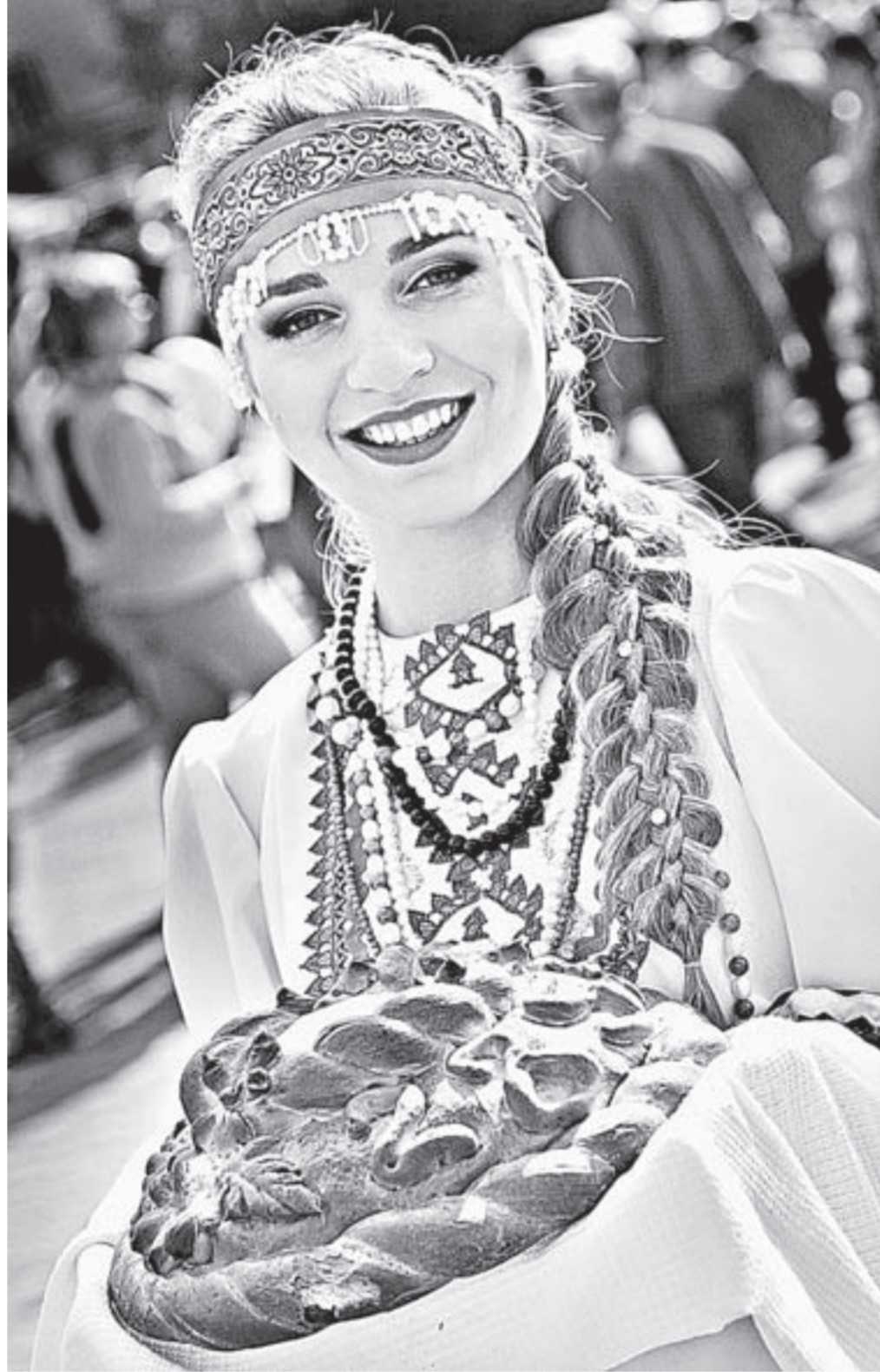
Барнаул – город гостеприимных и красивых людей!