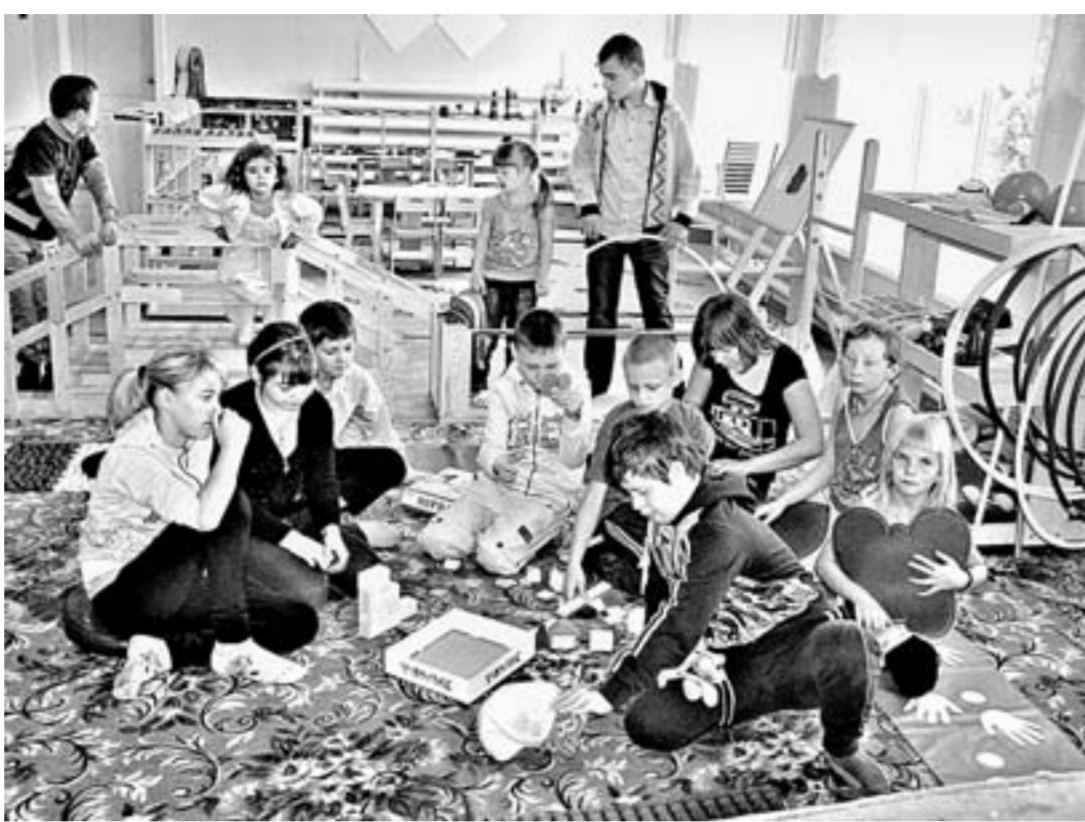
Подопечные комплексного центра с удовольствием занимаются в комнате Монтессори.

В этом году 30 детей с ограниченными возможностями посещают групповые и индивидуальные занятия комплексного центра. Они способствуют становлению товарищеских отношений и доверия в детском коллективе, активизации двигательной сферы, мелкой моторики, развитию мышления, воображения, речи, социального поведения. Центр работает в рамках долгосрочной целевой программы «Дети Алтая» и гранта Фонда поддержки детей, находящихся в трудной жизненной ситуации.