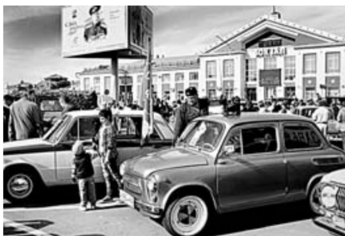
Большая выставка ретроавтомобилей прошла в День города на автовокзале.

«Стрижи» показали настоящий спектакль в небе. Под гул моторов реактивных самолетов толпа радостно кричала