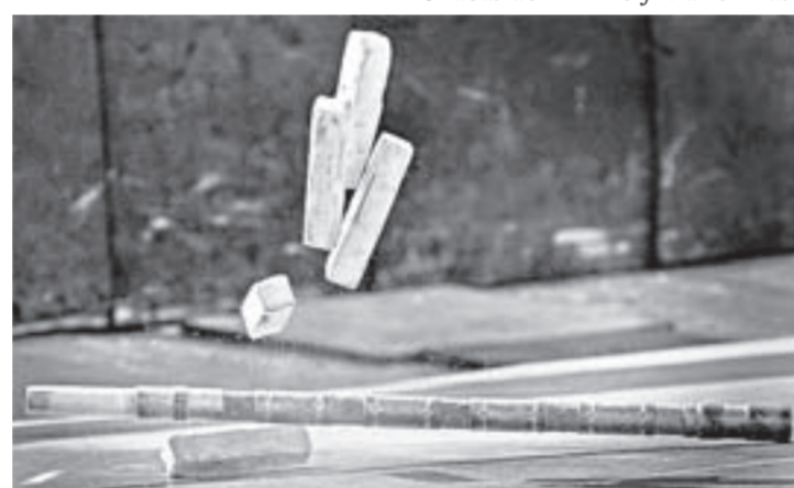
«Пятя из пятых».