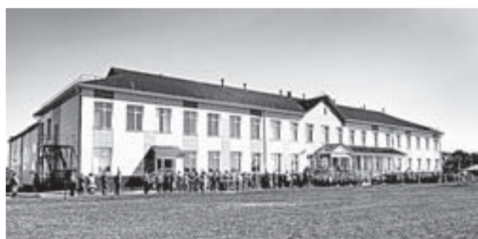
Новое здание Солоновской средней школы.

– Я знала, что приеду сюда на работу, – рассказывает учительница. – Поняла это, когда проходила практику. Тогда все очень понравилось. В нашей старой школе была теплая атмосфера: учителя как могли создавали уют, комфортную обстановку для учеников. Думаю, такое отно-