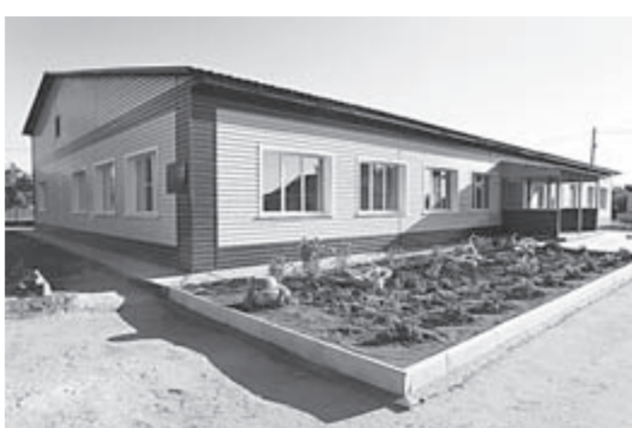
Ясли-сад уже почти готов принять детей.

Вообще, образовательная сфера Родинского района заметно улучшается. С 2008 по 2015 год здесь отремонтиро-