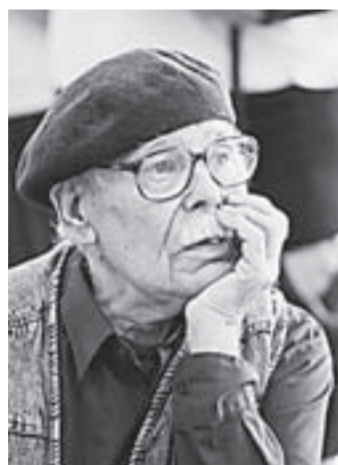
Народный художник России Михаил Будеев.

В Выставочном зале открылась большая экспозиция, посвященная 75-летию Союза художников Алтайя. Выставка «Осень-2015» – это порядка 250 произведений живописи, графики, скульптуры и декоративного искусства, а также искусствоведческие издания и художественные альбомы. Особенностью юбилейной экспозиции стало присутствие работ ушедших из жизни классиков алтайского искусства, причем зачастую эти вещи позволяют по-новому взглянуть на их творчество.