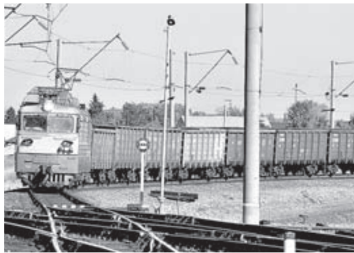
Тормозной путь такого состава почти километр.