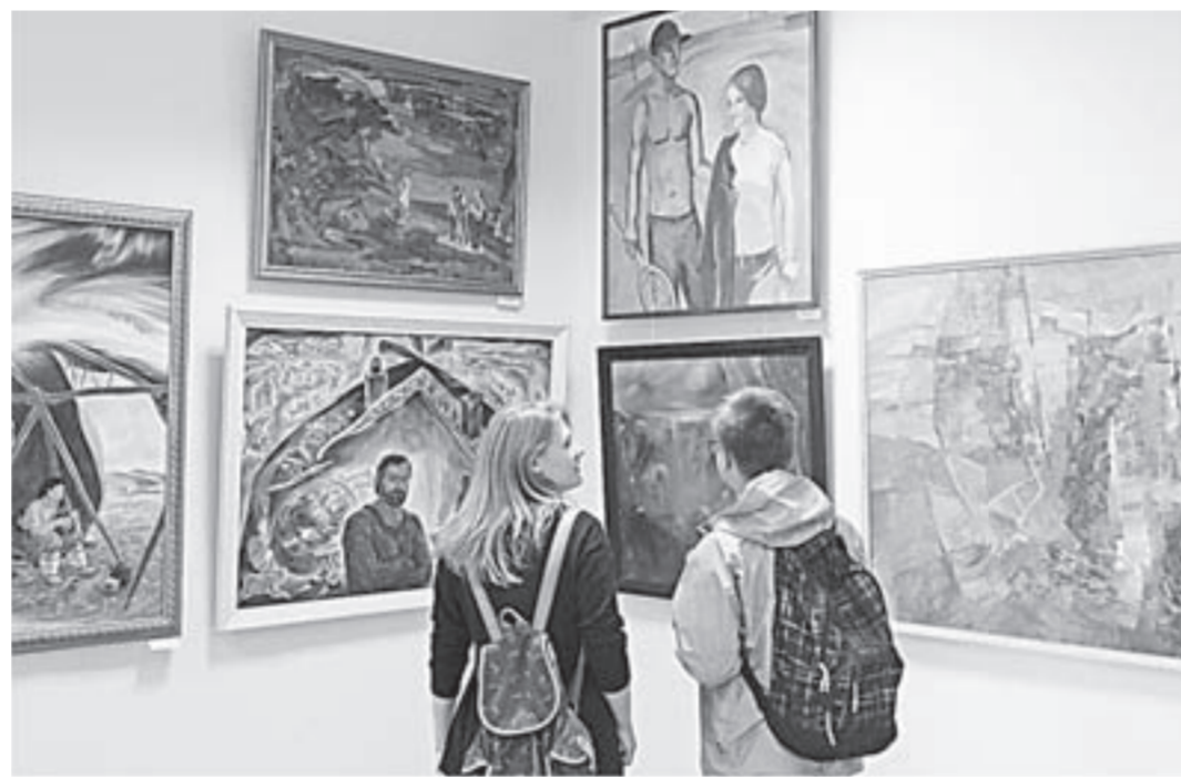
В экспозиции представлены различные темы и жанры алтайского искусства.