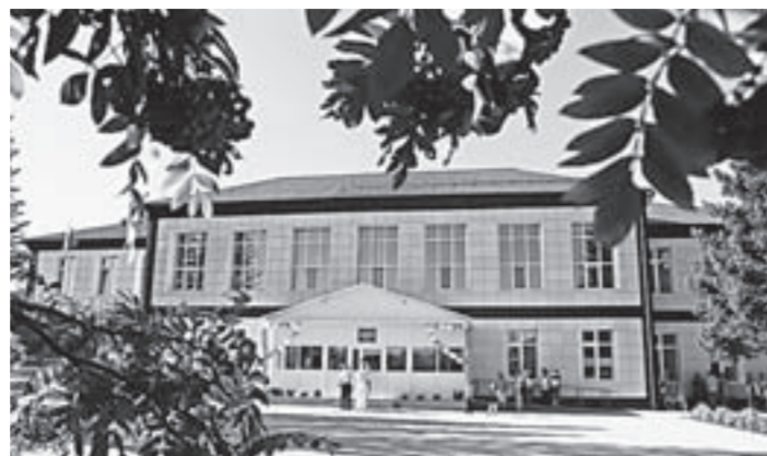
Родинская средняя школа № 1 после реконструкции изменилась полностью.

классов, появились кабинеты домоводства, кулинарии. Ремонт позволил нам перейти на занятия в одну смену для учащихся 5-11 классов.