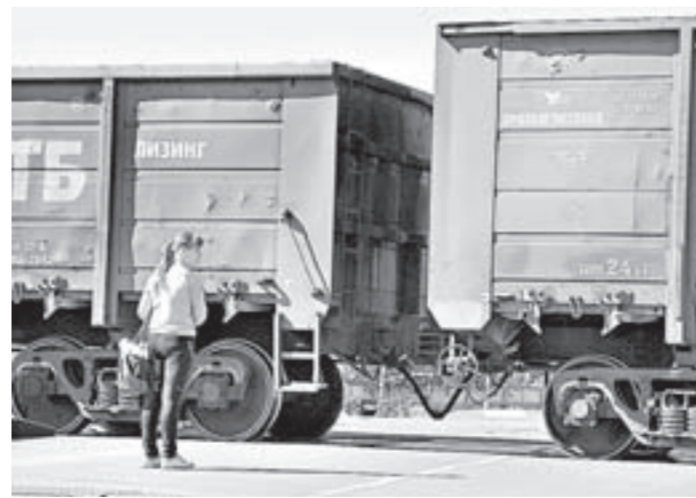
Нарушителей не останавливают ни звуковые сигналы, ни шлагбаумы.

«И быстрее, шибче воли, поезд мчится в чистом поле...» — эти строки из популярной песни Нестора Кукольника посвящены первой в России железной дороге.