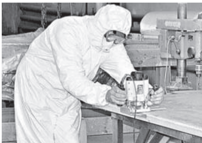
Российские поддоны не хуже, чем австрийские.

Краевые производители стройматериалов реализуют на практике политику импортозамещения.