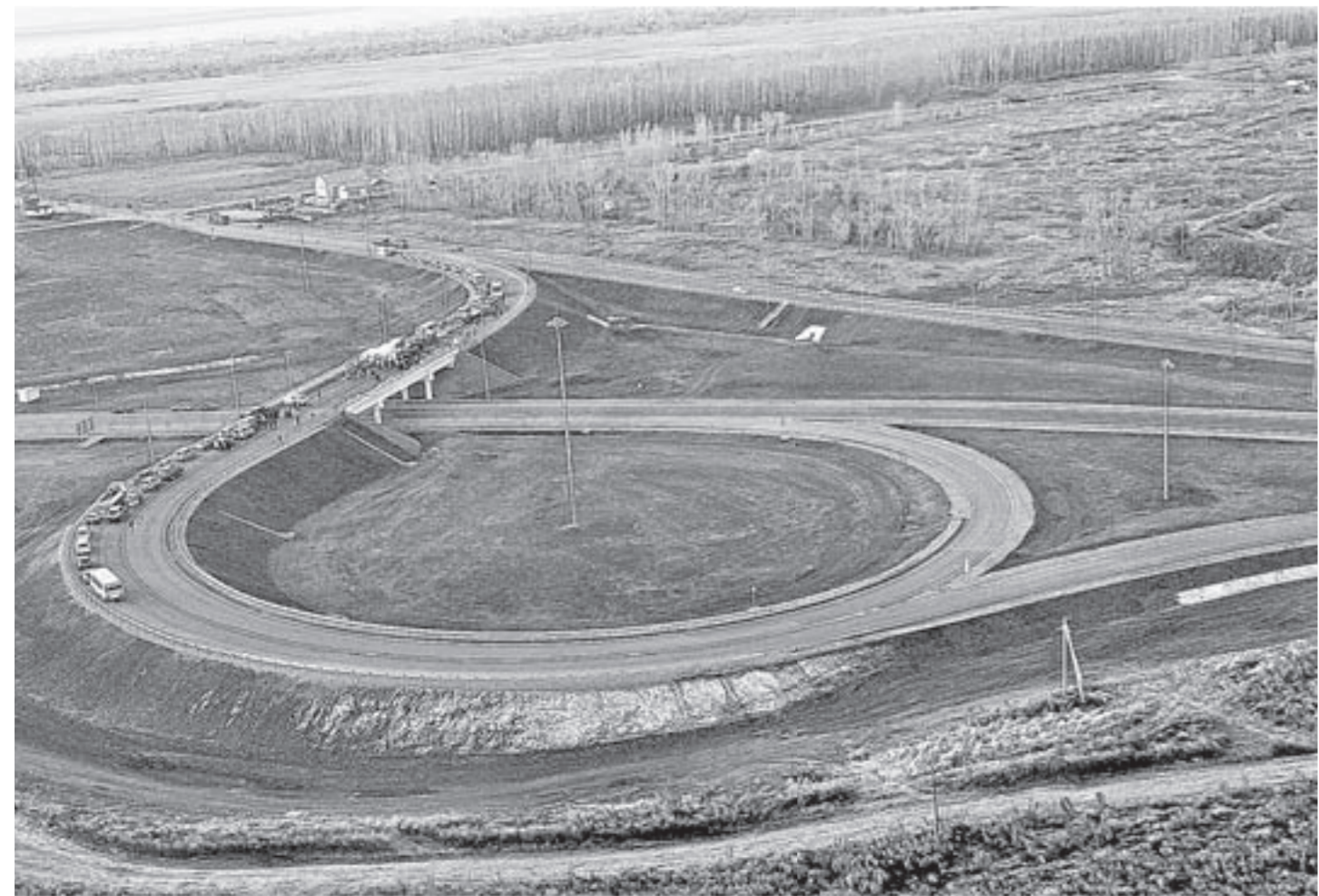
Современные дороги сделали поездки по региону быстрыми и удобными.

Поголовье крупного рогатого скота специализированных мясных пород и по сравнению с 2005 годом возросло в 5,4