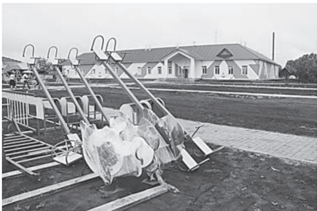
Будущий детсад – украшение села.