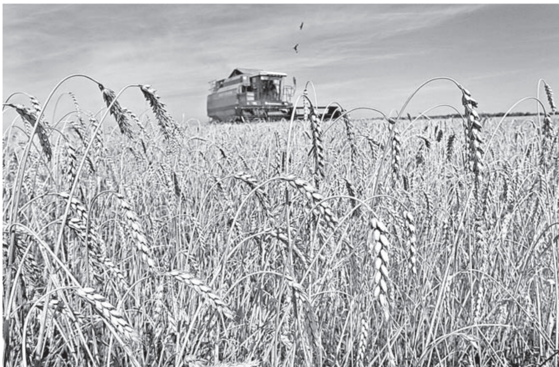
Более 46 млрд рублей – таков объем господдержки сельского хозяйства за последнее десятилетие.

В пищевом производстве компанией ООО «Агро-Сиб-Раздолье» построен современный высокотехнологичный маслоэкстракционный завод производительностью 500 тонн подсолнечника в сутки. На ООО «Третьяковский маслосыровзавод» введено в эксплуатацию оборудование по производству твердых сычужных сыров. ООО «Алтайская буренка» ведет выпуск продукции в ПЭТ-бутылках. На ЗАО «Эвалар» возведено здание завода по производству функциональных продуктов питания и натуральной косметики, ведется строительство завода по производству твердых лекарственных форм. ООО «Розница-1» построен крупный распределительный центр в г.