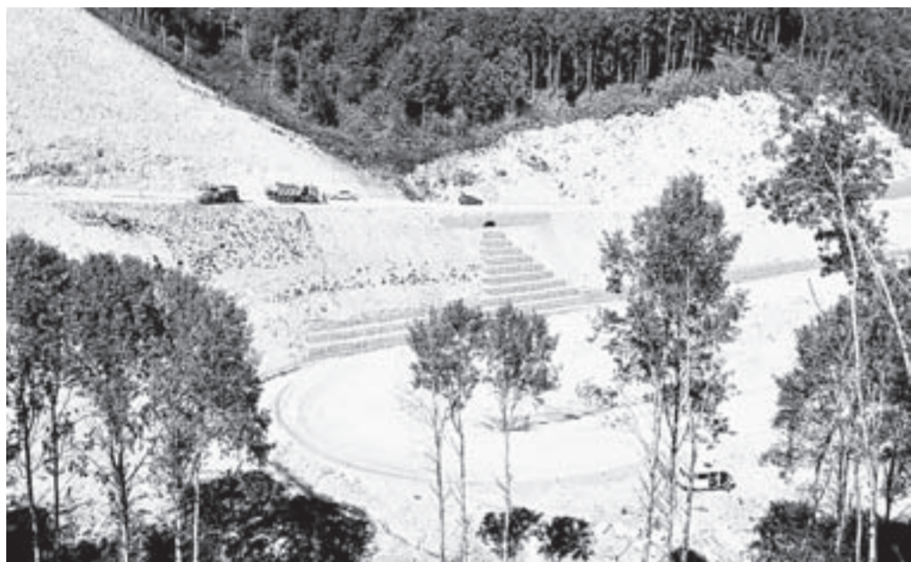
Панорама завораживает. Когда работы завершатся, серпантинная дорога будет востребованной среди туристов-автомобилистов.