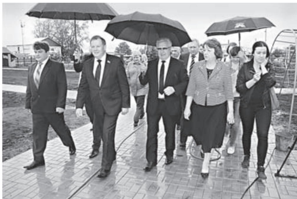
Новое дошкольное учреждение посетили представители краевых властей.

В селе Первомайском завершается реконструкция детского сада, рассчитанного на сто мест. Второе для села дошкольное учреждение создается на месте бывшего детского дома. Объект посетили председатель АКЗС Иван Лоор и заместитель губернатора Алтайского края Юрий Денисов.