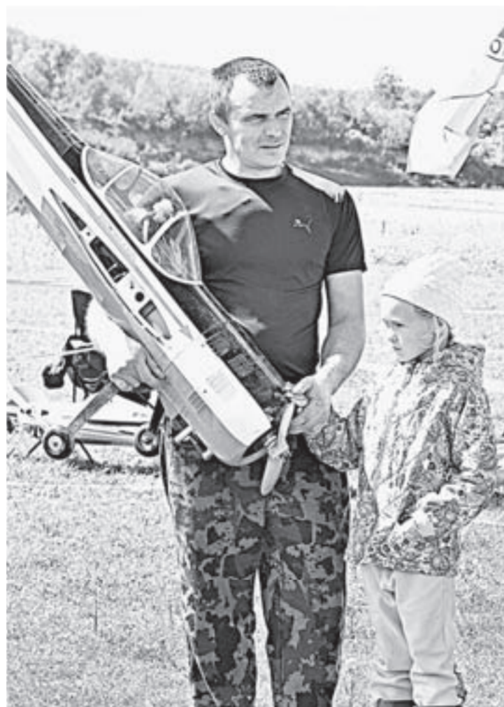
Скоро, дочка, полетишь!