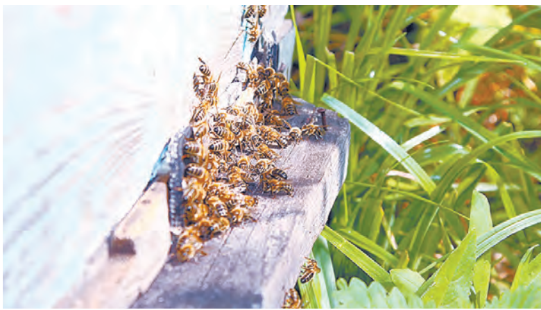
Крылатые полосатые труженицы.

тают самостоятельно. Он им помогает встать на ноги. Разнотравья в округе на всех пчёл хватает. Чайное стоит в тупике, природа вокруг первозданная, цветёт пышно, людей почти не видно. На северо-востоке от него, за горами, на 70 километров нет населённых пунктов. С другой стороны до ближайшей деревни 30 километров. Единственная проблема – медведи. Мёд мой собеседник начинает качать позже других, не раньше конца июля, когда другие уже по разу его собрали. Любит, чтобы он созрел.