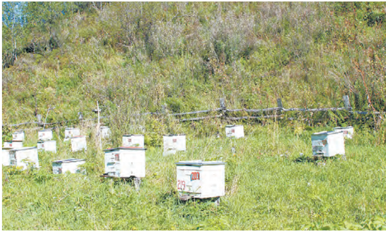
Пасека в селе Чайном.