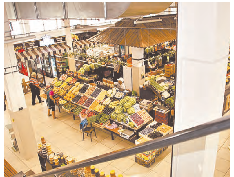
Вид первого этажа рынка «Янтарный» с эскалатора.

Головной офис «Корзинки» осуществляет для магазинов поставки товаров по относительно низким ценам, в основном используя