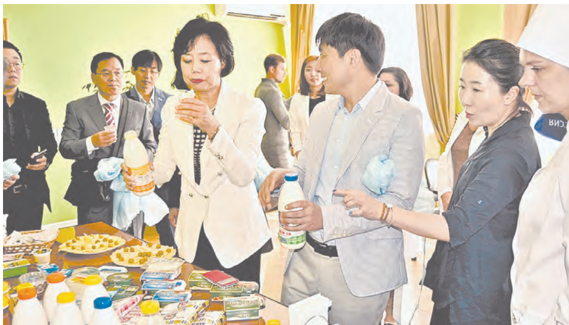
Представителям Республики Корея очень понравилась производимая в Алтайском крае молочная продукция.

Делегация провинции Кангвон Республики Корея работала в регионе 10-13 августа. За это время гости посетили компанию по выпуску продукции из облепихи «Алтай-Занддорн», ряд мараловодческих предприятий, ориентированных на пантопереработку: компанию «Пантопроект» и мараловодческое хозяйство в селе Никольском. Также они побывали на Барнаульском молочном комбинате, где продегустировали производственную линейку предприятия. Особый интерес вызвали творог и продукция на его основе – творожные массы, глазированные сырки, творожные десерты.