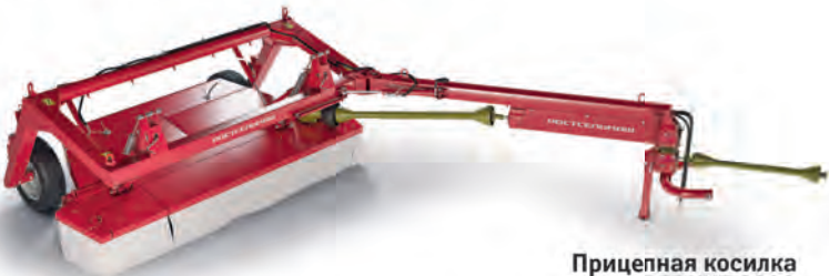
Прицепная косилка BERKUT 3200

рабочая скорость до 15 км/ч, ширина захвата до 3,2 м, производительность 5,2 га/ч.