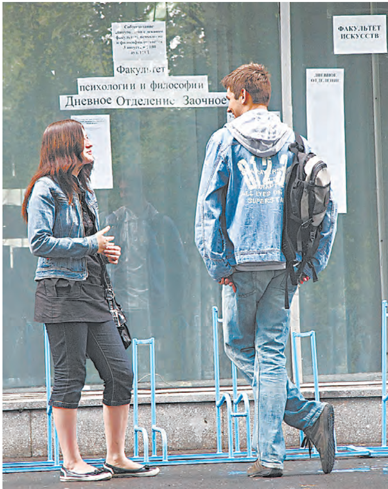
Менеджерами и психологами по-прежнему стремится стать большинство абитуриентов.

Мечтают получить техническое образование и представи-