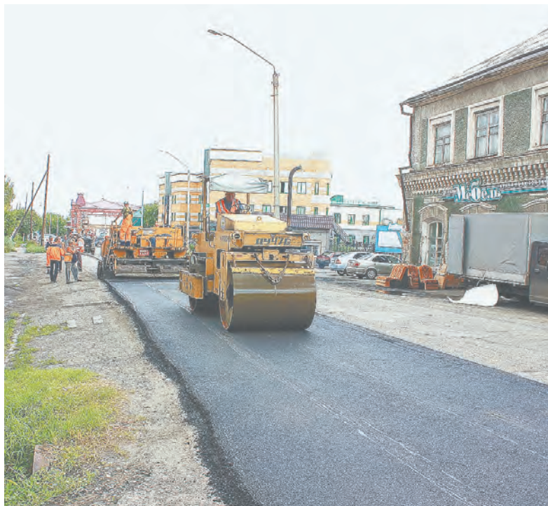
Самые проблемные участки дорог Камня-на-Оби к ноябрю будут отремонтированы.

ал Центрального ДСУ выполнит на городских дорогах ремонтных работ на сумму 9 миллионов 924 тысячи 628 рублей. Около 95% этой суммы – средства краевого бюджета, остальные – из местной казны. Шесть самых проблемных участков на улицах Ленина, Колесникова, Первомайской, перекрестке улиц Гагарина и Колесникова до конца октября будут приведены в надлежащий вид.