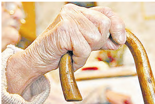
Встреча в магазине оказалась для бабушки роковой.