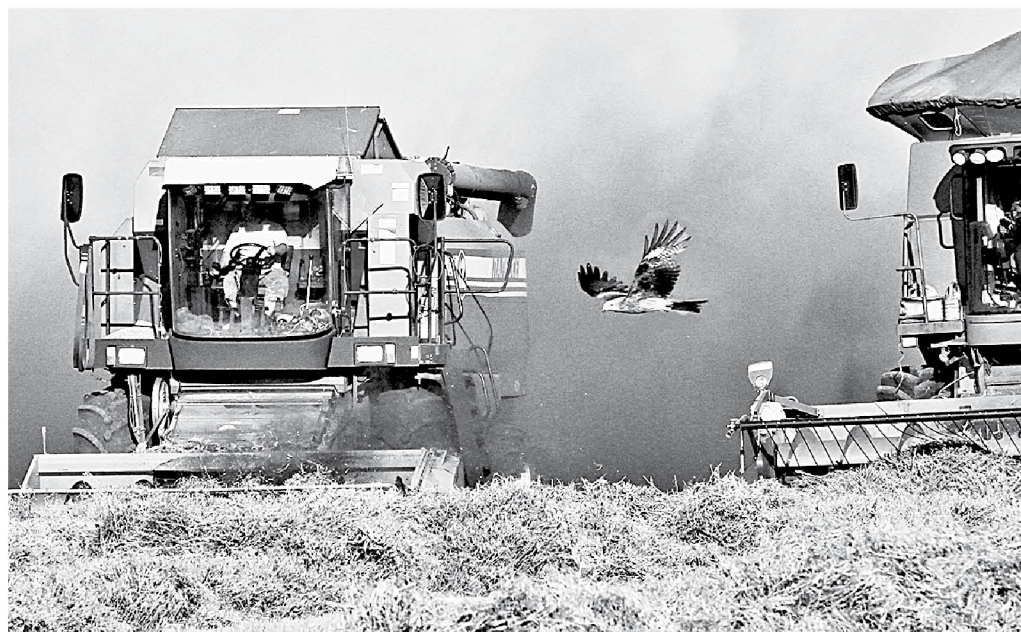
Работа в поле найдется каждому.