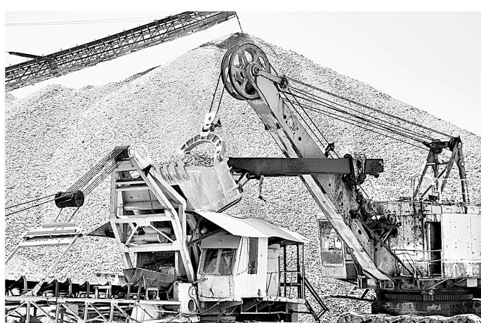
Один ковш экскаватора – это полный грузовой автомобиль.

Но, сами понимаете, возникают все эти объекты не из воздуха. А ведущим в Сибири региональным поставщиком нерудных стройматериалов сегодня можно назвать компанию «Бийский гравийно-песчаный карьер».