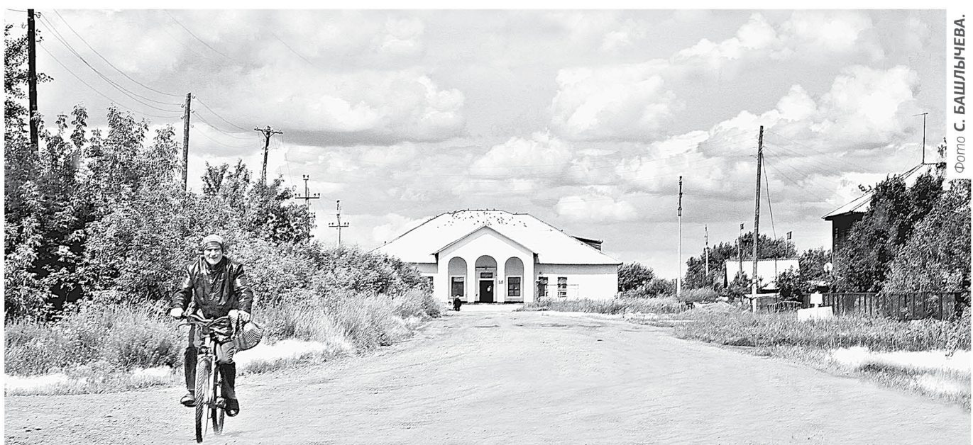
Село – от прошлого к будущему.

В Списке населенных мест по сведениям 1859 года Леньки указаны как деревня при озере Леньки, основанная в 1802 году. Название ей дала рыба, что в изобилии водилась в озерной глубине. В начале XX в Леньках работали кредитное товарищество, склады земледельческих орудий, маслодельня, хлебопекарный магазин, торговые и винная лавки, больница, школа. Как видите, ориентиры социаль-