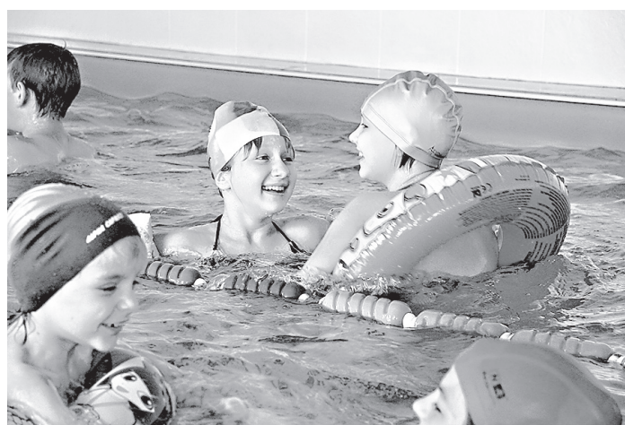
С другом – не страшно!

– В большинстве трудов отечественных и зарубежных специалистов говорится, что с аутичным человеком нужно работать индивидуально, чтобы его внимание не рассеивалось, не было тревоги и паники. Но вне этих искусственно созданных комфортных условий никакой кондуктор в автобусе, уборщица в школе или сверстник в песочнице не станет