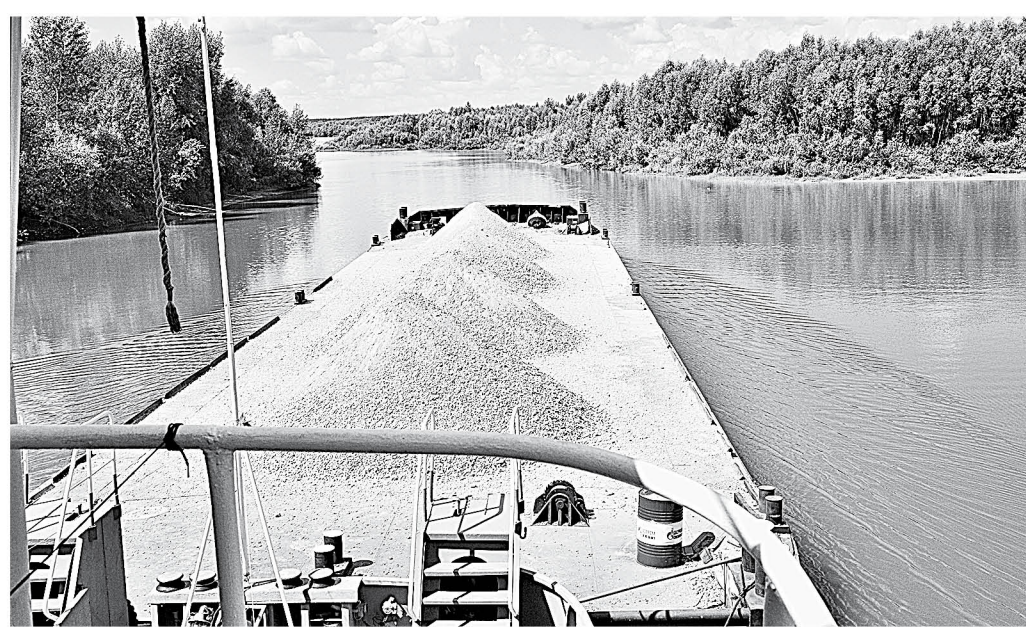
Барна грузиная, курс прямая.

путем за прошедший период навигации. К ее финалу показать должен достигнуть 150 тыс. тонн (о том чуть ниже). Выполнение оставшихся объемов по отгрузке не вызывает сомнений. Годовая производительность БПК свыше 1 млн. тонн. И его основными потребителями являются именно строительные и дорожно-строительные организации. Большая часть грузов транспортируется в Бийск и Барнаул. Причем река позволяет выгодно доставить песок и щебень значительно дальше. К примеру, в Шелабо-