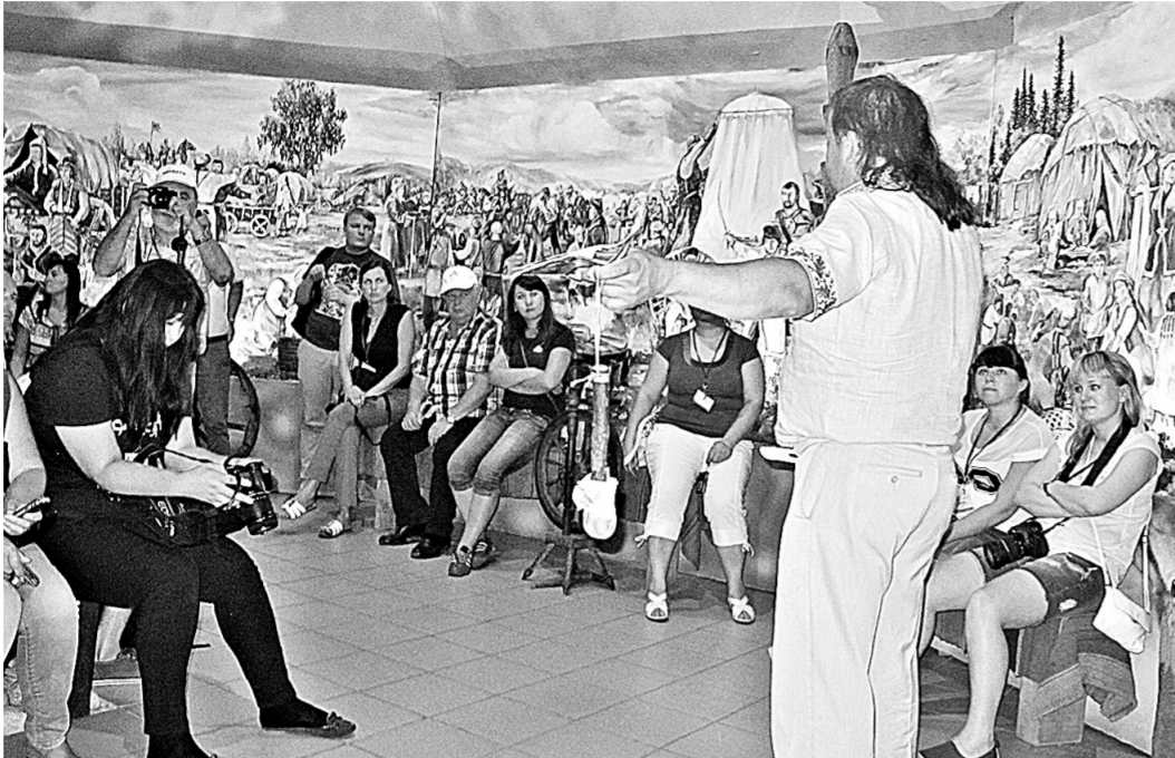
Перед Срогтами журналисты заехали в Художественно-этнографический парк «Легенда».