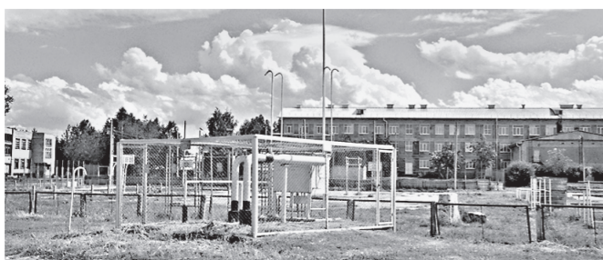
Газораспределительная станция в Озерках.

Природный газ сначала громко шипит рассерженным удавом. Но потом стихает, успокоенный до «кухонного» давления, и долгим образом струится по трубам в указанную