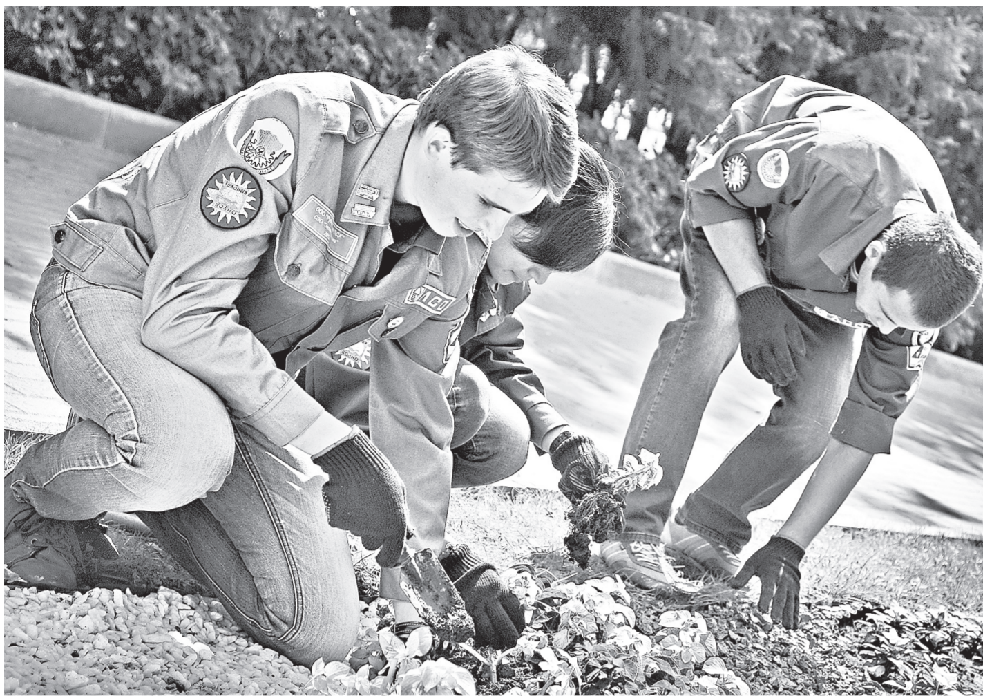
Бойцы экологического отряда трудятся всё лето для того, чтобы барнаульцам было комфортно жить.