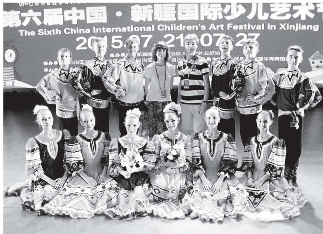
Участие в фестивале танго ранга очень почетно.

Ансамбль народного танца «Калинка» вернулся с VI Синьцзянского международного фестиваля детского творчества.