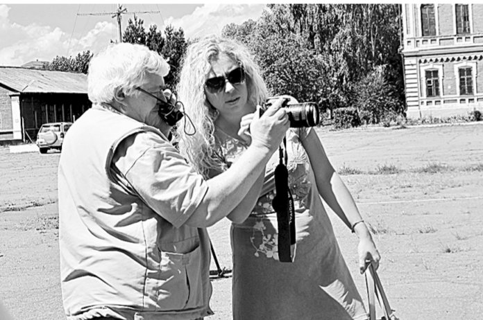
Архирейское подворье, г. Бийск.