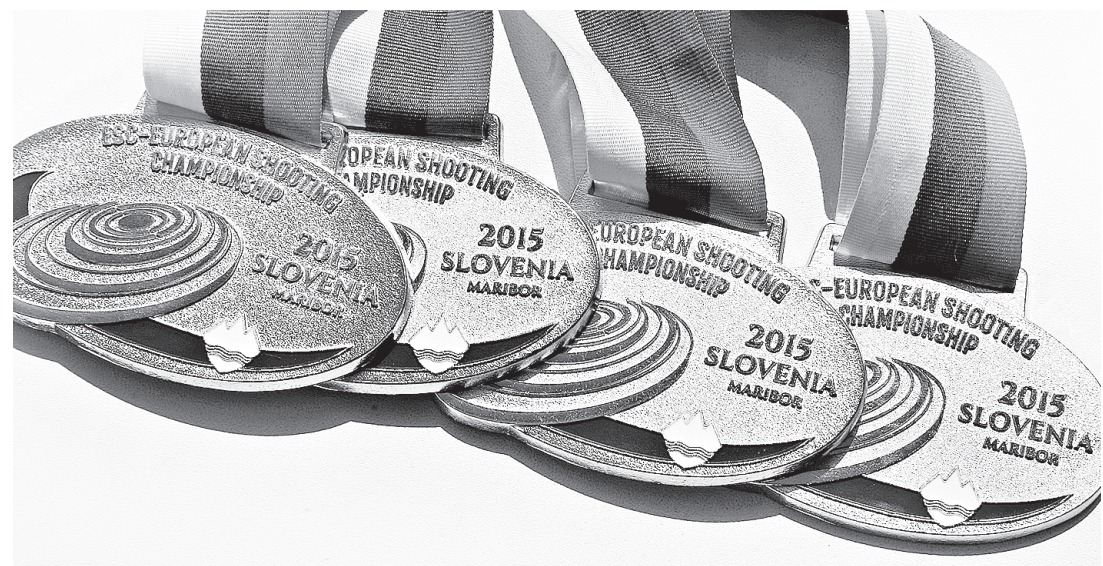
Боевые «сувениры» из Словении.

– Как ново это побить свой же мировой рекорд на соревнованиях такого уровня?