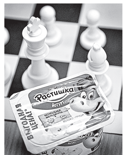
Паёк будущего гроссмейстера.