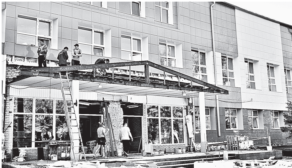
Уже видно, как все будет красиво.