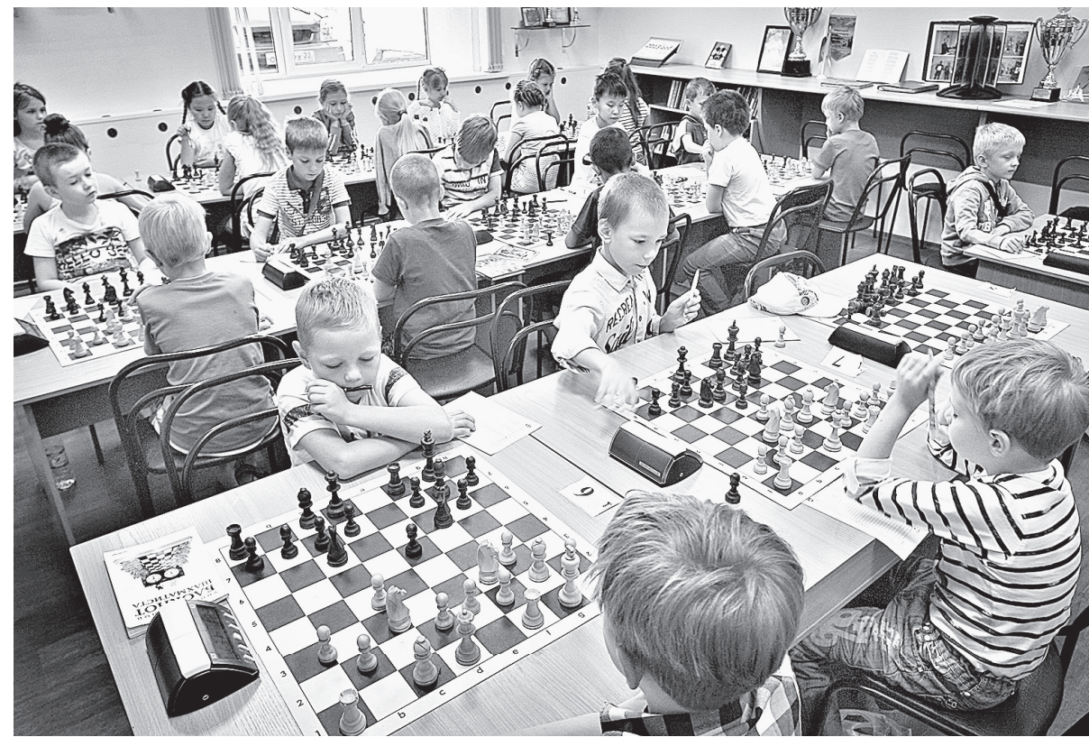
За досками самые юные участники.