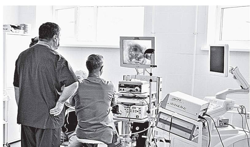
Новые стены – это новое оборудование и новые возможности.

несущих стен, мы решили задачу сохранения и усиления прочности конструкций и элементов корпуса. Новый мансардный этаж – это ведь и дополнительная площадь, и серьезная экономия на фунда-