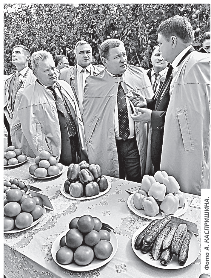
Первый замминистра Евгений Громько (в центре) попробовал на вкус продукцию ОАО «Индустриальный»

Рабочее совещание по вопросу «О развитии агропромышленного комплекса Ал-