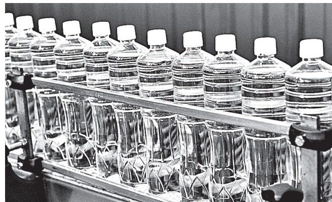
С осени 2013 года «АгроСиб-Раздолье» начало выпускать бутылированное масло под маркой «Янтарь Алтай».

шее тепличное предприятие Сибири ОАО «Индустриальный». Делегация показала новый блок теплиц почти на 12 гектаров и угостили местной продукцией. Объем производства овощей комбината в 2014 году составил 9,223 тыс. тонн. «И это предприятие тоже обречено на успех, – заявил Евгений Громько. – Естественно, теплицы можно построить и в Норильске, но там необходи-