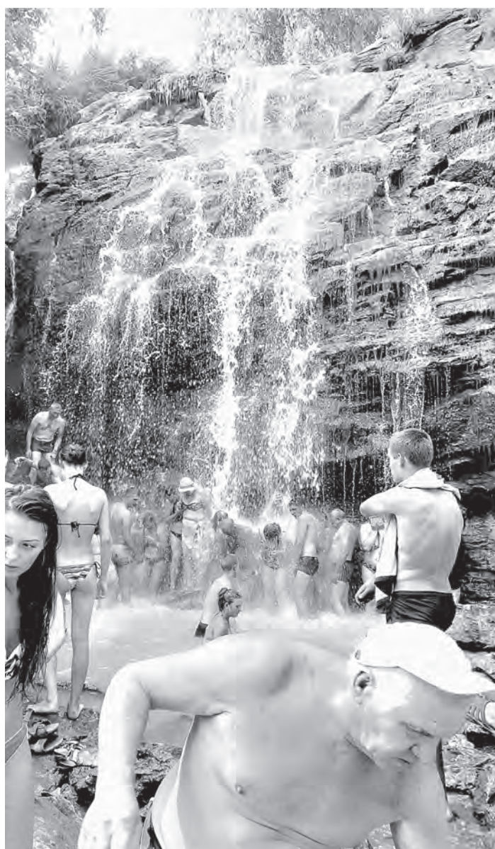
Водопад здесь на удивление теплый.

Пещёрки. Водопад и прилегающая к нему зона отдыха находятся на другой стороне села, перед знаком о границе населенного пункта. Второе удивление после пенника на въезд в зону отдыха (200 рублей за машину в сутки, пешеходы проходят бесплатно) – вот огромное красивое озеро, вот огромная стоянка с бревенчатыми избушками и разнокалиберными палатками – а где же водопад?! Спрашиваем первых встречных и идем еще метров 200. Хотите – верьте, хотите – нет, но всю эту красоту сотворили... военные саперы и железнодорожники. Они добывали здесь щебень для отсыпки трассы, двигали