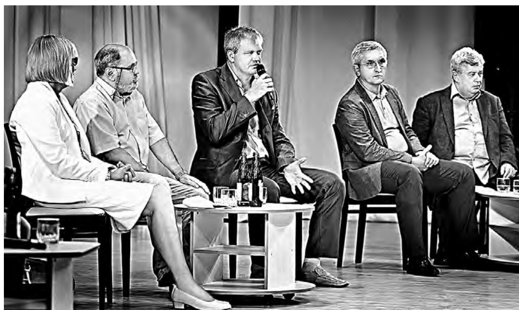
Разговор на тему, что такое профессионализм в журналистике.

В край, где 5 лет назад створела и заново возродилась Николаевка, приехали журналисты из Хакасии, пережившей такую же трагедию нынешним летом. «Они герои уже хотя бы потому, что собрались с духом и продолжают жить. Дай бог журналистам региона сил помогать людям вставать на ноги, строить новые дома, чтобы не было опустошения, во имя будущего внуков и правнуков», — подобрал наших