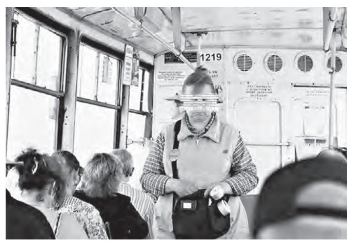
Непростые бывают отношения между пассажиром и кондуктором.

«1 мая, восемь часов вечера. Автобус 17 маршрута трогается с остановки «Привокзальная площадь». Кондуктор идет по проходу, ждет, пока одна из пассажирок, стоящих на площадке у второй двери (там всего-то два-три человека, остальные пассажиры удобно устроились на сиденьях), достанет из сумки проездной билет, и тут же начинает требовать от нее плату за провоз багажа. Багаж – хозяйственная тележка на двух маленьких колесиках с привязанной к ней коробкой с надписью «Мультиварка». Женщина что-то тихо ответила, донесли слова «да, да... другой автобус, где не брали плату...» и что тут началось!..»