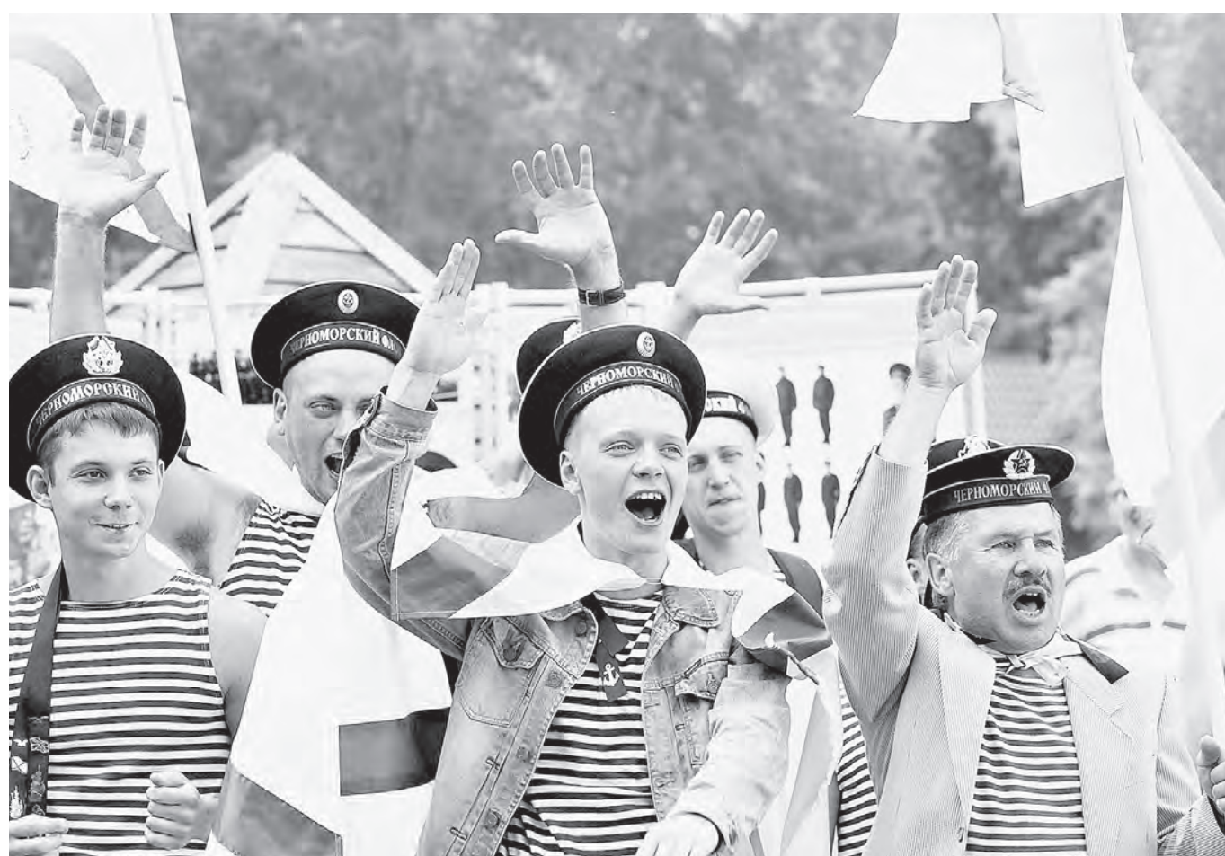
В Барнауле в мероприятиях, посвящённых Дню ВМФ России, приняли участие полторы тысячи человек.

– Каждый год мы посещаем мероприятия, посвящённые ВМФ России. Мы должны понимать, насколько важно мужчине достойно проявить